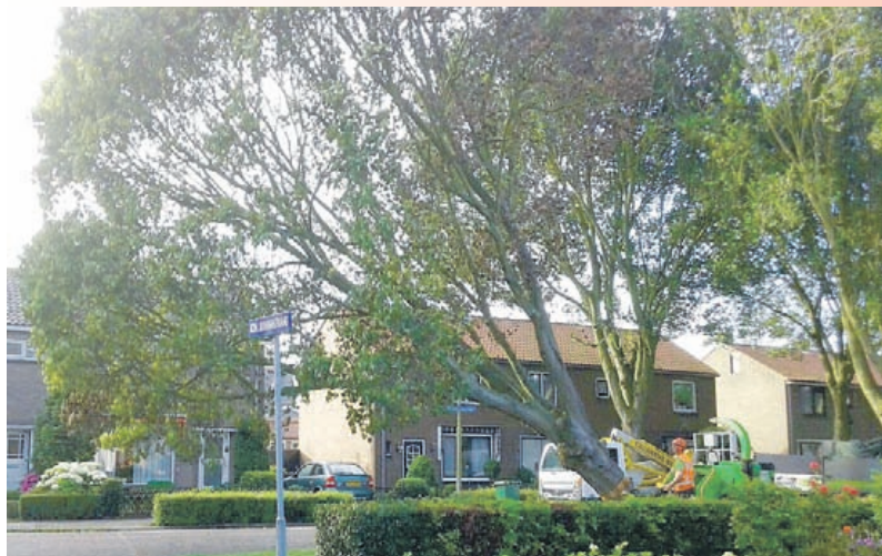
De besmette iep aan de Pr. Bernhardstraat is inmiddels gekapt.