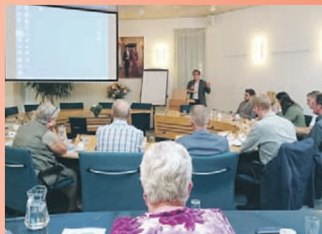
Wethouder Tromp bespreekt de mogelijkheden met de leden van verschillende verenigingen.

Verenigingen zijn hierin heel belangrijk als het gaat om deelname aan activiteiten en vormgeven aan vrijwilligerswerk. Hierover zijn de verenigingen op deze avond met elkaar en de wethouder in gesprek gegaan. Ook is er op deze avond een drietal presentaties getoond van voorbeelden hoe de gemeente de verenigingen hierin zou kunnen ondersteunen. Er is afgesproken dat de gemeente een actieplan opstelt, zodat de verenigingen en gemeente er samen voor zorgen dat alle inwoners van Uitgeest zich betrokken voelen bij hun dorp.