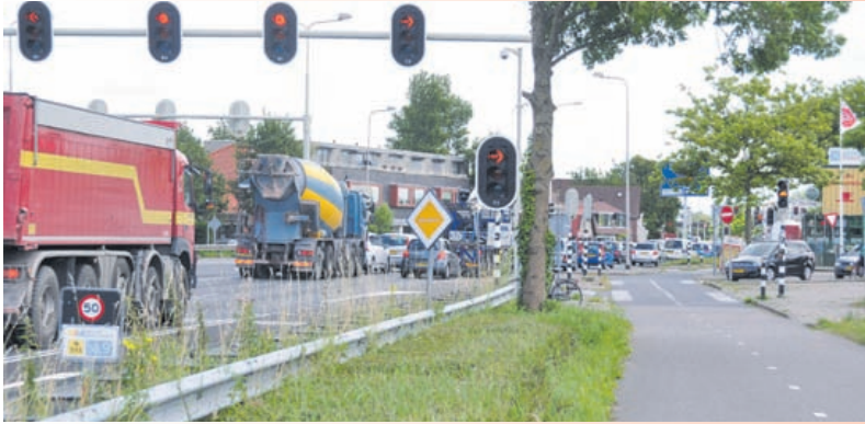
Het verkeer op de N203 in Krommenie.