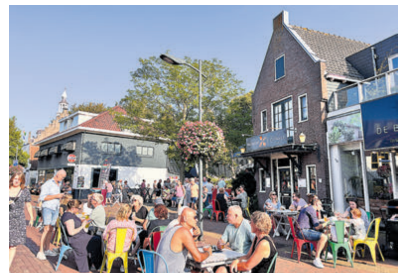
Gezelligheid in het dorpshart tijdens het Castricums Smaakmakers Festival.

De organisatie is al druk bezig om de artiesten te benaderen voor het muzikale programma. Ook de lokale horeca en foodtrucks reageren enthousiast op de voortzetting van het festival. De kunstenaars van de kunstmarkt kunnen alvast aan de slag met het maken van hun eigen creaties. Want ook dit succesvolle onderdeel van het festival krijgt een vervolg. Kortom, vele betrokkenen zijn al druk aan de slag met de organisatie van dit geweldige evenement. Noteer zaterdag 6 en zondag 7 september in de agenda en laten we samen zorgen voor nog meer 'reuring' in Castricum!