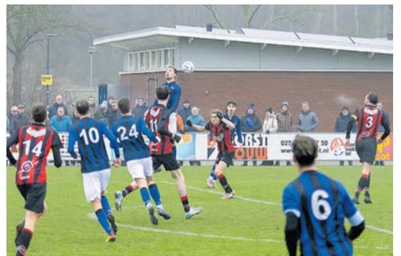
Ondanks een licht overwicht in het begin van de wedstrijd lukte het de thuisploeg niet om te scoren.