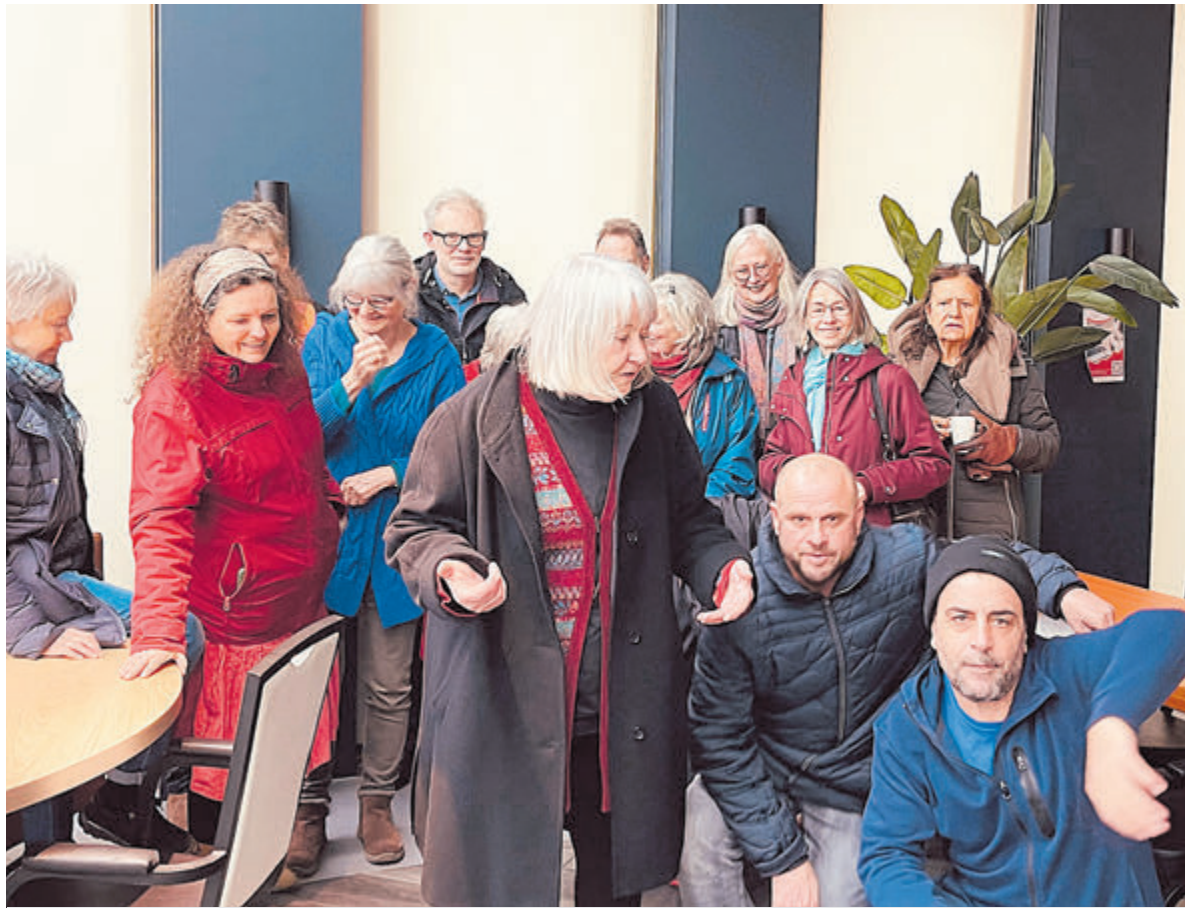
Op de website www.samencastricum.nl kan een steunbetuiging achtergelaten worden. Samen Castricum zorgt ervoor dat de man deze steunbetuigingen te horen krijgt.