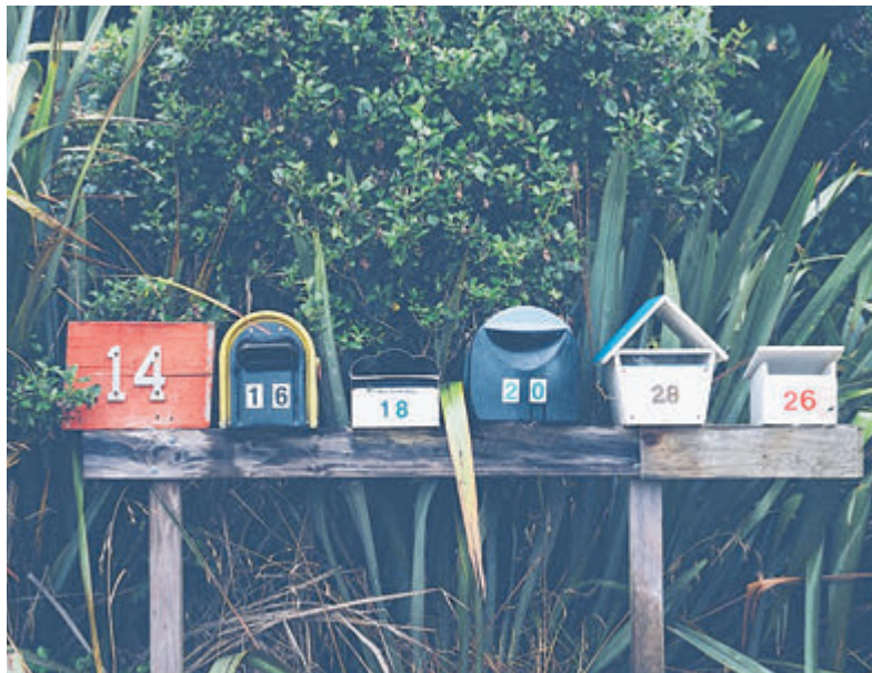
Op de website www.samencastricum.nl kan een steunbetuiging achtergelaten worden. Samen Castricum zorgt ervoor dat de man deze steunbetuigingen te horen krijgt.

Castricum - „Kom op gemeente Castricum en neem je verantwoordelijkheid voor huisvesting.“ Dat eisen een vijftiental mensen die zondag jl. naar hotel Van der Valk in Akersloot kwamen. Dit deden ze om een 41-jarige man in hongerstaking een hart onder de riem te steken. Hij woont nu vijf maanden in het hotel. ‘Castricum voor Iedereen’ en ‘Samen Castricum’ ondersteunen de actie.