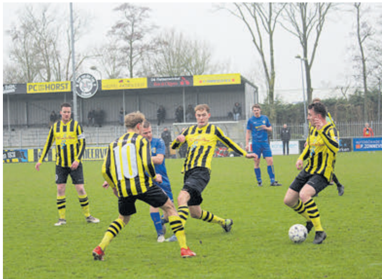
Scrimmage tijdens Meervogels- LSVV.

14.00 uur FC Uitgeest 1 - Meervogels '31 1