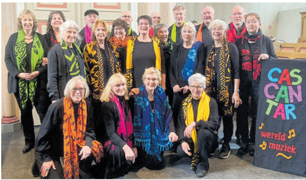
Het koor brengt meerstemmige zang uit diverse landen.