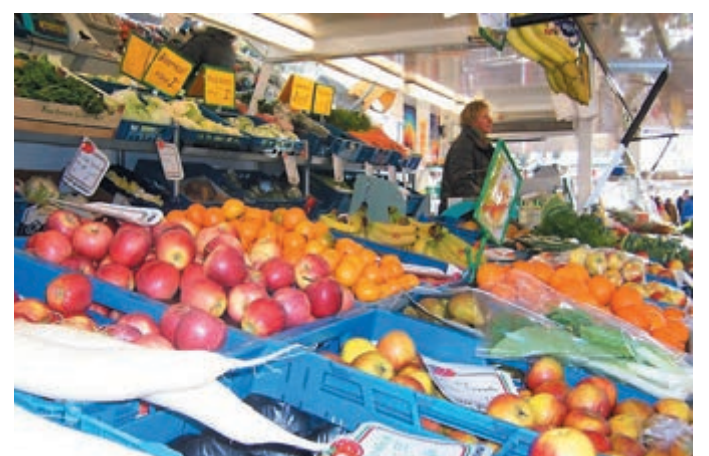
Komt u maar! Wie maakt me los?

Ideeën hebben de markt mensen genoeg: het compacter maken van de markt, minder ruimte tussen de kramen en het verschuiven van de markt richting Bakkersplein en/of Dorpsplein. Ook zijn er plannen voor een duidelijker communicatie. Er komt een vervolg bijeenkomst om echt knopen door te hakken, zodat het gezamenlijke doel van een leuke gezellige markt kan worden bereikt. (Met dank aan Aart Tóth)