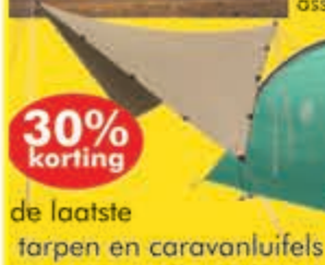
de laatste tarp en caravanluifels

We danken al onze klanten voor het bezoeken van onze winkel en nodigen iedereen uit om de laatste koopjes te scoren op het hele assortiment outdoor, kamperen, kleding en ski.