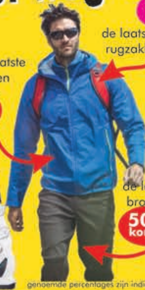
de laatste rugzakke