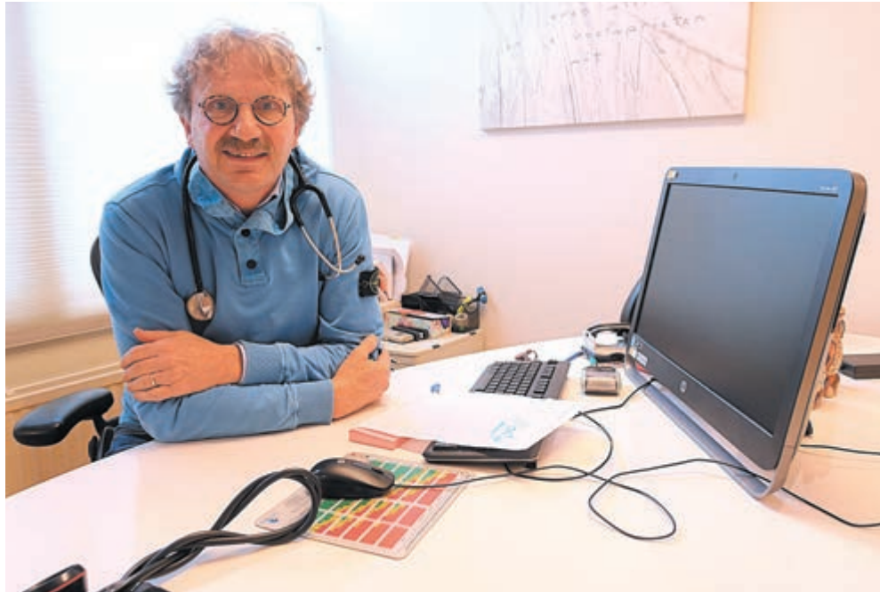
De scheidende dorpsdokter in de praktijk aan de Cieweg.

Tel. 0251 - 652 430 Burg. Mooijstr. 29/37 Castricum