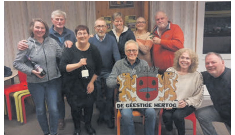
De cast van het blijspel.

Akersloot – Op het landgoed van de hertog, dat bestierd wordt door een mysterieuze huishoudster, komen allerlei lieden van verschillende pluimage langs met uiteenlopende bedoelingen. En, spookt het nu wel of niet in het oude huis?