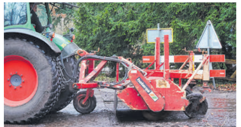
Tekst en foto: Bert Westendorp

www.castricummer.nl/aanmelden-nieuwsbrief en meld je aan