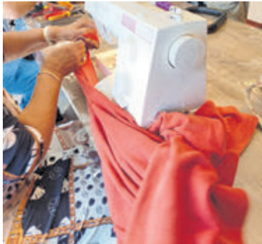
SAKKIE'z worden gemaakt van reststoffen.

Wil je zeker zijn van een plekje? Meld je dan aan via ans.martens@outlook.com . Geef daarbij aan of je een naaimachine meeneemt. De inloop start om 10:00 uur, dus zorg dat je op tijd bent om gezellig mee te doen.