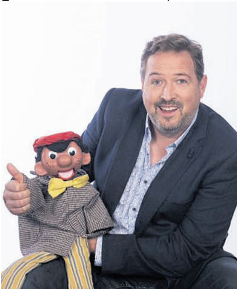
Een gloednieuwe voorstelling met buikspreekacts en goocheltrucs.

Castricum - In Theater Koningsduyn kunnen kinderen op zondag 9 februari om 15.00 uur kijken naar een gloednieuwe voorstelling van poppenspeler en goochelaar Matthijs Vlaardingerbroek. Het is een verhaal over een verloren zoon, die in zijn wijsheid dacht dat hij de weg wel wist. Uiteindelijk wordt hij echt wijs en ontdekt hij de weg terug naar het huis en het hart van de vader. Een interactieve voorstelling van ongeveer vijftig minuten met meerdere buikspreekacts, nieuwe goocheltrucs en een Bijbelse boodschap.