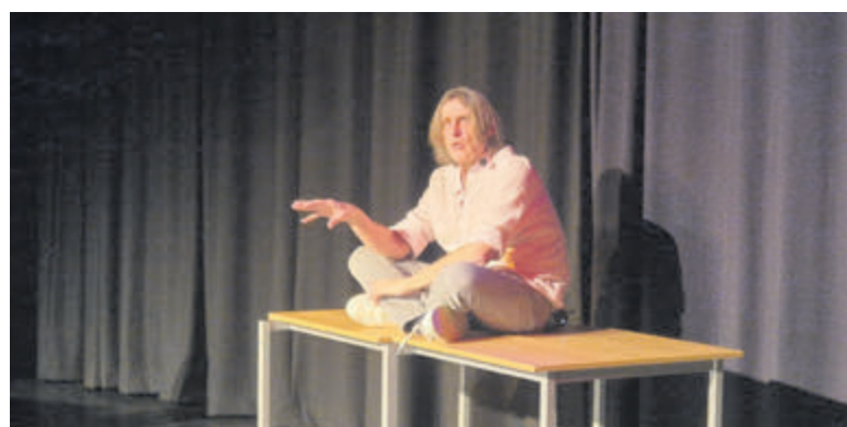
Meer weten? Kijk op www.demazzelvanpech.nl .

Gedurende de hele voorstelling lag geleidehond Jaap gemoedelijk in een hoekje. Jaap is pas enkele maanden geleden in Franks leven gekomen, nadat hond Sjoerd met pensioen was gegaan. Een behoorlijk contrast, in letterlijke zin, want: Sjoerd is een blonde hond, terwijl Jaap zwart is. Maar ook wat eigenwijzer, zo blijkt al snel uit de anekdotes. Maar: „Het was liefde op het eerste gezicht tussen ons.“ Op de vraag of hij Sjoerd, die liefdevol is opgevangen door vrienden, nog wel eens ziet, antwoordt Frank: „Ja, ik ben er laatst nog geweest. Maar dat moet ik niet meer doen. Dat is heel verwarrend voor Sjoerd.“