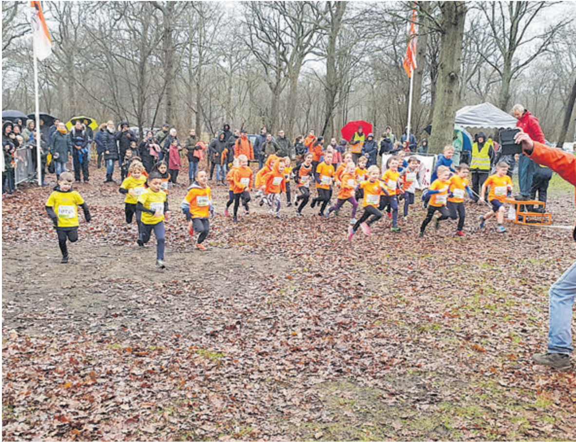
De start en finish van alle afstanden vindt plaats tegenover Bakkums Hoeve, de groepsaccommodatie op de camping.