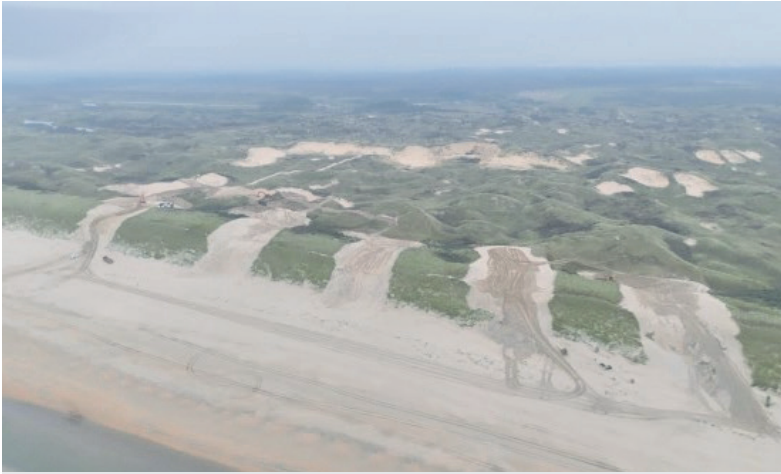
De Zuidernollen in Castricum.

Castricum – De Zuidernollen, het bijzondere duingebied ten zuiden van Castricum aan Zee, heeft een flinke opknopbeurt ondergaan. Met het graven van vijf brede kerven in de duinenrij krijgt dit natuurgebied zijn dynamiek terug.