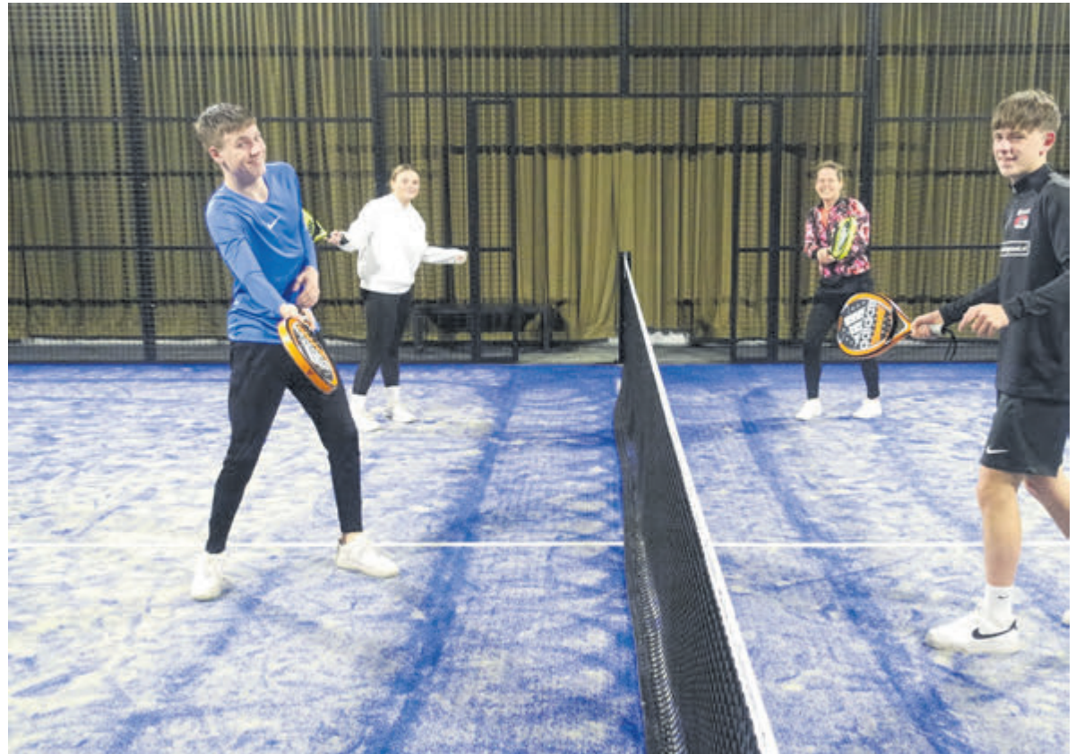
Moet de parkeernorm voor padelbanen omhoog?

De herziening zou ook nodig zijn omdat diverse parkeerplaatsen ongebruikt blijven en de loopafstand naar een parkeerplaats volgens GroenLinks best wel wat hoger zou mogen, terwijl ook het gebruik van deelauto's het nodige zou kunnen opleveren. Brinkman had een aantal voorstellen om een en ander aan te scherpen. Omdat hij niet eerder vragen had gesteld over de inpasbaarheid en juridische houdbaarheid daarvan, wilden andere partijen eerst een reactie hierop van het college alvorens deze voorstellen te kunnen beoordelen. Harold Ebels (D66) kon zich in grote lijnen vinden in de nota en werd