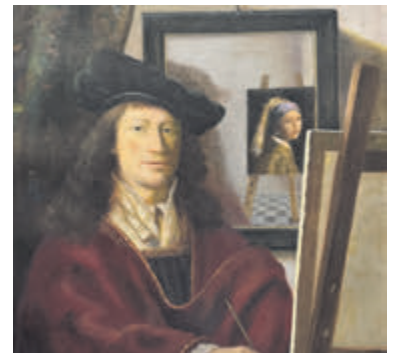
Portret van Johannes Vermeer.

De ingang is achter de fontein (hoofdingang receptie) en de expositie is uitsluitend te bezichtigen van maandag tot en met vrijdag.