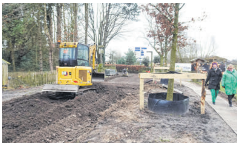
De oprijlaan is in de tweede helft van februari klaar. Tekst en foto: Bert Westendorp