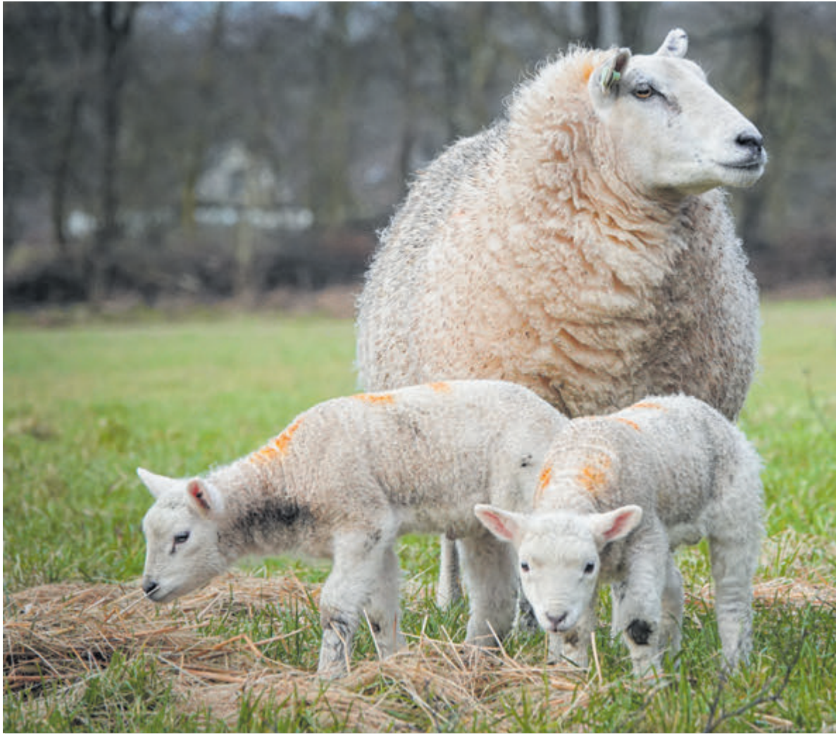
Twee lammetjes in het weiland aan de Bleumerweg.