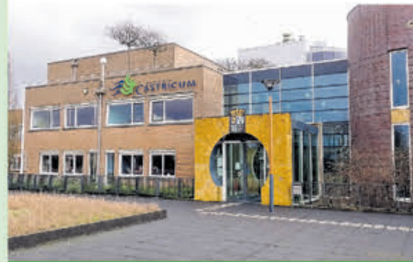
Gemeente Castricum • Raadhuisplein 1