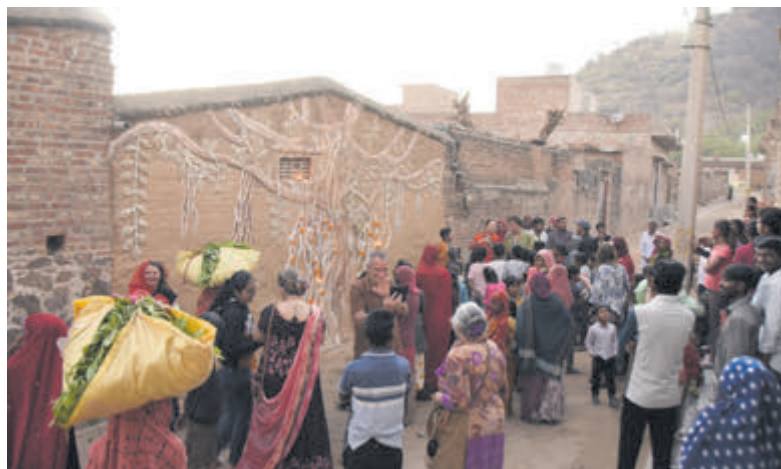
Het dorp loopt uit tijdens het feestelijke openingsritueel.

Omdat aan de wortels van de Banyanbomen in India vaak afbeeldingen van goden en kaarsjes te vinden zijn, verwerkte het duo in de wortels van hun muur kleine gaatjes, nisjes en plateautjes om er bloemen en afbeeldingen in te kunnen plaatsen en kaarsjes te kunnen branden. In het laatste weekend van januari staken de 'elders' uit het dorp de kaarsjes aan en plaatsten ze in de wortels, de generaties na hen gaven hun favoriete goden een plaatsje en tot slot versierden de kinderen de boom met warm oranje afrikaantjes. Zo droegen zij de boomtempel over aan het dorp met een verbindend warm ritueel en keerden vervuld weer huiswaarts.