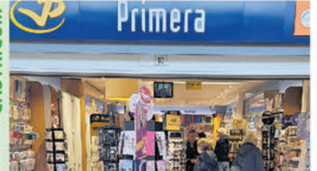
Primera • Geesterduin 10