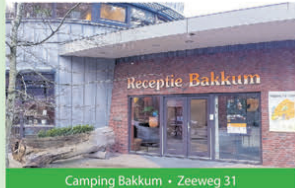
Camping Bakkum • Zeeweg 31 1 april tot eind september