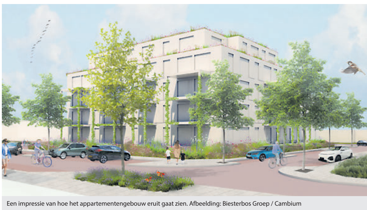
Een impressie van hoe het appartementengebouw eruit gaat zien.

Meer weten over dit project van Recreatieschap Alkmaarder- en Uitgeestermeer? Kijk op www.alkmaarder-enuitgeestermeer.nl/projecten voor informatie.