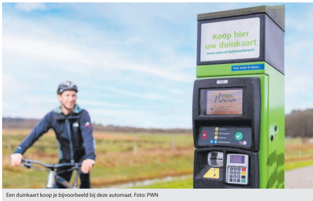
Een duinkaart koop je bijvoorbeeld bij deze automaat.