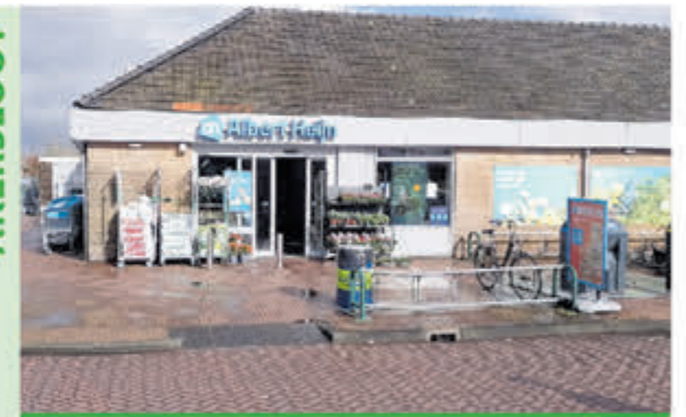
Albert Heijn Akersloot • Raadhuisweg 3