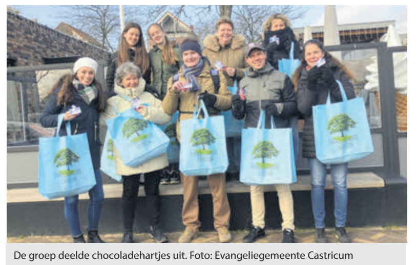
De groep deelde chocoladehartjes uit.

Castricum – Vrijdag (Valentijnsdag) hebben leden van de Evangeliegemeente Castricum (EGC) cadeautjes uitgedeeld aan het winkelend publiek bij winkelcentrum Geesterduin en op de wekelijkse markt. Ze grepen deze dag van de liefde aan om te benadrukken dat iedereen er toe doet. Er werden zakjes met chocoladehartjes uitgedeeld met een kaartje met de tekst 'God houdt van je'. Hiermee wilde de EGC het