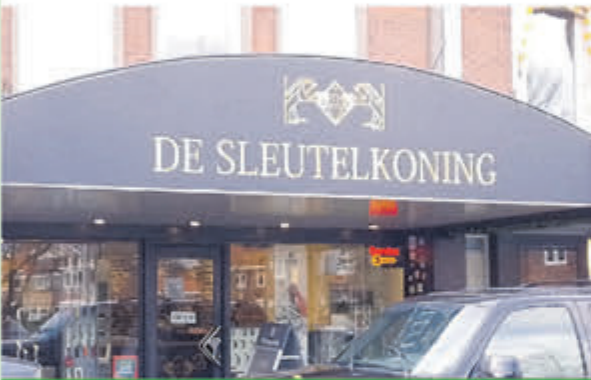
De Sleutelkoning • Torenstraat 38A