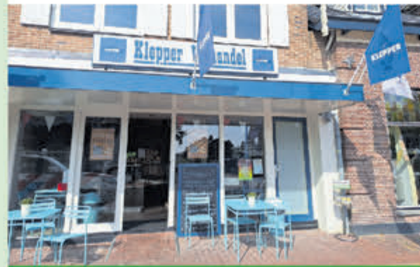
Vishandel Klepper • Dorpsstraat 34