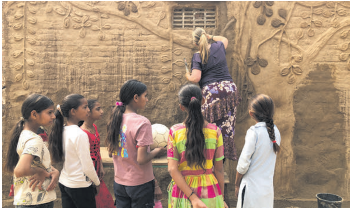
Doorlopende voorstelling bij het maken van het koeienmest reliëf.