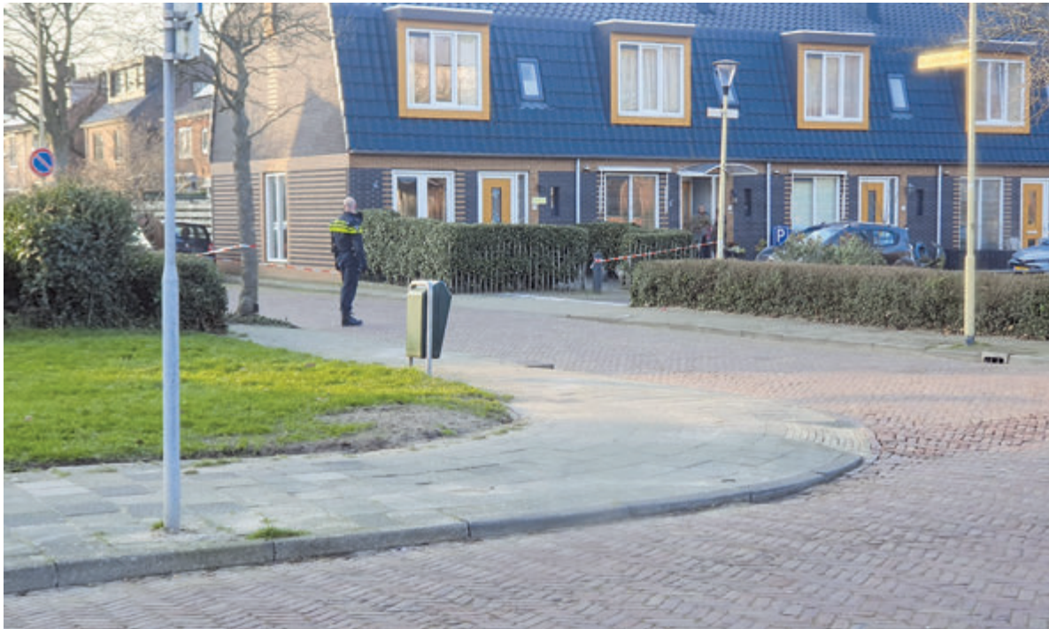
De omgeving was enige tijd afgezet voor sporenonderzoek.