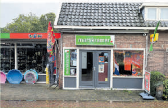
Marskramer-Toys2Play • Julianaweg 40