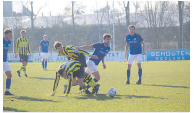
Meervogels '31 buigt voor Westfriezen.

Komend weekeinde is Apeldoorn het strijdtonel voor het Nederlands Kampioenschap Senioren. Sepp komt opnieuw in actie op de 1500 meter. Daarnaast zijn Ryan Clarke (800 meter) en Jesse Scheltema (1500 meter) kanshebbers op een hoge klassering. Ook Juul Schuit verschijnt aan de start van de 800 meter, terwijl Yoni Bas nog in spanning afwacht of ze als reserve mag meedoen op de 400 meter.