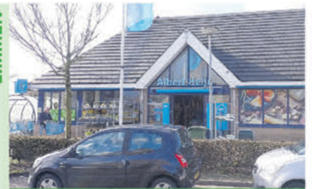
AH Vuurbaak • Vuurbaak 1