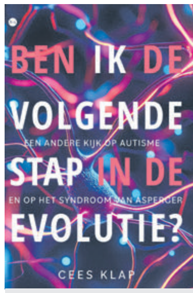
Afbeelding: Uitgeverij Boekscout

Het boek is sinds 7 februari verkrijgbaar. Op 26 februari verzorgt Cees Klap een boekpresentatie. Deze vindt plaats van 19.00 tot 20.30 uur in restaurant De Oude Keuken aan de Oude Parklaan 117 in Bakkum.