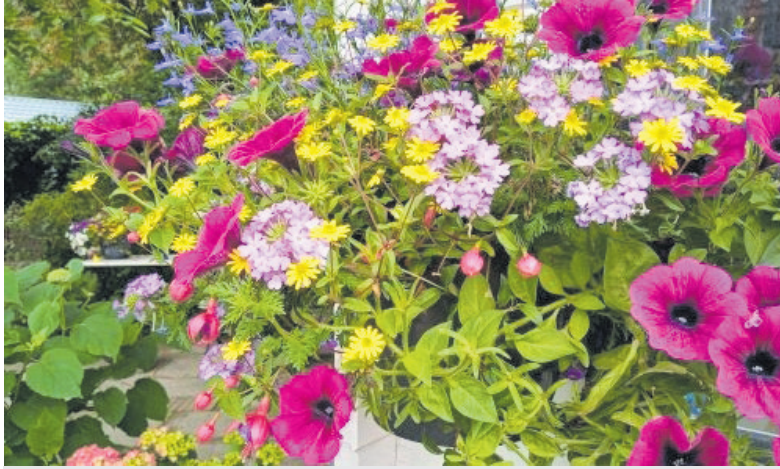
Zo mooi kan het er later dit jaar gaan uitzien.

Castricum – Gospelkoor Connection is op zoek naar een bassist voor het begeleidingscombo. Daarin spelen al een toetsenist, gitarist en drummer. De repetities vinden plaats op zondagavond en naast de optredens zijn er gemiddeld acht à tien repetities per jaar met de band. In maart 2026 bestaat het koor 4veertig jaar en komt er een jubileumconcert met ongeveer twintig nummers. Ook in de kerstperiode zijn er diverse optredens. Wie kent een bassist (het liefst iemand die noten kan lezen) en stuurt hem of haar deze vraag door? Kijk op www.connection-hetkoor.nl of neem contact op via info@connection-hetkoor.nl voor meer informatie.