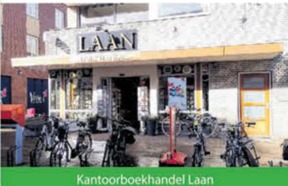
Kantoorboekhandel Laan Burgemeester Mooijstraat 19