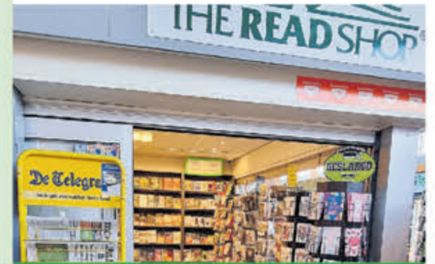
Readshop • Geesterduin 45