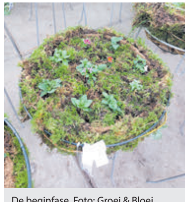
De beginfase.

De workshop wordt gegeven op dinsdag 4 maart om 10.00 uur en 11.30 uur bij Maatwerk Kwekerij Heiloo. Belangstellenden dienen zich vóór 1 maart aan te melden bij Mercedes Docter ( benzdocter@icloud.com ) of kijk op https://middenkennemerland.groei.nl voor de overige details. Op de website is ook informatie over de andere activiteiten van Groei & Bloei te vinden.