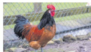
Haan Harry.

dieren altijd onderdak, maar soms kan dat niet. Zoals bij hanen die niet samen kunnen leven omdat ze anders gaan vechten. „We nemen wel eens een konijn aan, maar dan moet er net plek zijn. We willen het aantal konijnen dat hier rondloopt op maximaal zes houden.” Eerder plaatsten de eigenaren al eens borden met de tekst dat het dumpen van dieren niet is toegestaan. Deze werden echter steeds gesloopt of weggehaald. Daarom zijn er een poos terug camera's bij de kinderboerderij geïnstalleerd om dumpingen in de gaten te kunnen houden. Dit lijkt preventief te werken want sinds de laatste 'vondeling', de rode haan Harry werd aangetroffen, is het aantal dumpingen sterk afgenomen. Voor mensen die overwegen om een huisdier aan te schaffen heeft Willa heeft een boodschap: „Huisdieren zijn leuk en je kunt er heel veel plezier aan beleven, maar realiseer je goed dat je zo'n dier voor het leven aanschaft. Dit vraagt verantwoordelijkheid van je. Met het dumpen van een huisdier leg je deze verantwoording bij anderen. Breng het dan naar de dierenbescherming of naar de dierenarts. Zij kunnen je helpen met het zoeken naar een onderkomen.”