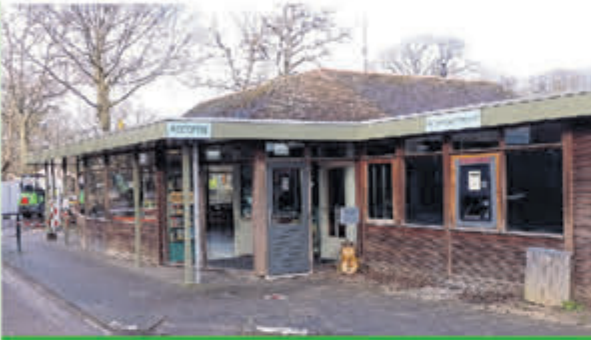
Camping Geversduin • Beverwijkerstraatweg 205 1 april tot eind september