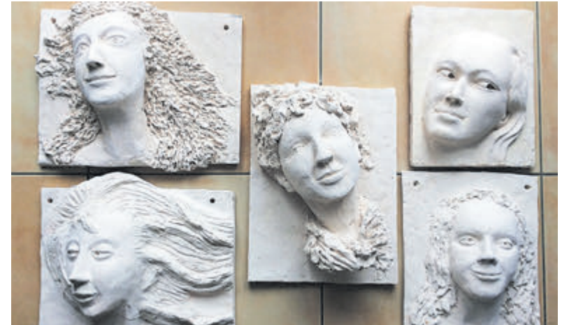
Enkele voorbeelden van geboetserde portretten.

geslaagd beeld te maken. Je kunt erop rekenen dat het hele proces een boeiend avontuur wordt en met elkaar beleef je daar bovendien veel plezier aan. Kleisoorten zijn naar keuze aanwezig, evenals alle hulpmiddelen. De cursusdata zijn de zaterdagdagen 29 maart, 5 en 12 april. De lessen vinden plaats van 09.30 tot 12.30 uur in het pand van Perspectief aan de Van Oldenbarneveldweg 37. Kijk op www.perspectiefcastricum.nl voor meer informatie.