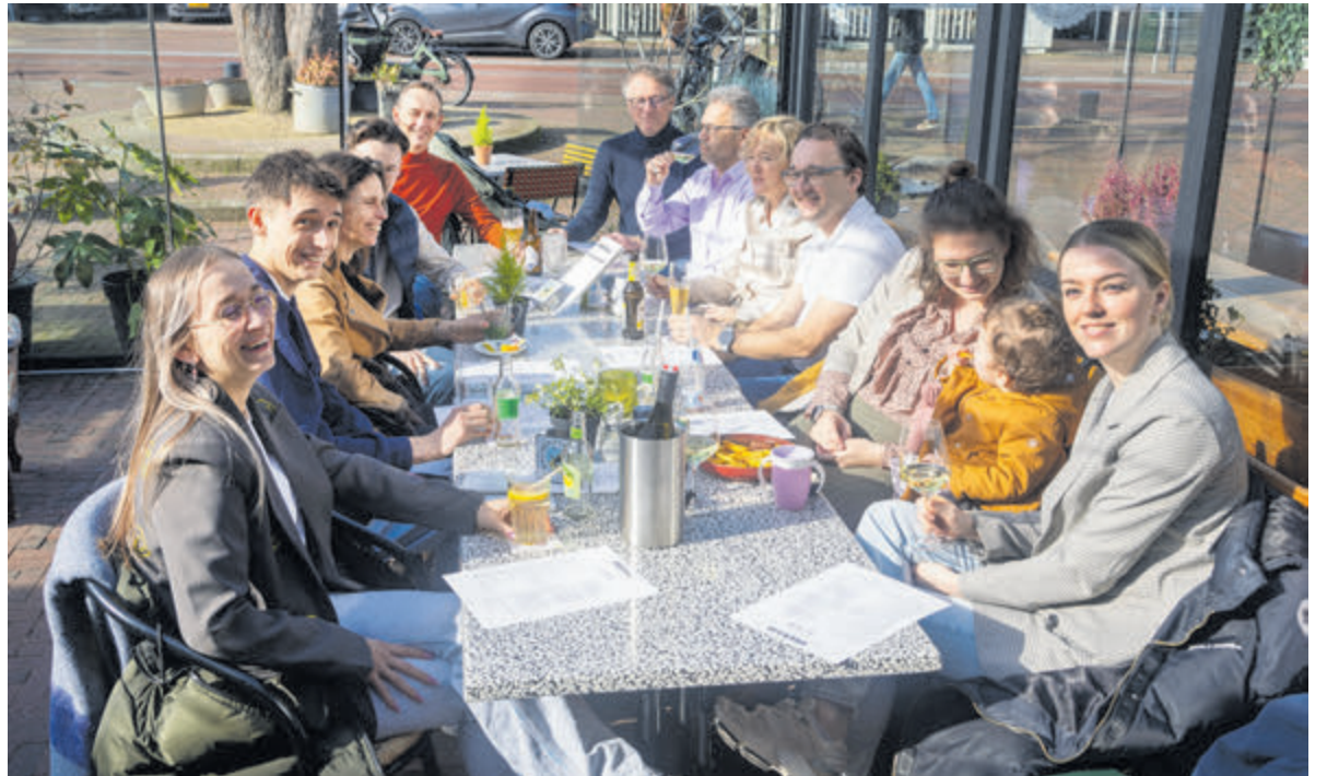
Tekst en foto: Henk de Reus

De inhoud van de rubriek Lezerspost valt buiten de verantwoordelijkheid van de uitgever. De redactie kan een bijdrage weigeren of inkorten. Anonieme bijdragen worden niet in de krant afgedrukt.