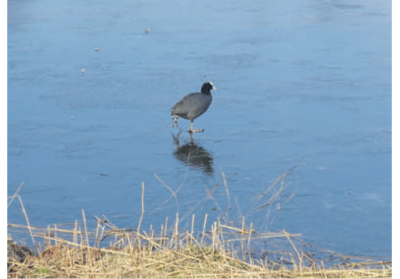
Tekst en foto: Hans Boot

net niet meer het ijs op konden, omdat het te dun was. Dat gold niet voor deze meerkoet in een vijver in het park Hendriksveld. Het kan zijn dat hij als watervogel even de weg kwijt was of misschien wilde hij een dagje ijsvogel zijn?