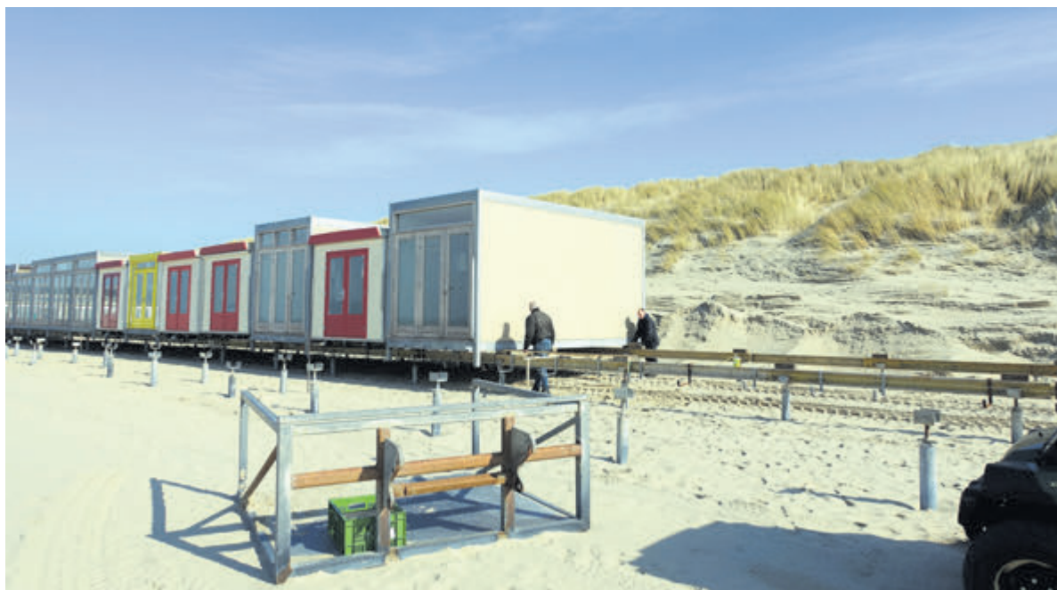
Er komen steeds meer strandhuisjes bij.