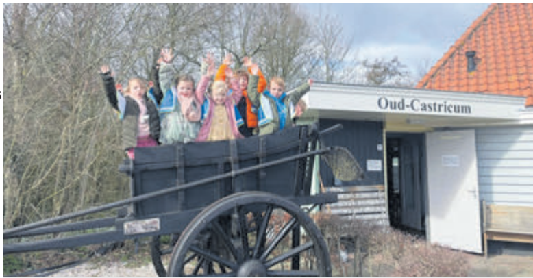
De kleuters van kindcentrum Visser 't Hooft te gast bij Oud-castricum.

Castricum – De kleuters uit de groepen 1 en 2 van kindcentrum Visser 't Hooft hebben een bijzondere reis door de tijd gemaakt tijdens hun bezoek aan Stichting Oud-Castricum. In het kader van het schoolthema 'De tijd van opa en oma' dompelden de jonge leerlingen zich onder in het leven van vroeger.