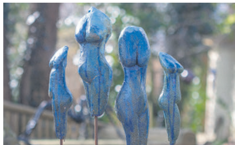
Een onderdeel van het kunstwerk Ladylike.

Bakkum – De kunstenaars van Atelier Bakkum aan de Van Oldenbarneveldweg 32 hebben een nieuwe expositie ingericht, ditmaal met het thema Sinfonia. Ze verbeelden het zintuiglijke pallet van zicht, geur, gehoor, smaak en aanraking in al haar diversiteit. Marina Pronk toont onder andere haar serie 'Ladylike' die maar liefst 46 beelden telt. „Het is mijn persoonlijke ode aan de vrouw in al haar verschijningsvormen. De 3-dimensionale schetsen van klei zijn in de keramiekoven gebakken, overgoten met diverse blauwe, turquoise en groene glazuren en