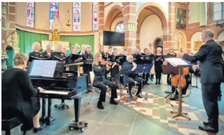
Het jubileumconcert van De Vredenburgers.