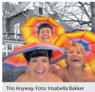
Trio Anyway.

dames zingen al 25 jaar samen liedjes met een lach, een traan en een korreltje zelfspot. De eerste start op zondag 9 maart om 15.30 en de tweede om 16.30 uur. In de pauze kan als altijd met een drankje en een hapje in de hand genoten worden van de kunstwerken ledereen is welkom, de toegang is gratis en een vrijwillige bijdrage voor de muzikanten wordt zeer gewaardeerd.