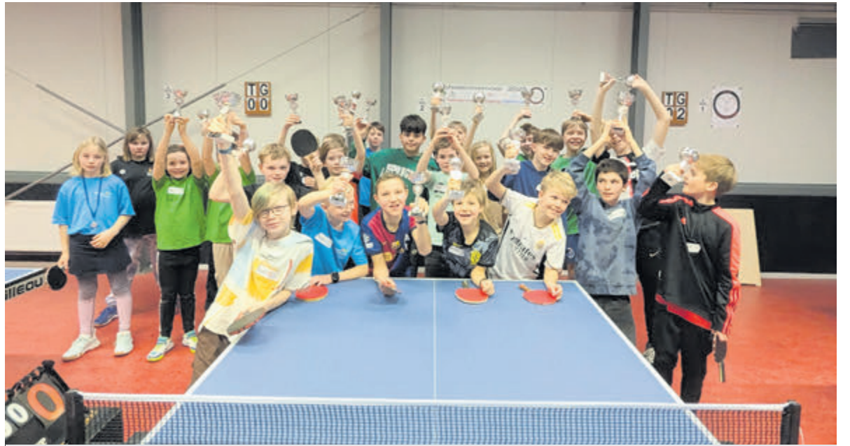
De kinderen die deelnamen aan het scholentoernooi.

Joris Peijs tot de achterlijn. De pass volgde waarna Lodewijks hard en zuiver mocht inschieten. Tijd voor de snelle counter met Lodewijks en invaller Joep Kornblom in de hoofdrol, die bestond uit een dieptepass met vervolgens een panklare bal voor het doel die niet te missen was voor Kornbloem. Max nam nog even de vierde voor zijn rekening, waarna spelers en toeschouwers tevreden naar huis gingen.