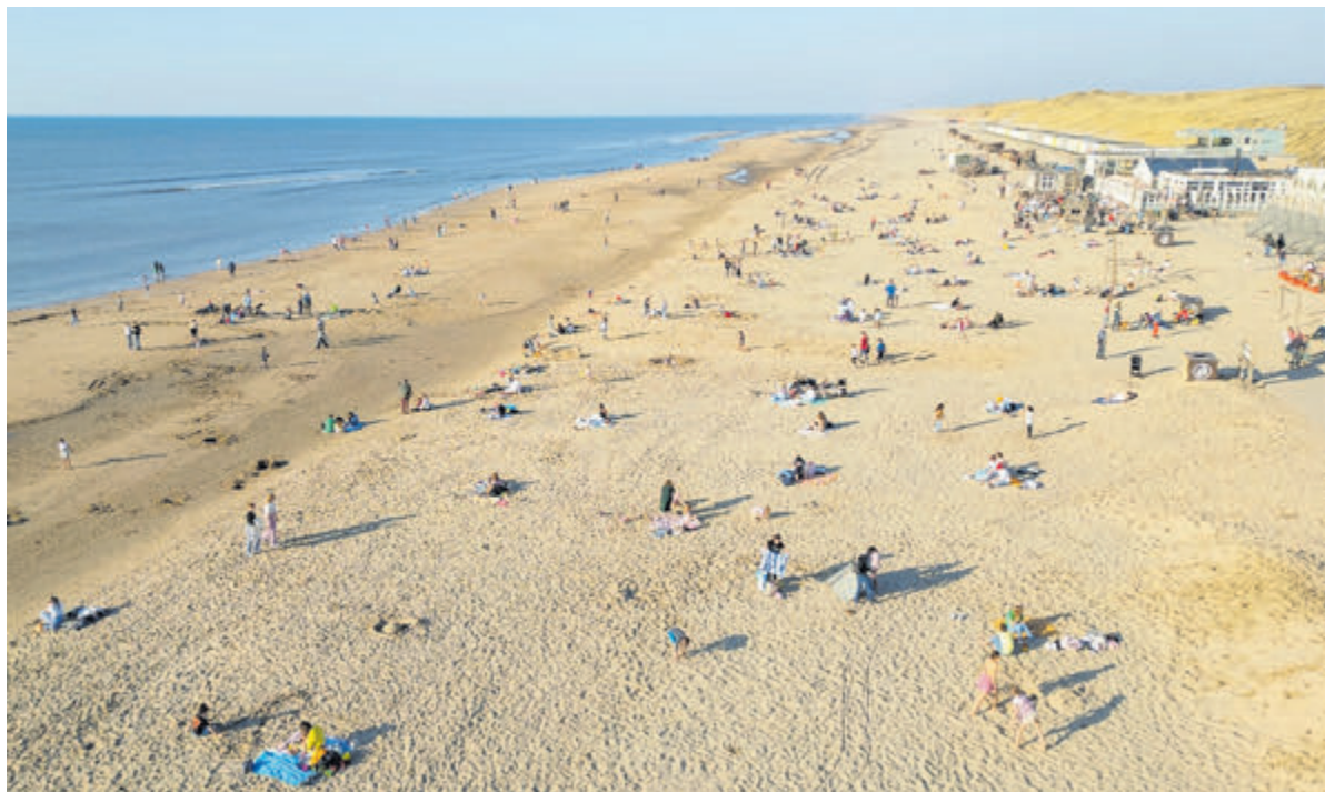
Tekst en foto: Henk de Reus