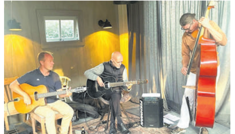
De groep Terra Gypsy