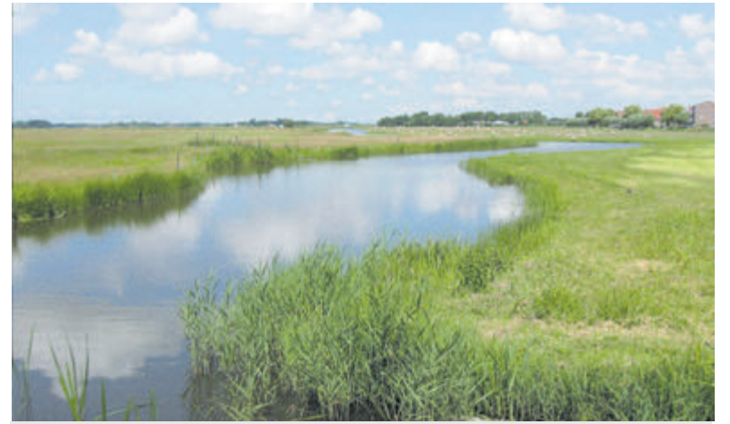
Het Oer-IJ-landschap rond Akersloot.

lopende acties." Eén van die scherpe acties is een prachtige PowerPlus Hogedrukreiniger met een vermogen van 1800 watt, 8 meter hogedruk-slang, slanghaspel en terrasreiniger. Met 33% korting van 149 voor precies 99 Euro. Een goede investering, ideaal voor het jarenlang reinigen van terrassen, hekken, tuinmeubelen en uw auto. „Voor wie zaterdag onze winkel bezoekt; wij trakteren op een heerlijk schepijsje van de Roset!"