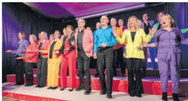
Bonte kleuren en sfeervol gezongen liedjes.

Na de pauze werd 'Circle of life' gezongen uit de jaren negentig. Bij deze grote hit van Elton John, afkomstig uit de film The Lion King, werd mooi fotografische beeld getoond en kwamen 'giraffen' en