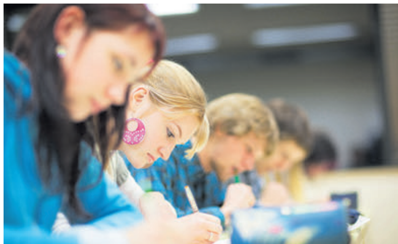
Onderwijsraad waarschuwt: minder studenten, minder opleidingen?