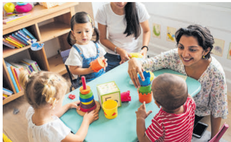
Lange wachtlijsten: Noord-Holland koploper in tekort aan medewerkers kinderopvang