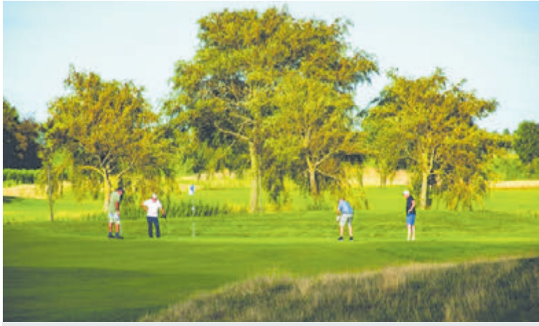
Golf- &amp; Countryclub Heiloo.