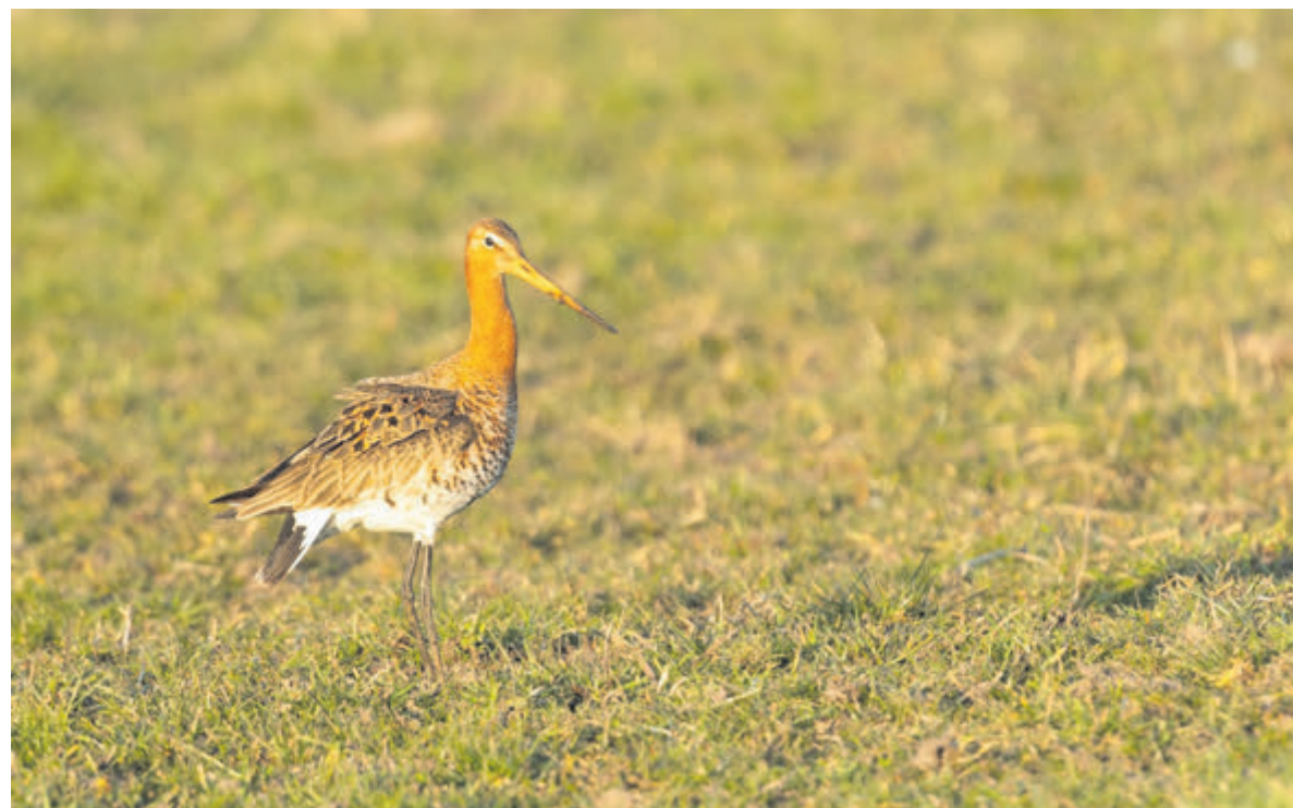
Tekst en foto: Henk de Reus

Let op: aanmelden kan tot 16 maart. Op 18 maart 2026 vinden de nieuwe gemeenteraadsverkiezingen plaats.