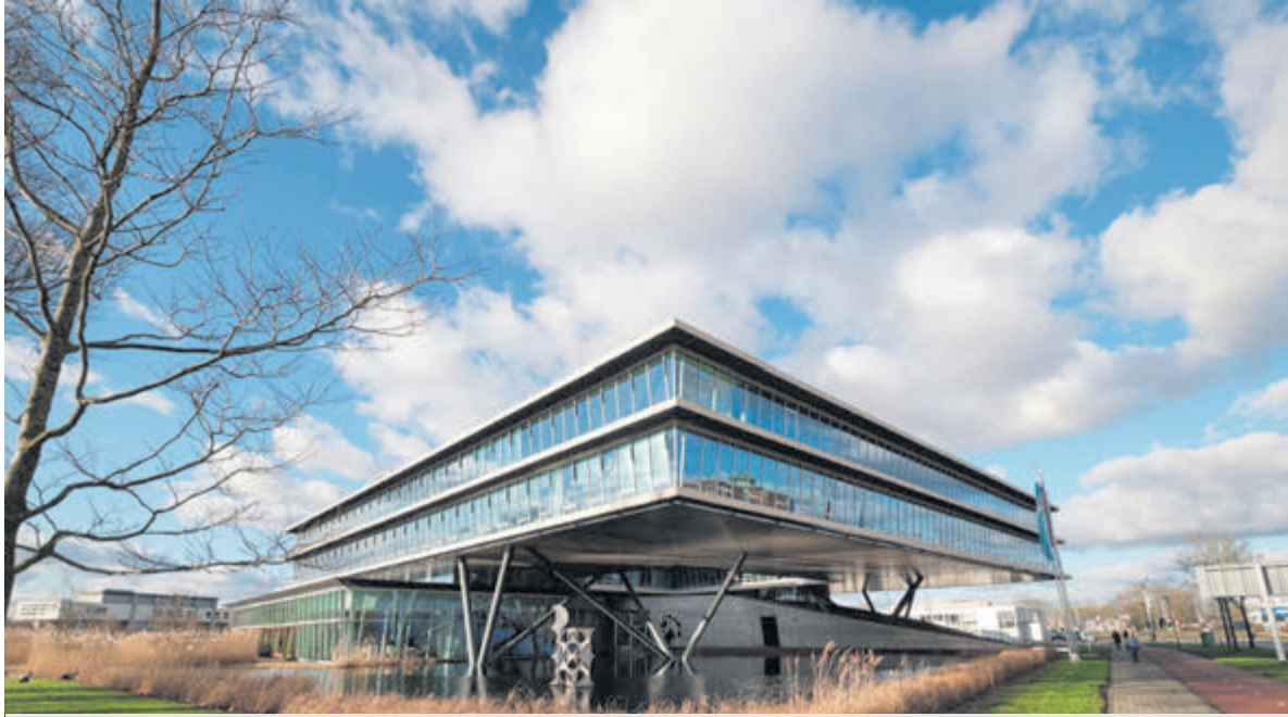
Kantoorgebouw HHNK

Regio – Met de beleidsregel Wet bevordering integriteitsbeoordelingen door het openbaar bestuur (Bibob) zet Hoogheemraadschap Hollands Noorderkwartier (HHNK) een belangrijke stap naar een sterkere en veiligere organisatie. Dit betekent dat HHNK voortaan integriteitsonderzoeken kan uitvoeren om te bepalen of er risico's bestaan op misbruik door criminele organisaties. Het hoogheemraadschap is daarmee een van de eerste waterschappen die dit instrument actief inzet.