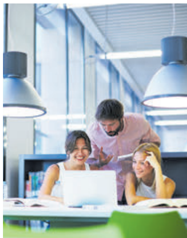
Tips om interessante vacatures te vinden