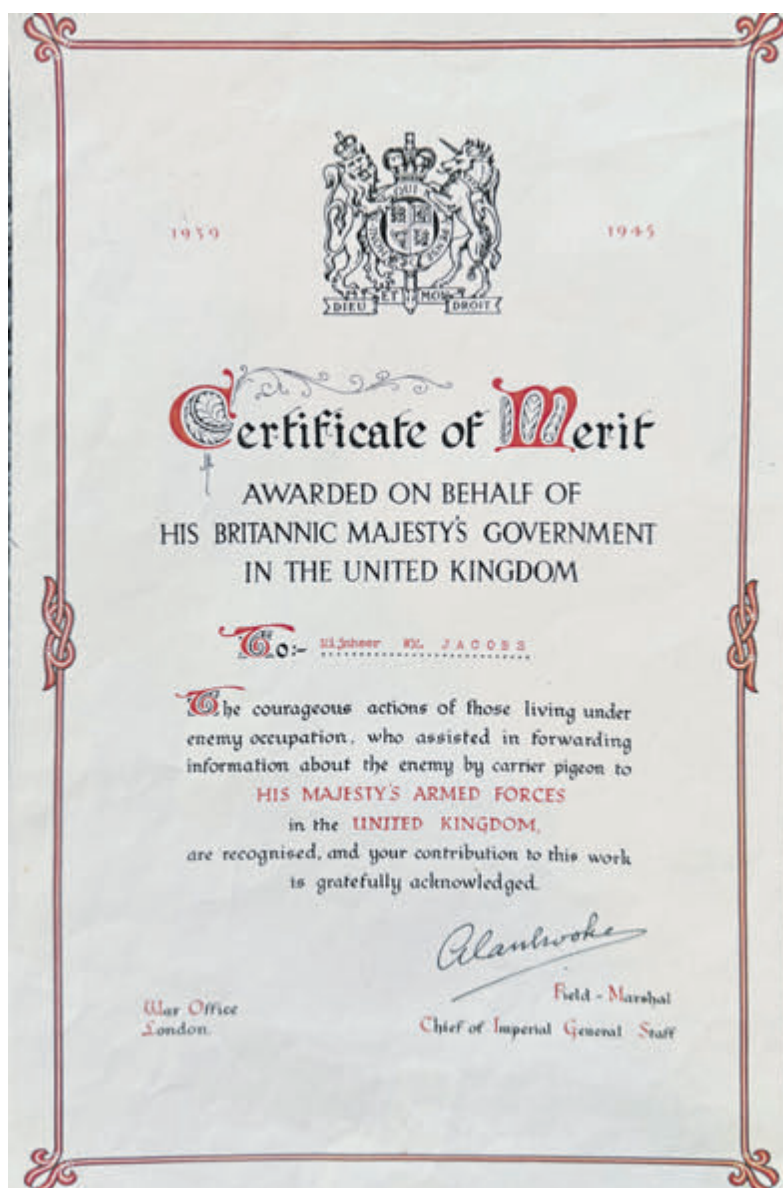
Het certificaat van verdienste uitgereikt aan de vader van Paula.

Als we het interview afronden vraagt Paula of ze het concept van het artikel vooraf te zien krijgt, want ze wil wel graag weten of het allemaal klopt wat er is opgeschreven. Niet direct een vraag die je van iemand van bijna 98 jaar verwacht. Ze houdt de regie graag in eigen hand. Nadat ze haar e-mailadres heeft gegeven volgt het afscheid van een bijzonder sympathieke en bescheiden vrouw die destijds niet heeft kunnen bevroeden welke dienst zij met het verzamelen van de gegevens van de oorlogsslachtoffers de gemeenschap later zou bewijzen.