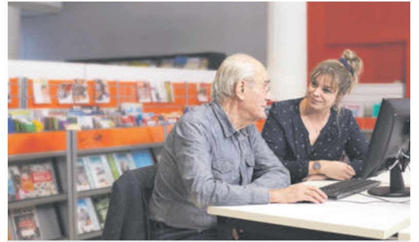
Je doet altijd zelf aangifte.