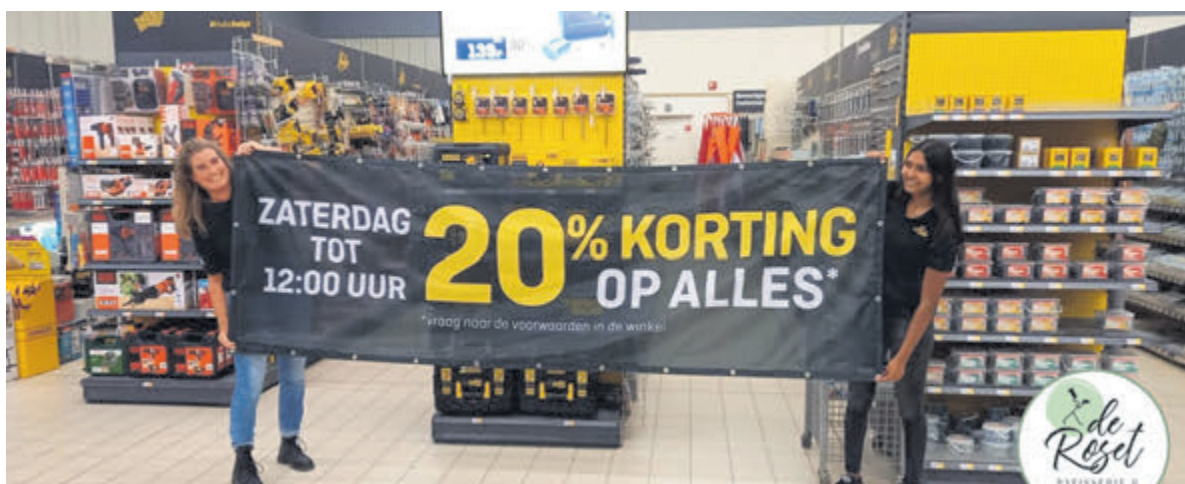
Het Hubo-Promo-Team: Esther en Ranjana poseren met de banner voor de actie van aanstaande zaterdag.

Zin in wat extra avontuur? Je kunt ook een buitenlands kind uitnodigen! In Noord-Holland is men nog op zoek naar plekjes voor kinderen uit Duitsland en Frankrijk. De kinderen komen voor ongeveer twee weken. Ze zijn in de leeftijd van 5 tot 12 jaar. Kijk op www.europakinderhulp.nl/vakantieouders voor meer informatie en om aan te melden.