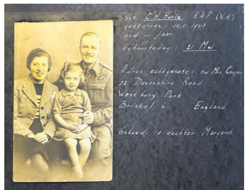
Pagina uit het boekje van Paula.