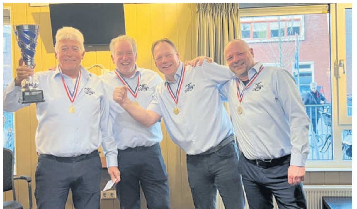
Het team van BVC met de kampioensbeker.

voor gaf op de inkomende Jacco de Jong. Deze liet Cas kansloos: 1-0. Na rust kwam Meervogels op gelijke hoogte. De grensrechter van Limmen had buitenspel geconstateerd, maar scheidsrechter Peetoom zag het anders en keurde de treffer goed. Thomas van der Wijk werd gewisseld voor Joeri Admiraal laatstgenoemde zette de stand op 2-1. Limmen had de score verder kunnen opvoeren, maar doelman Hoogland speelde een prima wedstrijd.