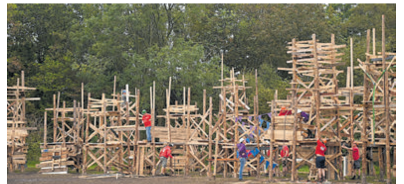
Het timmerdorp brengt jaarlijks veel plezier voor maximaal tweehonderd kinderen.