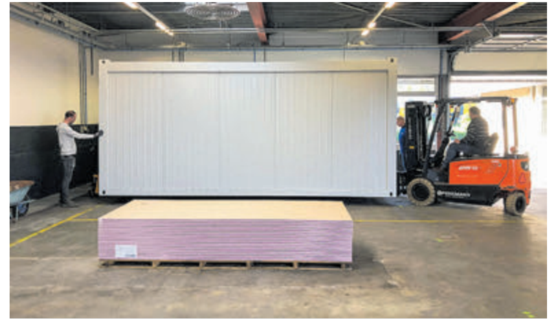
In de showroom is het passen en meten om de 21 mobiele units een plaats te geven.

het pand kreeg de gemeente groen licht en kon het plaatsten beginnen. Het gaat om tijdelijke huisvesting. Uiteindelijk heeft de eigenaar van de showroom plannen om op de huidige plek een Dekasupermarkt te vestigen. Omdat dit nog lang op zich kan laten wachten ging hij akkoord met plaatsing van de mobiele units.