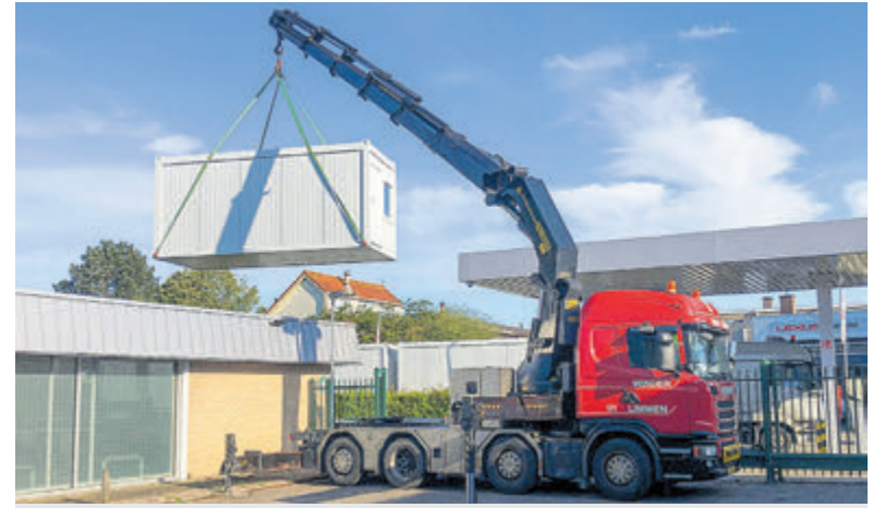
De eerste mobiele unit wordt met een kraan op het terrein vóór de voormalige showroom geplaatst.

Limmen - Blijdschap bij Limmen JO19-1. Het team is afgelopen zaterdag kampioen geworden in de hoofdklasse. De thuiswedstrijd tegen JO19-1 van SV Enkhuizen werd met 2-1 gewonnen. Proficiat!