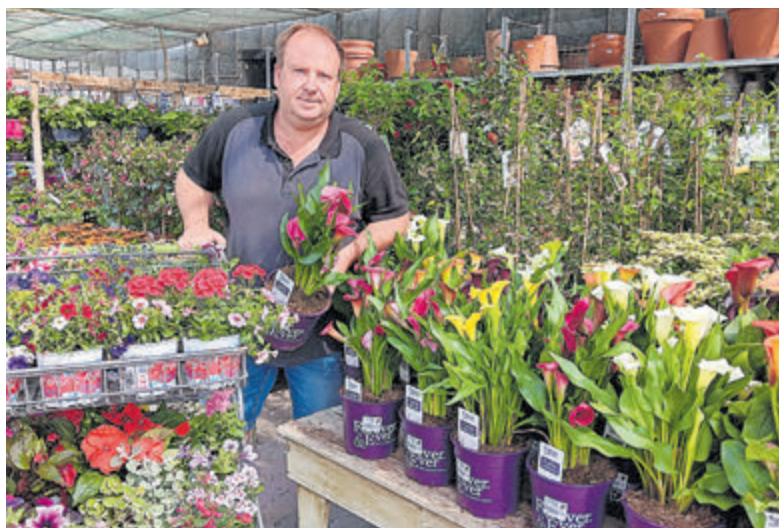
Alles voor een kleurrijke of groene tuin.

Akersloot - Bij Tuincentrum Frits Janssen zijn ze er helemaal klaar voor; een kleurrijke en groene tuin in de zomer! Van vaste planten en wandhangers tot fruitbomen en heel veel pergoed. Ontdek eindeloos veel planten en bloemen voor buiten in je tuin of op je balkon. Met de Dorregeester Molen op de achtergrond geniet je van alle bloemenpracht om je heen. In de nieuwe collectie potterie zul je zeker een geschikte en bijpassende bloempot vinden, of je kiest voor een tijdloze en klassieke terracotta bloempot. Daarnaast kun je er terecht voor leuke tuin- en woonaccessoires, zoals windlichten, insectenhuisjes, wanddecoratie en nog veel meer...! Kom langs en proef de zomersfeer bij Tuincentrum Frits Janssen! Tweede pinksterdag geopend van 11.00 tot