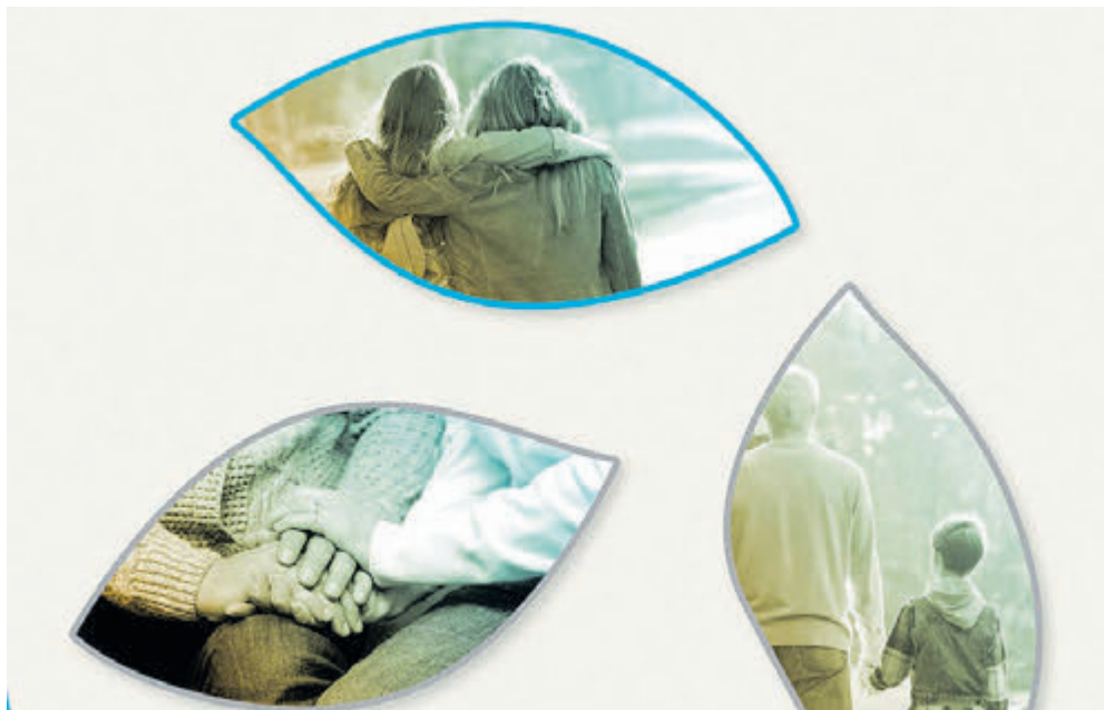
Afbeelding: Ester Al Uitvaartzorg