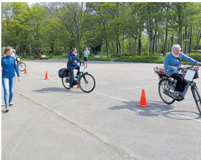
De gratis fietslessen zijn opgezet om het fietsverkeer veiliger te maken

Akersloot - Vorige week maandagochtend vroeg legde de politie een 25-jarige inwoner van Akersloot een rijverbod op voor de duur van vijf uur. De man was op de Geesterweg betrapt op het besturen van zijn auto terwijl hij vermoedelijk onder invloed van drugs verkeerde. Een speekseltest wees daarop, van de man werd bloed afgelopen om daarover meer duidelijkheid te krijgen.