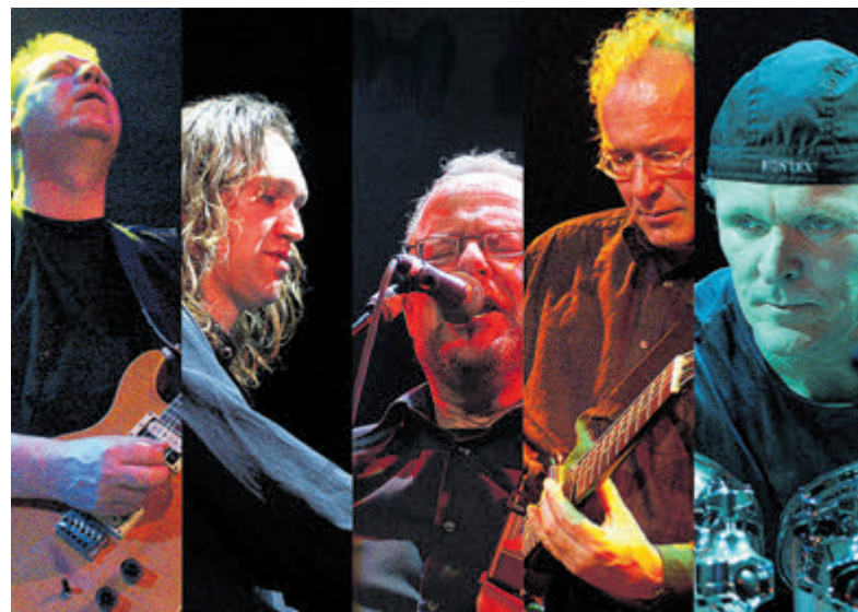
Bluesband John the Revelator.

de andere mogelijkheden die Perspectief te bieden heeft, wordt een kleine selectie getoond van ruimtelijk werk (hout, keramiek, beelden), grafische technieken en modelteken-/schilderwerk. U kunt de route starten op twee instaplocaties: Hoogegeest 43a en Klein Dorregeest 3b. De routebeschrijving is op deze locaties beschikbaar.