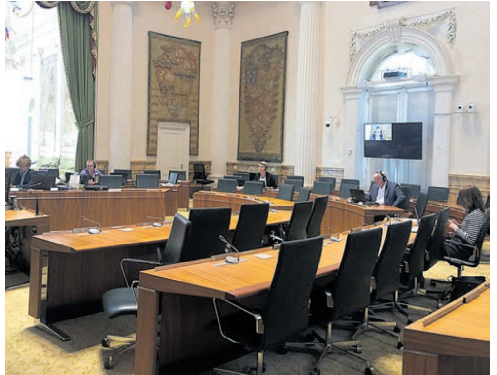
Een Statenzaal zonder Statenleden tijdens de online vergadering.

Het programma wordt onder regie van Zorg Optimalisatie Noord-Holland (ZONH), Stichting Zorgring, IGO Geboortehart, Imond Geboortezorg, de verloskundige samenwerkingsverbanden in Noord-Kennemerland, West-Friesland, Waterland en de Kop van Noord-Holland en de jeugdgezondheidszorg in Noord-Holland Noord de komende drie jaar in de regio geïmplementeerd.