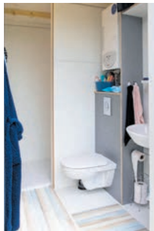
Een kijkje in de cabine met achterin de doucheruimte en voorin het hangtoilet, de geiser en de wasbak.