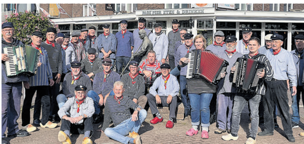
Shantykoor De Skulpers.

Ga naar: www.castricummer.nl/aanmelden-nieuwsbrief en meld je aan