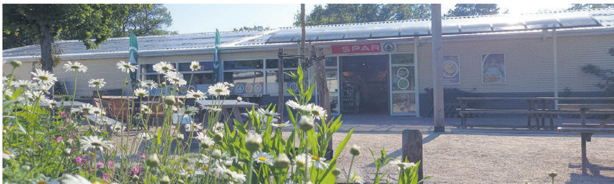
De Spar op Camping Bakkum.

steeds tot het team, dat verder één vaste medewerker in loondienst telt. Er is behoefte aan versterking, men is op zoek naar een enthousiaste en representatieve collega die van aanpakken weet en er geen moeite mee heeft om te werken als anderen vakantie vieren. Interesse? Bel 0251 658047 voor meer informatie.