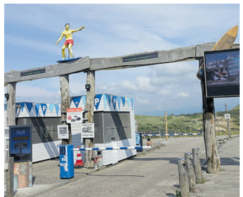
De terminal bij Castricum aan Zee.

Een aantal sessies later konden we een mooi resultaat zien. Zijn tandvlees bloedde niet meer bij aanraken en werd weer mooi roze en strak. Een gezonde mond die we samen hebben bereikt. Maar de kers op de taart waren de woorden: 'Ik durf weer te lachen'. Daar doe ik het voor.