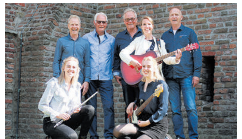
The Bent speelt zondag om 13.00 uur.

voorleessessie. Kijk op www.fennandaeleveld.nl voor meer informatie.