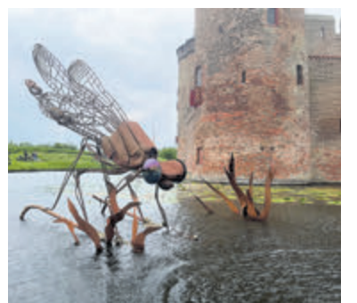
Het kunstwerk WATERJUFFER in de gracht van het Muider slot.

Nijenhuis. De KlimaatExpo is een innovatieve tentoonstelling die je op inspirerende en educatieve wijze aanmoedigt om na te denken over jouw rol in het behoud van onze planeet en bij te dragen aan een duurzame toekomst. Via een aparte audiotour en een podcastserie kun je de kasteelcollectie door een groene bril bekijken. Kijk op www.muider slot.nl voor meer informatie.