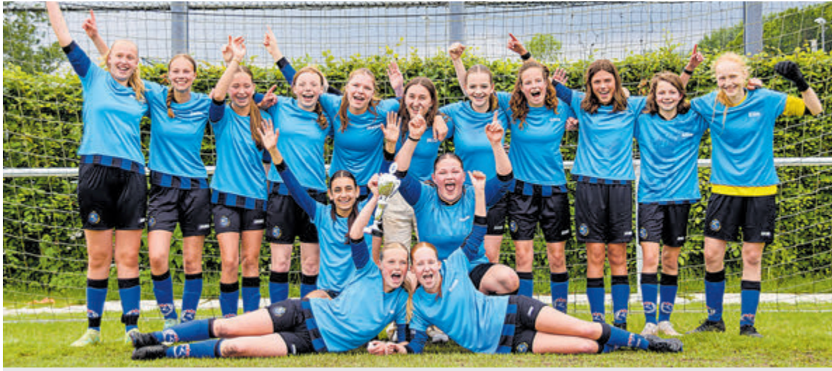
Team MO15-1 pakt derde titel op rij.