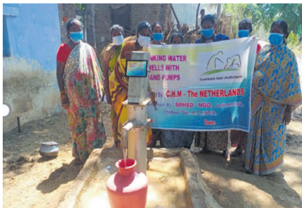
Project van The Society for Rural Health & Development in India.