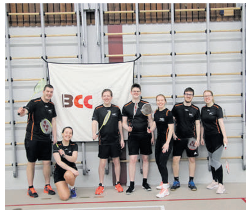
Ervaren spelers van BCC leggen je de regels uit.

De 1-2 voor Limmen viel in de 70e minuut door Tijn Welgraven. Tegen tien man moest dat genoeg zijn, zou je zeggen. Veel kansen om op een grotere voorsprong te komen werden om zeep geholpen. Limmen had wat pap in de benen van het stratentoernooi, zo leek het. In de laatste minuut kreeg De Meteor nog een vrij trap op de middellijn. De harde voorzet van hun keeper werd door Joeri met het hoofd aangeraakt en verschalkte de roepende keeper Glorie: 2-2. Limmen heeft een periode, maar nog onbekend wie de tegenstander is.