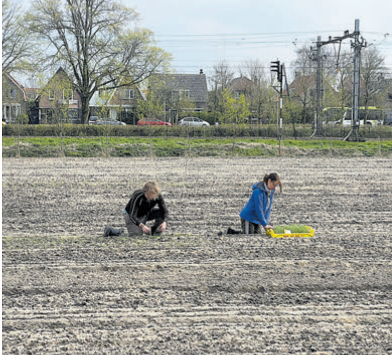
In het voorjaar is een begin gemaakt met het werken aan de biologische tuin De Zanderij.