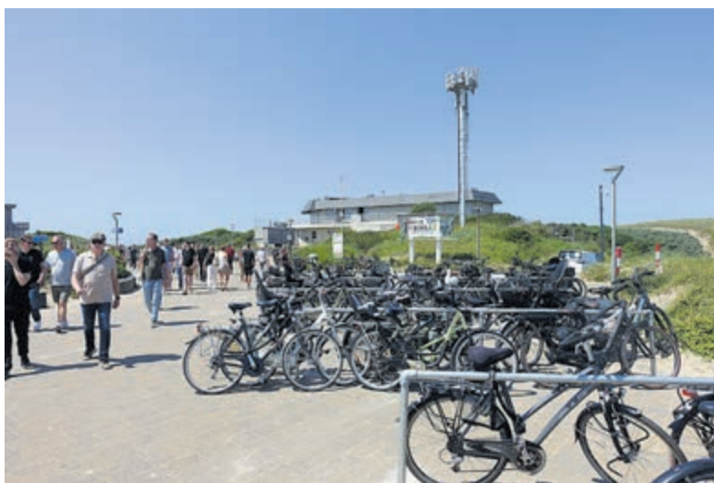
Eén van de geïmproviseerde fietsenstallingen op het strandplateau.

Castricum - Omdat de gemeente vindt dat de situatie rond het stallen van fietsen aan het eind van de Zeeweg onhoudbaar is geworden, heeft zij een tijdelijke stalling aangelegd op het strandplateau ter hoogte van de slagboom en naast het vroegere pand Blinckers van Cambium. Dit bedrijf heeft bezwaren tegen deze noodoplossing.