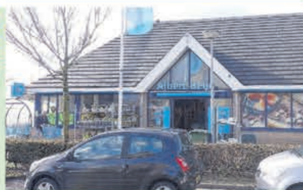
AH Vuurbaak • Vuurbaak 1