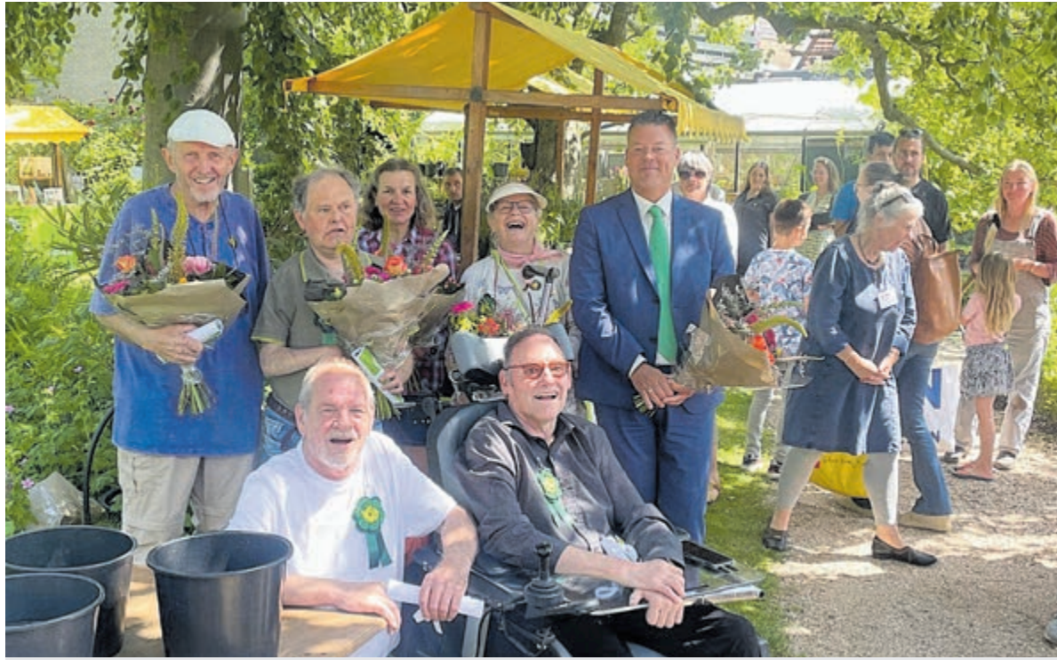
De pioniers zijn in het zonnetje gezet.

Castricum - Begin jaren 90 van de vorige eeuw werd met steun van het Rijk en de gemeente de oude tuin van Kapitein Rommel aan de Stationsweg heringericht en bestemd als ontmoetingsruimte voor de Stichting Welzijn. Naderhand hebben er vooral dankzij een groot aantal vrijwilligers diverse activiteiten plaatsgevonden. Afgelopen zaterdag werd het dertigjarig bestaan feestelijk gevierd.