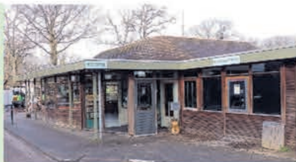
Camping Geversduin • Beverwijkerstraatweg 205 1 april tot eind september