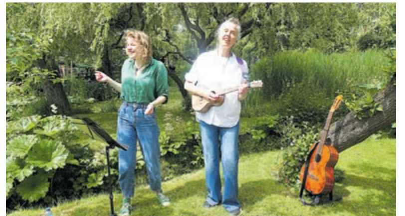
Het geïmproviseerde 'Duo Lipa'.

Het alom bekende Castricumse shanty- en folksongkoor De Skulpers kreeg tot slot de handen weer op elkaar voor vele zeemansliederen die zoals gebruikelijk vaak uit volle borst werden meegezongen.