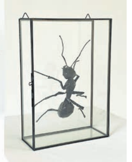
Links twee vissen, rechts een mier; enkele kunstwerken uit de expositie 'Sticky Creatures'.