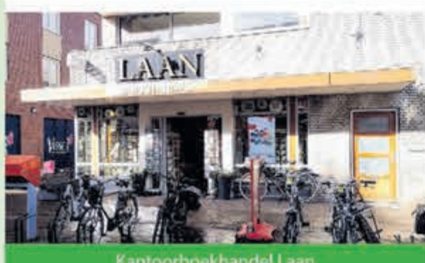
Kantoorboekhandel Laan Burgemeester Mooijstraat 19