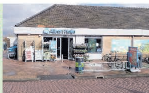
Albert Heijn Akersloot • Raadhuisweg 3