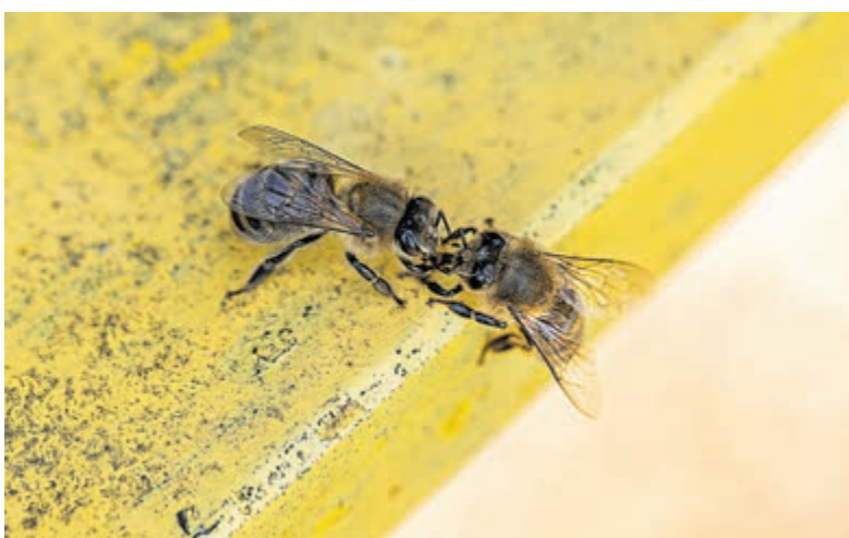
De haalbij spuugt de nectar uit in het mondje van de huisbij.