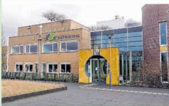
Gemeente Castricum • Raadhuisplein 1