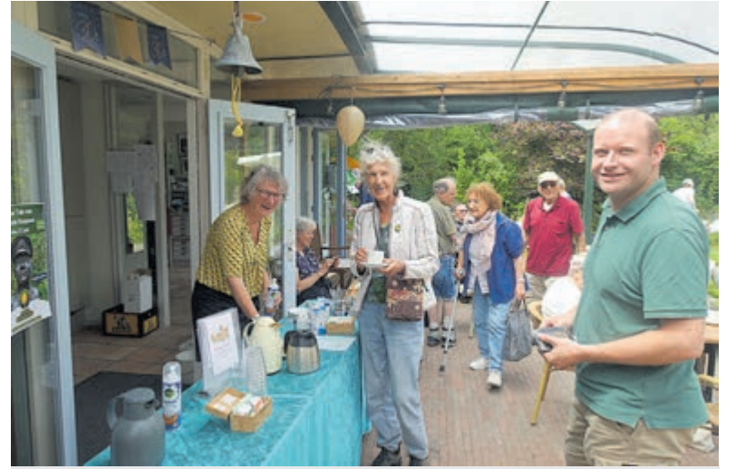
Op het terras werd het nodige genuttigd.