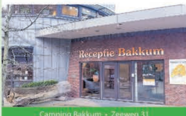
Camping Bakkum • Zeeweg 31 1 april tot eind september