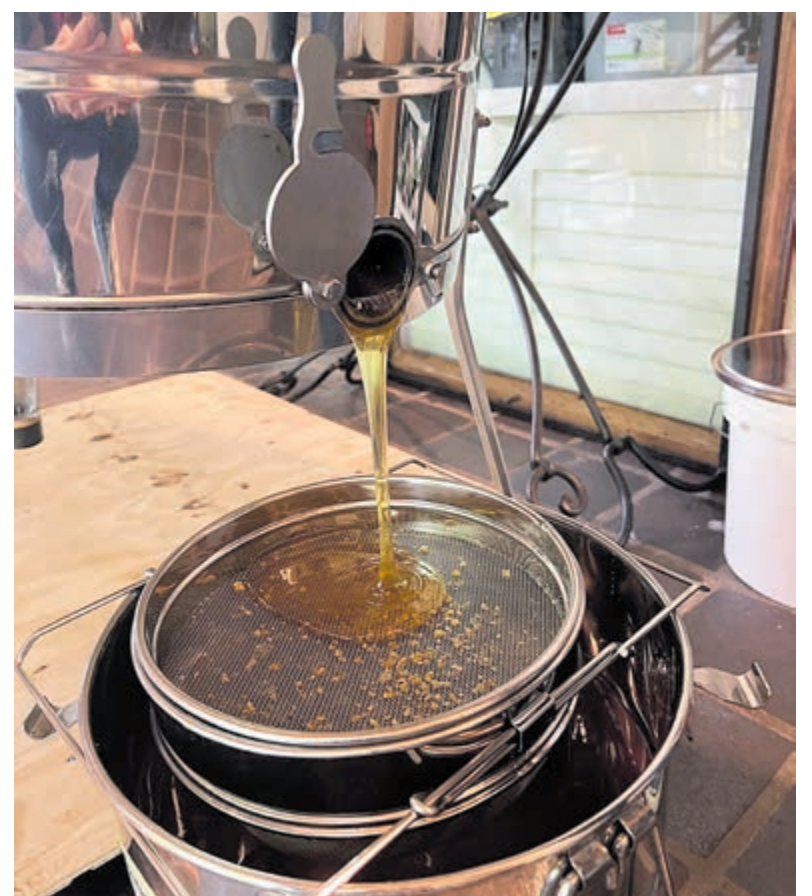
De honing belandt via het kraantje van de honingslinger en twee zeven in de emmer.