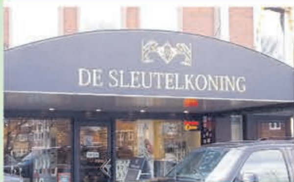
De Sleutelkoning • Torenstraat 38A