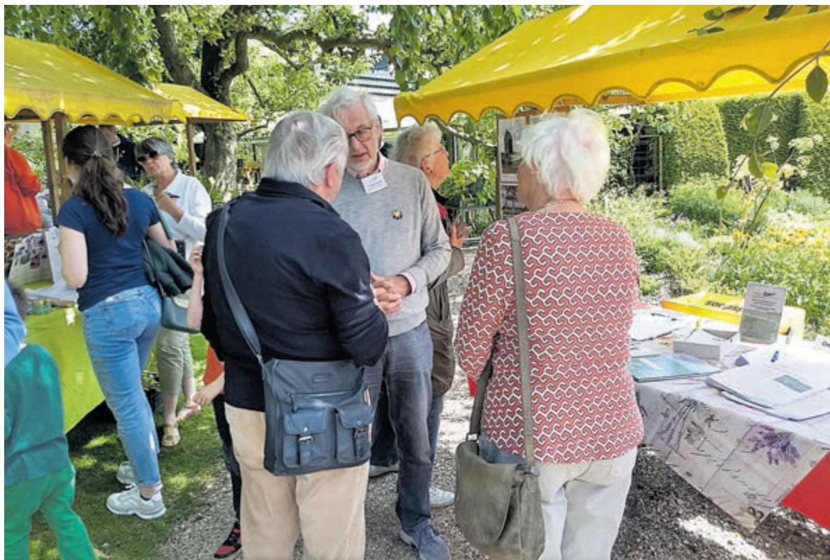
Het was gezellig druk langs de kramen.

art' en de schilderijen van Van Gogh, die in het Rijksmuseum te zien zijn. Deze interessante rondleiding gaf ze op zaterdag vlak voor de prijsuitreiking. De studiebeurs zou Aimée goed van pas komen, aangezien ze grootse plannen heeft voor een vervolgstudie aan de kunstacademie in Sydney. Ze kwam dicht bij de winst, maar Mees Blom van de Berger Schoengemeenschap werd winnaar met het onderwerp 'de ballroom-scene, een revolutie onder spotlights'.