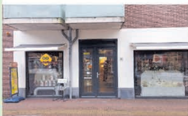
Vivant Rozing • Bakkerspleintje 1-C