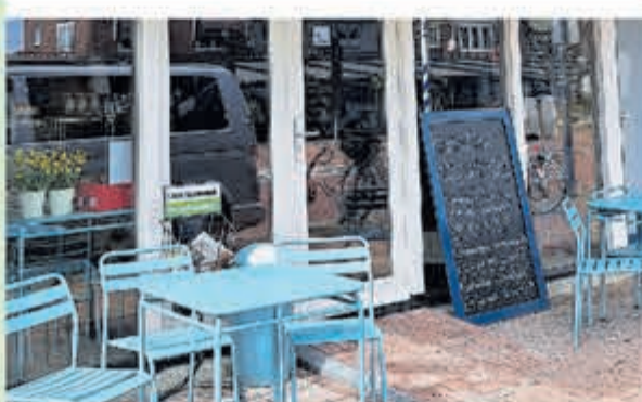
Vishandel Klepper • Dorpsstraat 34