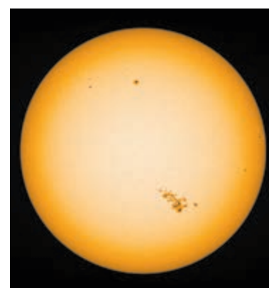
Een foto van de zon op 9 mei van dit jaar. De grote groep zonnevlekken rechtsonder is wat het Noorderlicht op 10 mei veroorzaakte.

Tenslotte heeft Nicolàs een belangrijk advies: „Om de zon te kunnen zien is het belangrijk dat de juiste voorzetfilters worden gebruikt, anders kunnen de ogen blijvende schade oplopen. Kijk dus nooit zomaar door een telescoop naar de zon want je kunt dit maar twee keer doen.”