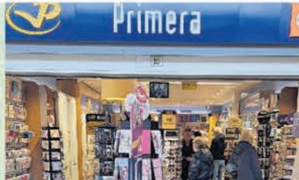
Prima • Geesterduin 10