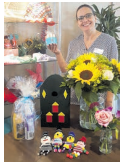
Van lekkernijen tot handgemaakte cadeauartikelen.

Castricum - Op zaterdag 6 juli houdt woonzorgcentrum De Boogaert (Boogaert 37) van 10.30 tot 14.30 uur een creatieve markt voor inwoners van Castricum en omgeving. Een greep uit het aanbod: 3D-kaarten, accessoires en kleding van Twice women's wear, Home & Living decoratie en huisgemaakte jams en taart. Er is een grote rommelkraam en een creatieve workshop! Voor de inwendige mens kun je terecht in het restaurant. De loterij biedt prachtige prijzen, waarvan veel gedoneerd door winkels uit Castricum. De opbrengst van deze creatieve markt komt geheel ten goede aan activiteiten voor de bewoners, zoals optredens en uitstapjes.