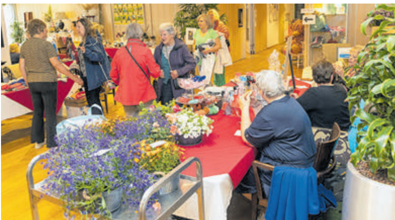
De Creamarkt biedt een gezellige aanblik.

Castricum - Zaterdag vond de jaarlijkse Creamarkt plaats in De Boogaert. Deze bestond uit een workshop, een rommelmarkt, kramen waar van alles te koop was en een kledingoutlet. De opbrengst is bestemd om de bewoners een gezellige avond of een leuk uitje te bezorgen. Ook dit jaar was er weer veel belangstelling.