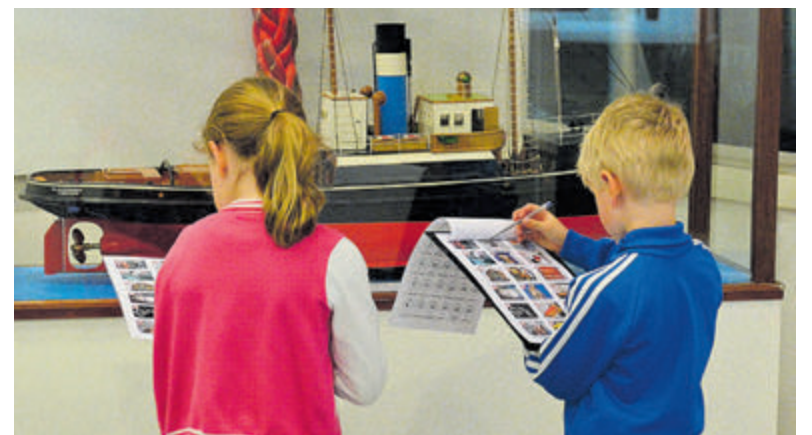
Wat voor weer het ook is, in het Zee- en Havenmuseum is altijd wat te beleven.

Lijkt het je leuk om als vereniging/club volgend jaar ook mee te doen aan de KidsVakantieCocktail en daardoor meer kinderen enthousiast te maken voor je organisatie? Neem dan contact op via: kvc.castricum@gmail.com .