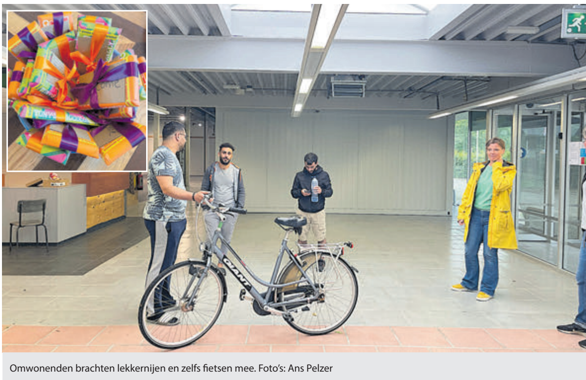
Omwonenden brachten lekkernijen en zelfs fietsen mee.