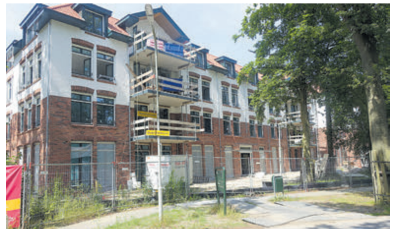
Plan Duynpark aan de Oude Parklaan.