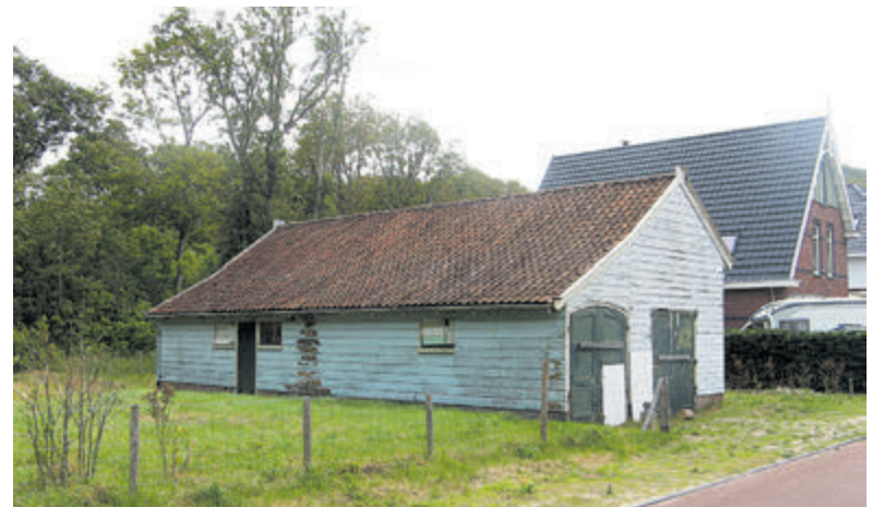
De voormalige tramremise aan Goudsbergen.