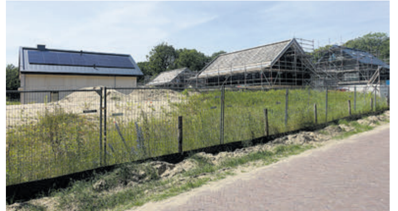
Maelsdal aan de Duinenboschweg.

Tot slot resteert de realisatie van een vrijstaande woning op het perceel Goudsbergen 2, waar in lang vervlogen tijden een tramremise stond. De makelaar kan daarvoor melden dat de kavel na terugverkoop door de vorige eigenaar opnieuw is verkocht. De huidige eigenaar heeft het reeds ingediende en goedgekeurde bouwplan aangehouden, dus het zal geen jaren meer duren voordat de bouw hier van start gaat.