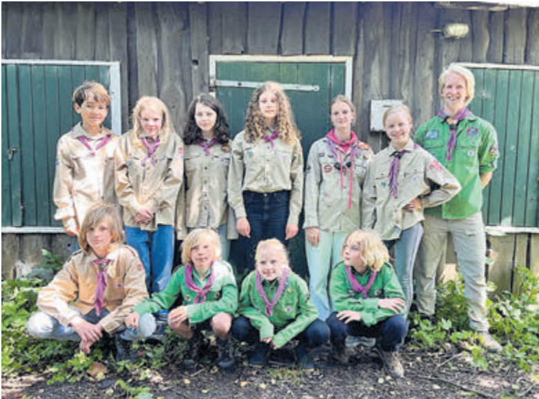
Een groep van recenter datum.

Ben jij zelf oud-lid of ken jij iemand die ooit lid is geweest van Scouting Castricum JL Die Bogheimers? Stuur bij interesse een e-mail naar seizoensopening@scoutingcastricum.nl voor meer informatie. „We gaan er een geweldige jubileumviering van maken”, aldus de organisatoren.