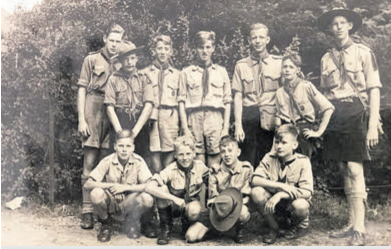
Een scoutinggroep in vroeger dagen.