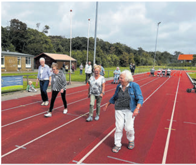
Deelnemers aan het onderdeel estafette tijdens de seniorenkamp in 2023.