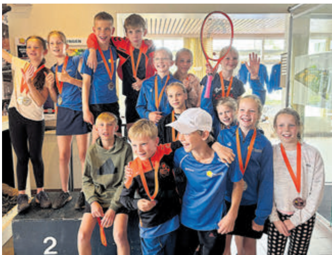
De winnaars van de jeugdclubkampioenschappen 2024.