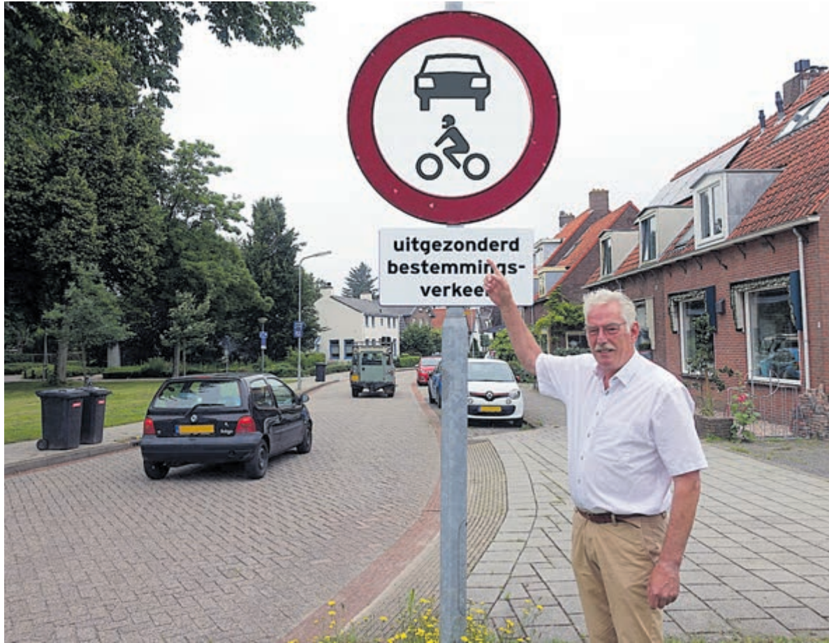
Zo zou volgens Rob Berkemeier het verkeersbord aan het begin en eind van de Bakkummerstraat eruit moeten zien.