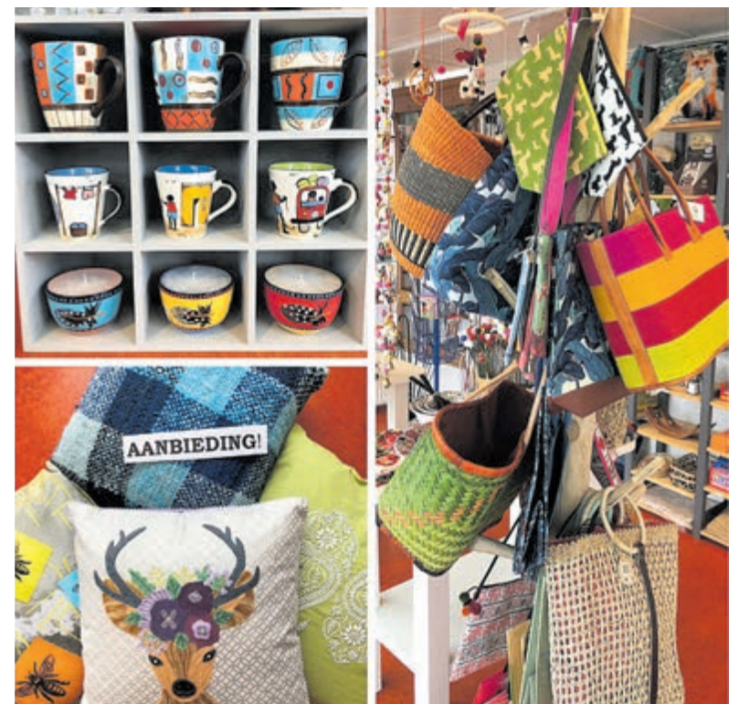
Veel artikelen gaan vanwege de verbouwing met extra korting de deur uit.

winkelruimte beschikbaar op het Bakkerspleintje zodat de verkoop kan doorgaan. Kringloopwinkel Muttathara geeft meubels in bruikleen voor de inrichting daarvan. Meer informatie over de stand van zaken van de verbouwing en tijdelijke verhuizing staat op www.wereldwinkelcastricum.nl en op Facebook en Instagram.