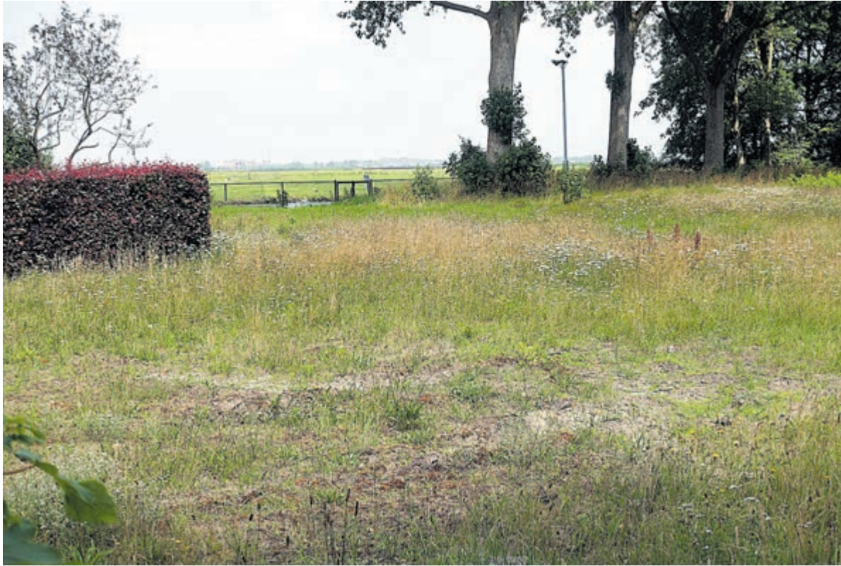
De locatie waar het hospice zou moeten komen.