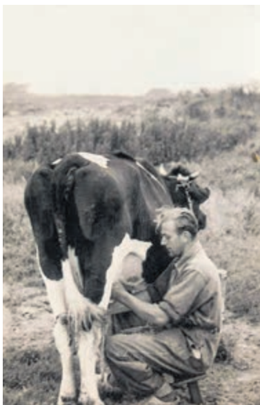
Siem in 1957, als het melken nog handmatig gebeurt.