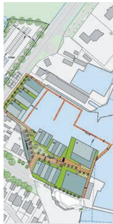
Situatietekening van het plangebied.