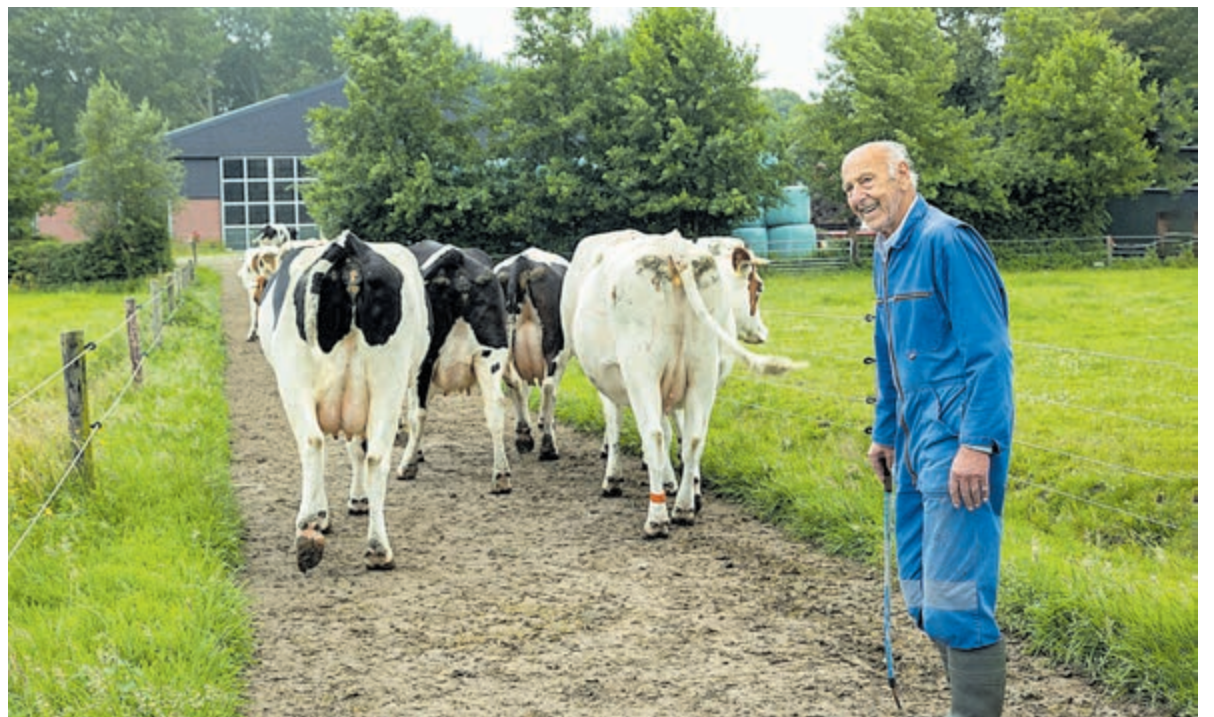
Het naar de stal brengen van de koeien is elke avond vaste prik.