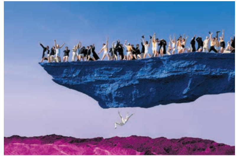
De voorstelling 'De meester en Margarita' is van vrijdag 6 tot en met maandag 9 augustus te zien.

inspiratie voor een nieuw familiebedrijf. Als baby Tina onthult dat ze een geheim-agent is voor BabyCorp, op een missie om de duistere geheimen achter Tabitha's school en de mysterieuze oprichter Dr. Erwin Armstrong te onthullen, zal het de Templeton broers op onverwachte manieren weer dicht bij elkaar brengen.