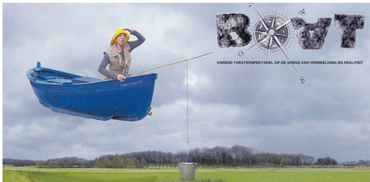
De theaterproductie BOAT is donderdag en vrijdag in Castricum te zien.

De voorstelling is uit te breiden met het diner-arrangement 'Theater & Diner Russische stijl', waarbij je aanschuift in 'De Oude Keuken' voor een verrassend - Russisch getint - tweegangendiner en koffie toe. Leuk is ook dat bezoekers de voorstelling kunnen combineren met één van de vele fiets- en wandelroutes door de prachtige duinen en bossen om het landgoed heen. 'De meester en Margarita' is te zien vrijdag 6 tot en met maandag 9 augustus. Kijk op www.karavaan.nl voor overige informatie en kaartverkoop.