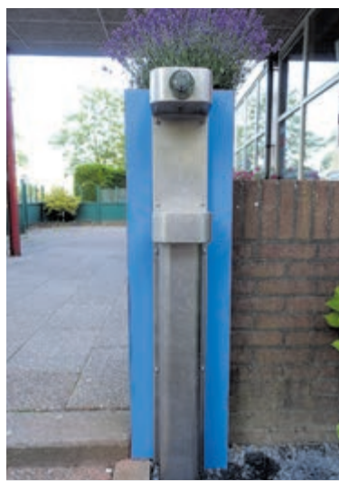
Watertappunt bij De Bloemen.

Afgelopen zaterdag kregen we de bevestiging van de stuurgroep dat onze aanvraag was goedgekeurd, waar we natuurlijk erg blij mee zijn. Het resterende bedrag hopen we bij elkaar te krijgen door vrijwillige bijdragen uit clinics en andere activiteiten van jongeren.”