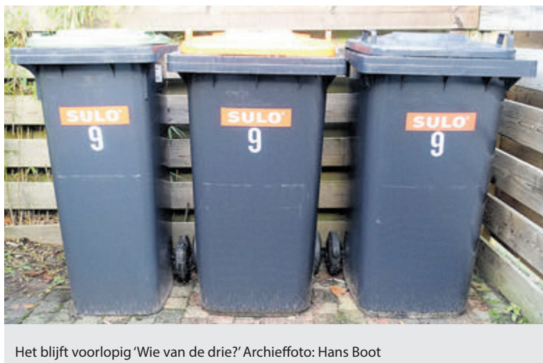
Het blijft voorlopig 'Wie van de drie?'

Castricum - Vorige week verscheen in de landelijke pers het bericht dat steeds meer gemeenten ervoor kiezen om restafval en PMD (plastic, metaal en drankverpakkingen) niet langer vooraf te scheiden, maar dat achteraf te laten doen door afvalverwerkers. Daardoor kan er een kliko verdwijnen. In Castricum is daar voorlopig nog geen aanleiding voor.