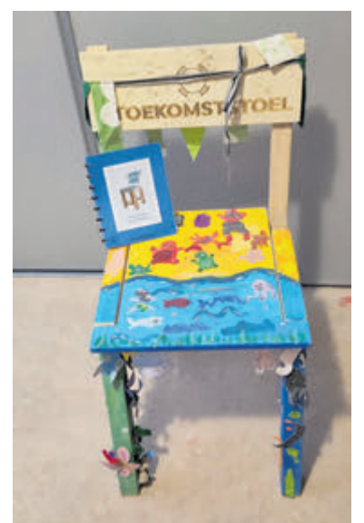
De toekomststoel.