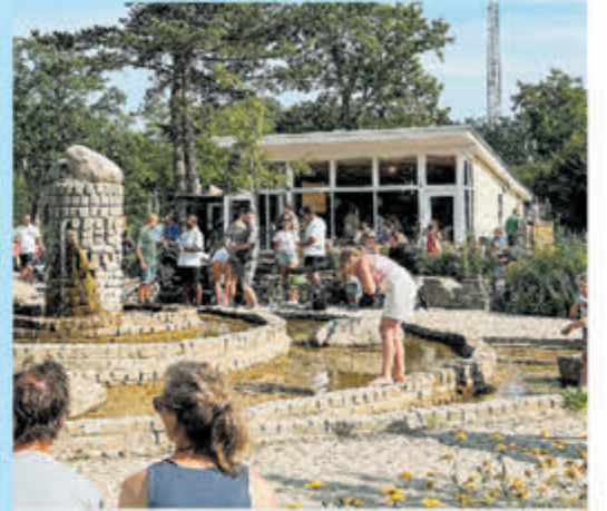
Bakkum Bites op het ontmoetingsplein van Camping Bakkum.

Beide horecagelegenheden bieden vernieuwde, avontuurlijke waterspeeltuinen die garant staan voor speelplezier voor jong en oud. Of je nu zin hebt in een verfrissende smoothie, een heerlijke borrel of een zomerse cocktail, hier zit je goed. Terwijl je geniet van livemuziek en de gezellige sfeer, kun je gerust je zonnebril opzetten en je onderdompelen in het vakantieplezier. Het bruisende plein, de heerlijke gerechten en de lekkere drankjes maken deze horecagelegenheden tot een must-visit. Kom dus snel langs en ontdek!