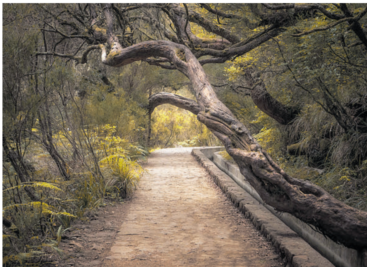
„Fotografie biedt voor mij eindeloze mogelijkheden voor creativiteit en zelfexpressie.”

Mervyn en DJ Dylan zorgen voor de muziek en er staan zomerse 0.0-cocktails klaar. Ouders en begeleiders kunnen elkaar ontmoeten in de voorzaal. De G-disco vindt plaats van 20.00 tot 22.00 uur. Na de zomerstop volgt op 20 september de eerste editie van het nieuwe seizoen.