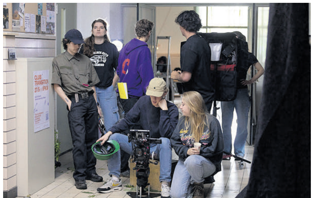
Een deel van de crew aan het werk tijdens de opnames.

Doneren? Dat kan door de QR-code te scannen of door te gaan naar de website www.gofundme.com/f/kortefstudeerfilm-twee . Donateurs krijgen een uitnodiging om bij de vertoning van de film te zijn.