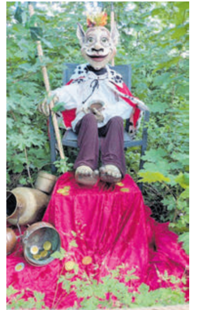
Koning Trol op zijn troon.

Kinderen kunnen onder begeleiding van een volwassene alle sprookjes ontdekken en opdrachten doen waardoor de sprookjes tot leven komen. De spel- en sprookjesspeurtocht gaat langs de mooiste plekjes in de tuin. Dit jaar komt koning Trol de tuin bezoeken en je kunt zijn goud bekijken. De Bremer Stadsmuzikanten openen de sprookjestuin met muziek. Het sprookjes-maakteam van kunstenaar Anja Jonker en Marije Samuels kreeg dit jaar versterking van poppenmaakster en viltkunstenaar Amber Paans uit Zaandam. In het midden van de tuin staat zoals altijd het verhaal van Pluk van de Petteflet centraal. Hier vaart het bootje 'de Heen en Weer Wolf' en de kinderen mogen mee. De Sprookjestuin is een absolute aanrader voor het begin van de zomervakantie en een onvergetelijk vakantie-uitje. Doe de speurtocht en kom daarna genieten op het terras.