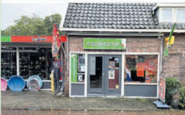
Marskramer Toys2Play • Julianaweg 40