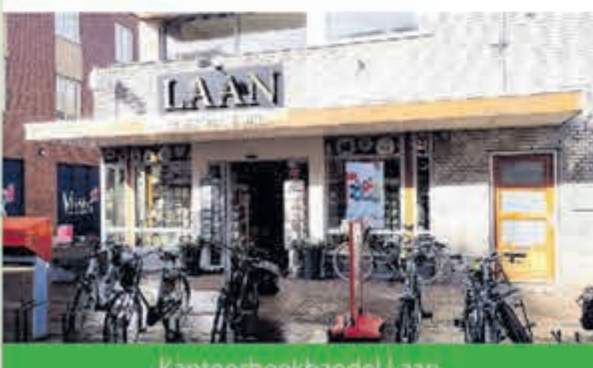
Kantoorboekhandel Laan Burgemeester Mooijstraat 19