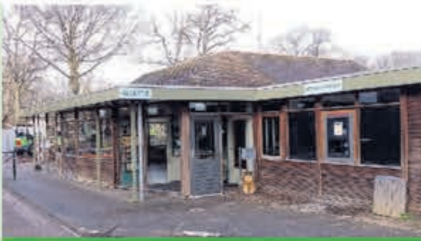
Camping Geversduin • Beverwijkerstraatweg 205 1 april tot eind september