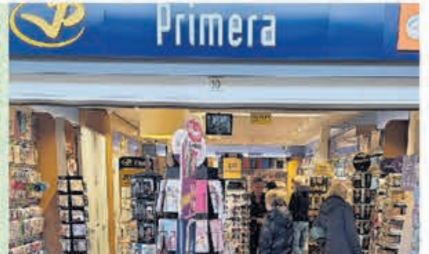
Prima • Geesterduin 10