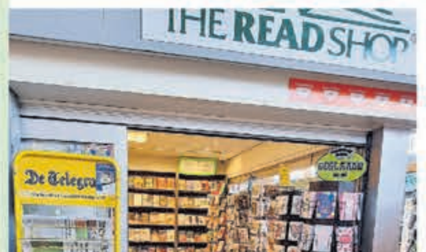
Readshop • Geesterduin 45