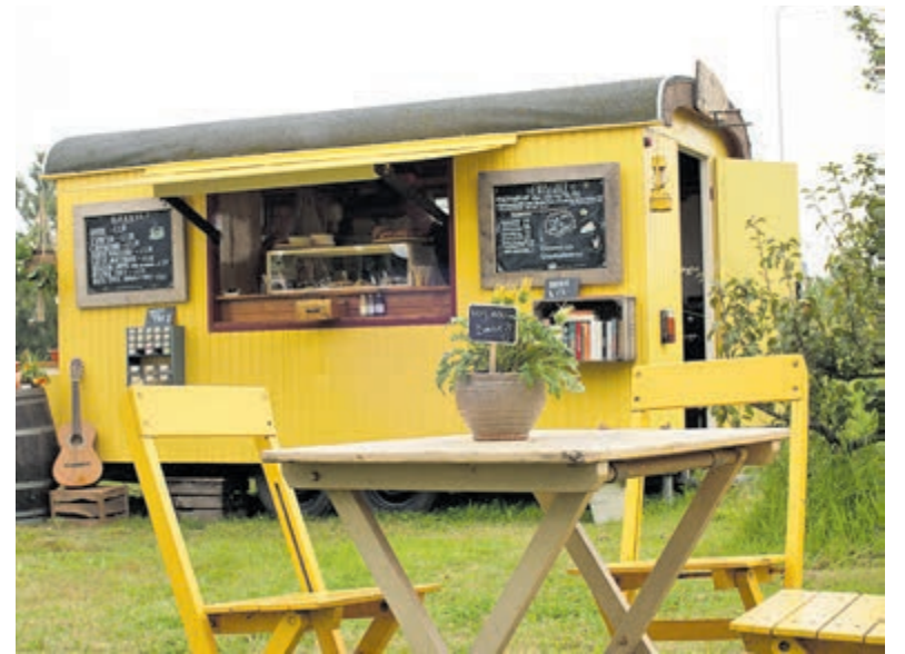
De rijdende koffiebar van Anna staat deze hele maand op De Woude.

zoals voorlezen, liedjes zingen, dansen, koffiezetten en opruimen. De Peutercafés in Castricum, Akersloot en Limmen zijn geopend tot en met 9 augustus. Aansluitend drie weken vakantie, vanaf 2 september weer open. In Castricum elke maandag, dinsdag en vrijdag van 10.00 tot 11.30 uur (Buurt- en Biljartcentrum Castricum, Van Speyckkade 61). Aanmelden via peutercafe@welzijncastricum.nl of 06 42892157 (SMS of WhatsApp). In Akersloot elke dinsdag van 10.00 tot 11.30 uur in de bibliotheek. Aanmelden niet nodig. In Limmen elke donderdag van 10.00 tot 11.30 uur in de bibliotheek. Aanmelden niet nodig.