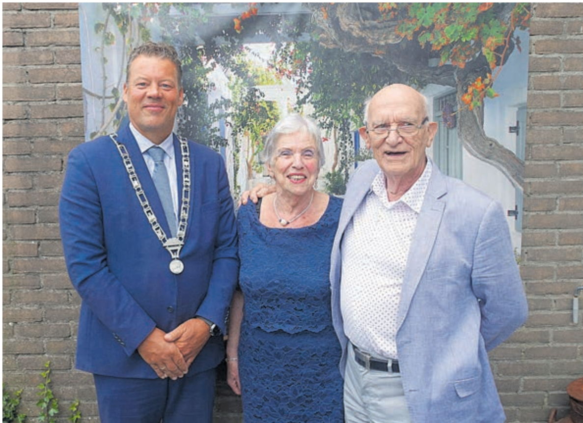
Het diamanten paar met burgemeester Tap.