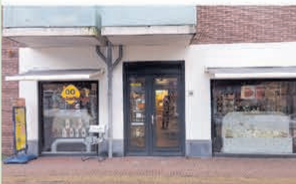
Vivant Rozing • Bakkerspleintje 1-C