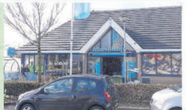
AH Vuurbaak • Vuurbaak 1