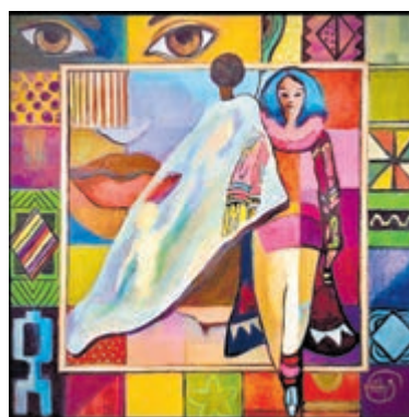
Een werk van Hetty Spaanderman.

Het restaurant is dagelijks van 09.00 tot 17.00 uur geopend. Kijk op www.deoudekeuken.net voor uitgebreide informatie.