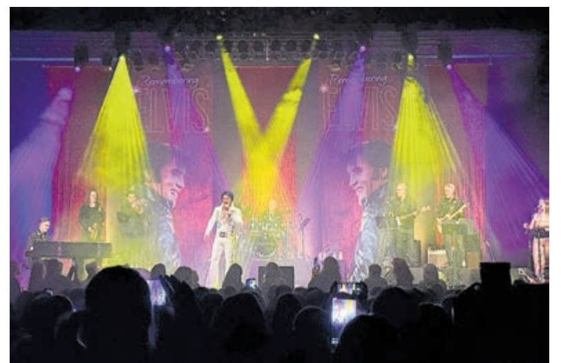
Elvis theatertour in Nieuwe Luxor in Rotterdam, waarbij Sound Rent licht en geluid verzorgde.