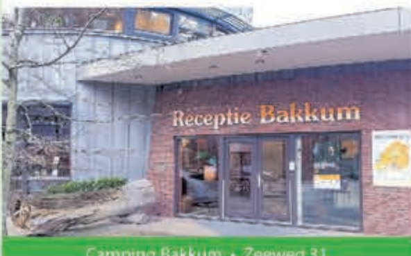
Camping Bakkum • Zeeweg 31 1 april tot eind september