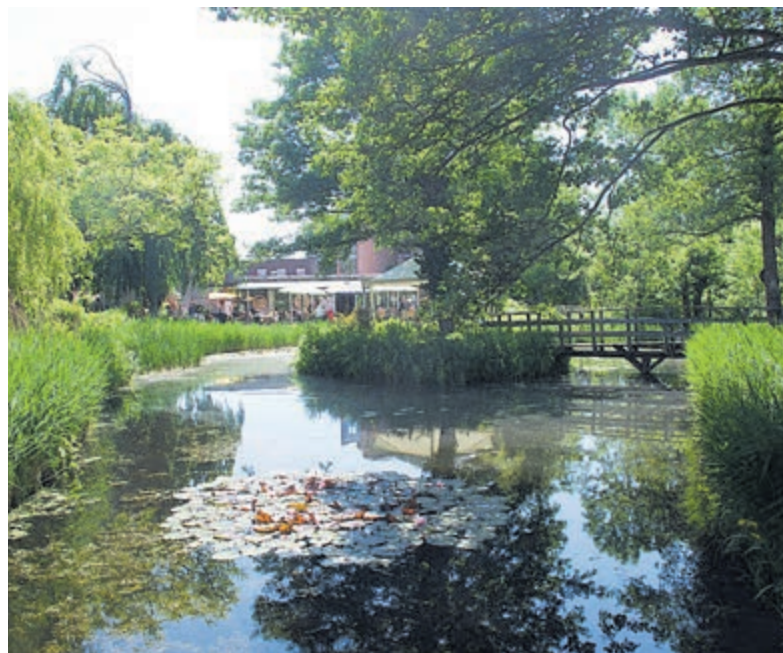
De magische schoonheid van de Tuin van Kapitein Rommel.

Castricum - In het kader van Samen 'Eén tegen eenzaamheid' organiseren de Tuin van kapitein Rommel en Welzijn Castricum een gezellige activiteit op woensdag 14