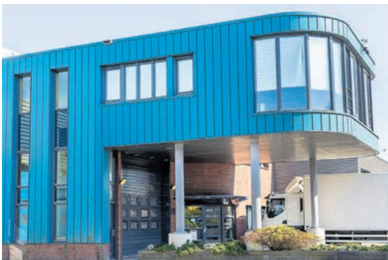
Het pand aan de Castricummer Werf 99a waar het kantoor, een studio en een deel van het magazijn zijn ondergebracht.