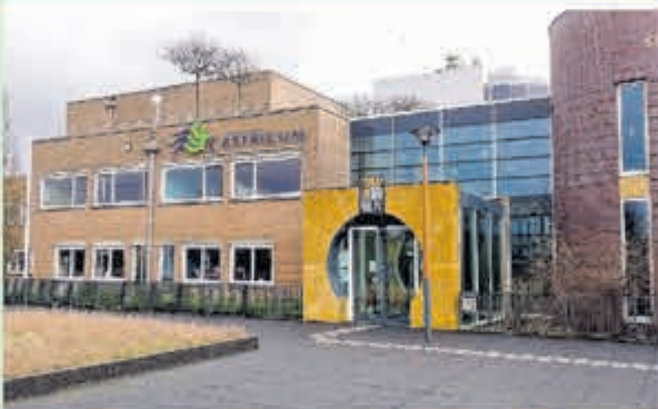
Gemeente Castricum • Raadhuisplein 1