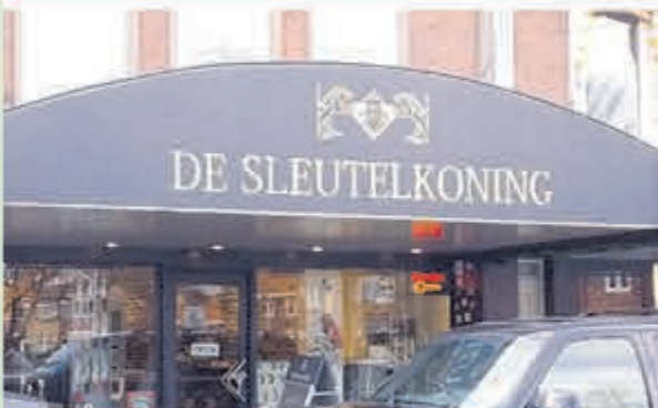
De Sleutelkoning • Torenstraat 38A