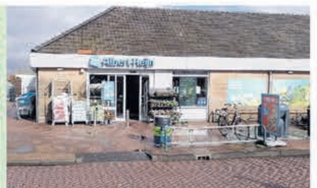
Albert Heijn Akersloot • Raadhuisweg 3