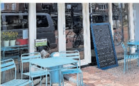
Vishandel Klepper • Dorpsstraat 34