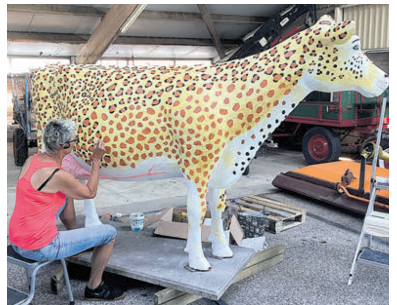
Will, bezig met het aanbrengen van honderden pantervlekken.

Will zelf zat er niet mee. „Ik heb mij lekker kunnen ontspannen en mijn hoofd leeg kunnen maken”, aldus Will. Het resultaat mag gezien worden. De voormalige bleekscheet koe staat er weer jong, fris en fier bij. Het boegbeeld van de minicamping is weer nieuw leven ingeblazen. De familie Duijn is er blij mee.