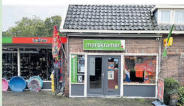
Marskramer-Toys2Play • Julianaweg 40