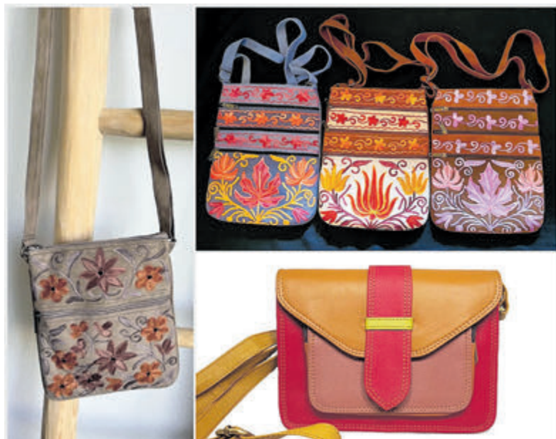
Met deze tassen mag je gezien worden!