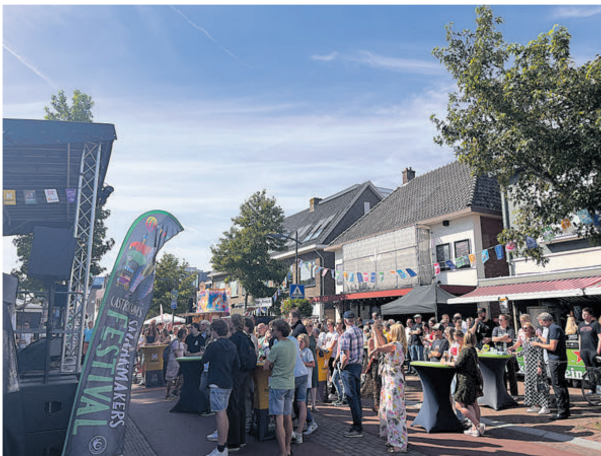
Sfeerbeelden van een eerdere editie van het Castricums Smaakmakers Festival.

Castricum - Het is bijna zover: hét culinaire en culturele hoogtepunt van het jaar. Op 31 augustus en 1 september verandert het dorpshart weer in een sfeervol festivalterrein met gezellige muziek en tal van foodtrucks en terrassen met lekker eten en drinken.