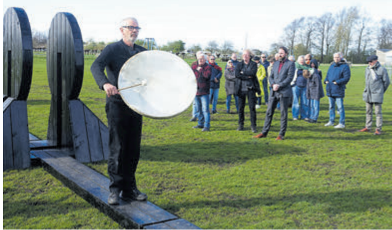
De ingebruikname van het Contemplatorium op 28 maart.

Akerslout - Het houten kunstwerk van de Stichting Kunst in C dat eind maart in De Hoorne feestelijk door wethouder Valentijn Brouwer werd onthuld en vervolgens begin april werd gestolen, houdt de gemeederen nog steeds bezig.