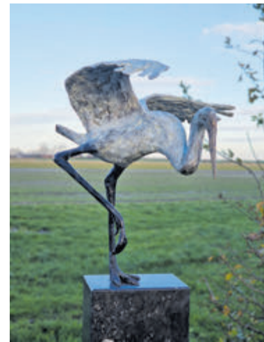
Grote Zilverreiger, brons.