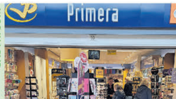
Prima • Geesterduin 10