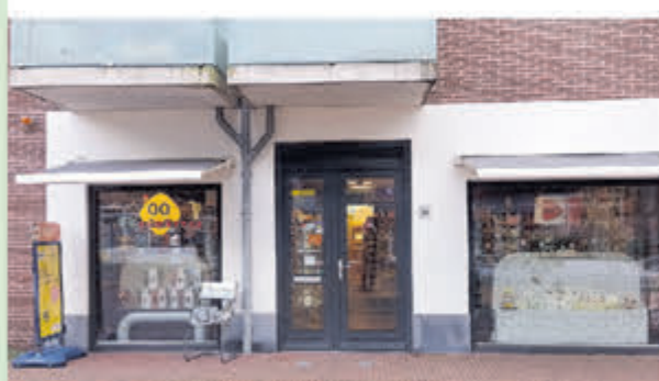
Vivant Rozing • Bakkerspleintje 1-C