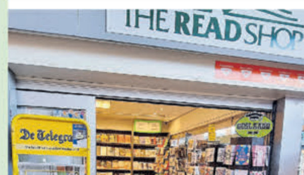
Readshop • Geesterduin 45