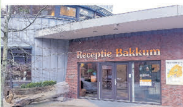
Camping Bakkum • Zeeweg 31 1 april tot eind september