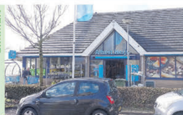
AH Vuurbaak • Vuurbaak 1