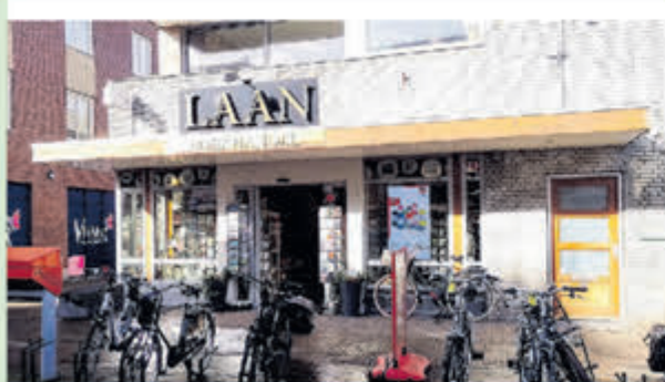
Kantoorboekhandel Laan Burgemeester Mooijstraat 19