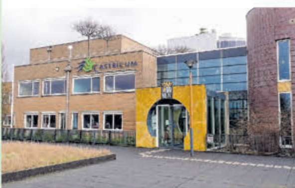
Gemeente Castricum • Raadhuisplein 1