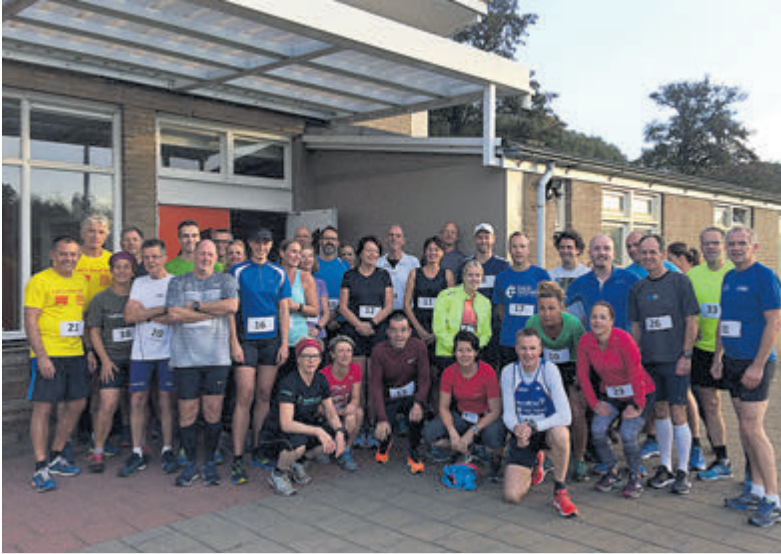
Een groep deelnemers aan een eerdere editie van de Egmondstage.