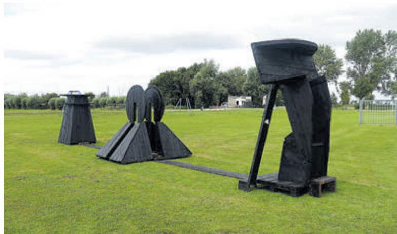
De replica van het kunstwerk.