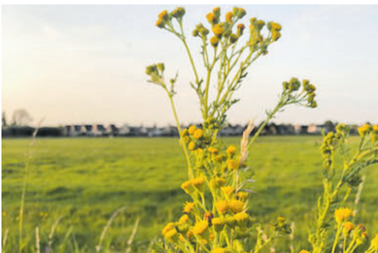
Jacobskruiskruid in de berm langs de Sluisweg in Akersloot.

Castricum - CDA Castricum trekt bij burgemeester en wethouders aan de bel over het giftige Jacobskruiskruid dat op verschillende plekken in de gemeente groeit. De plant, die her en der in bermen in de bloei staat, is gevaarlijk voor schapen, koeien en paarden, maar ook voor de mens. „Als de plant niet uit de berm wordt verwijderd, gaat hij zaaien en komen ook de bermen en weilanden in de omgeving vol met zaad van deze giftige plant. Omdat de planten nu in bloei staan is snelle verwijdering noodzakelijk”, zo schrijft de raadsfractie aan B&W. Men wil daarnaast ook weten of er al beleid is betreffende de bestrijding van het Jacobskruiskruid in de bermen.