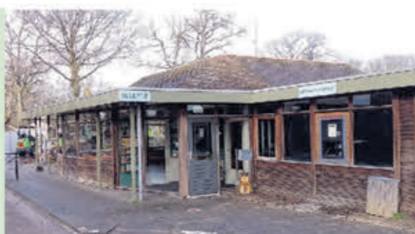
Camping Geversduin • Beverwijkerstraatweg 205 1 april tot eind september