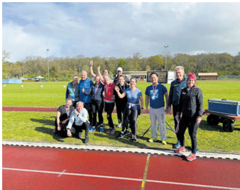
Start en finish van de trainingen zijn bij de vernieuwde atletiekbaan aan de Zeeweg 4.