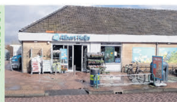
Albert Heijn Akersloot • Raadhuisweg 3