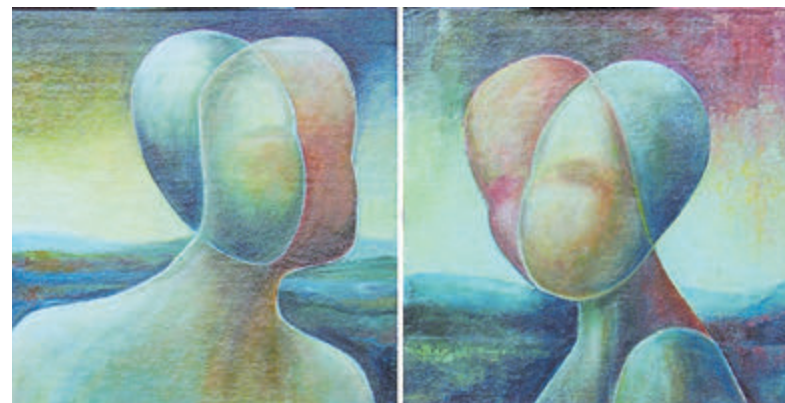
Twee verschillende versies van dezelfde werkelijkheid. Het is maar net hoe je het bekijkt.

werkelijkheid heel anders interpreteert. In plaats van afwijzen, kun je veel beter vragen wat een ander ziet. Dan kun je tot een gesprek komen. Het lijkt een open deur, maar het valt niet altijd mee. Blijf proberen! Succes!” Ook over de schilderijen kun je met elkaar praten en er zo achter komen wat een ander ziet. Muzikale medewerking wordt verleend door organist Remco Wijnia en trompettist Feddo Boschma. De expositie is na 15 september niet alleen op zondag voor en na de viering, maar ook elke donderdag van 10.00 tot 12.00 uur en vrijdag van 10.30 tot 12.30 uur te bekijken.