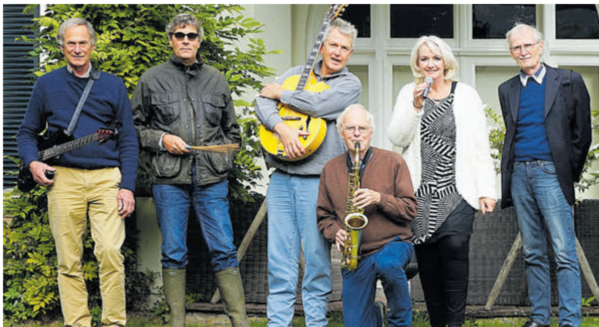
De groep Par Six.

Ga naar: www.castricummer.nl/aanmelden-nieuwsbrief en meld je aan