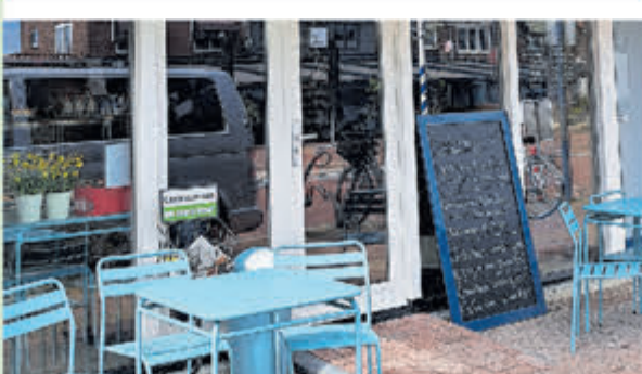
Vishandel Klepper • Dorpsstraat 34