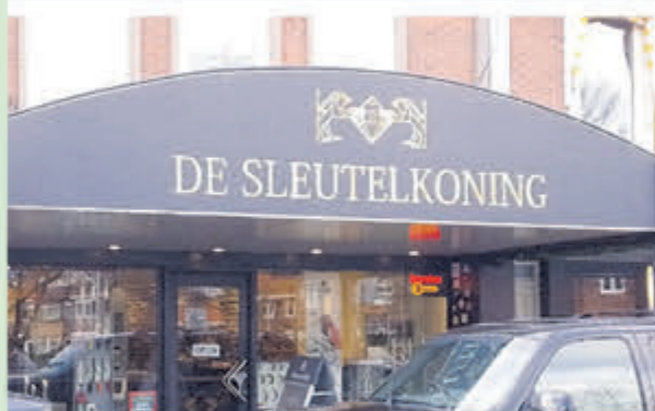
De Sleutelkoning • Torenstraat 38A