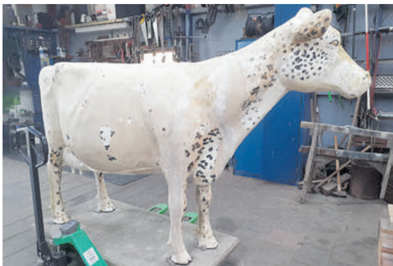
Vóór de behandeling staat de panterkoe er als een bleekscheet bij.

Bakkum - Het ouder worden neemt uiterlijke zichtbare veranderingen met zich mee. Dit geldt ook voor de panterkoe die sinds 2000 de wacht houdt bij minicamping De Tien Morgen aan de Zeeweg. Door de invloed van de zon is deze meer op een koe met mazelen gaan lijken. Will Borst liet als 'cosmetisch schilder' een peeling op deze bleekscheet los.