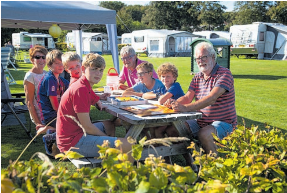
Voor een familiespel is iedereen wel te vinden