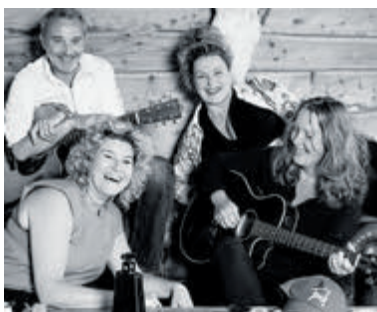
De band Fonk verzorgt twee sets met akoestische muziek.

Bakkum - Atelier Bakkum presenteert komend weekend voor het eerst de nieuwe expositie 'Oogst Appèl': „Langzaam maar zeker