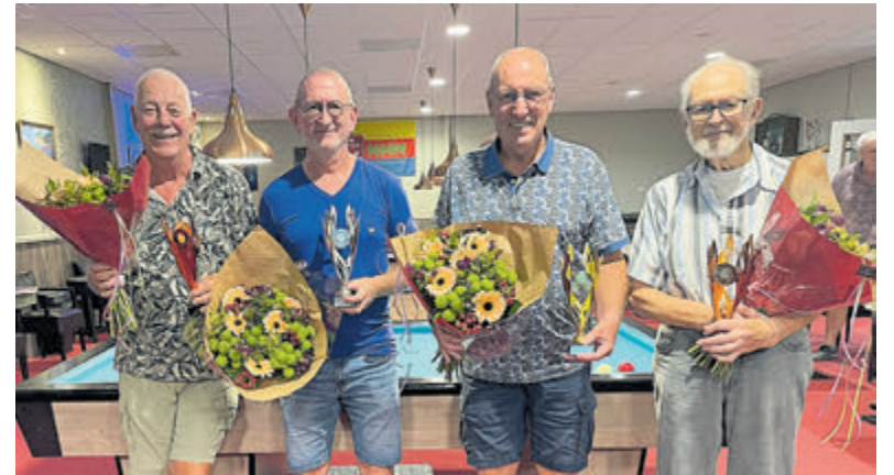
De blijde spelers van het BVC-Targa-Team na hun overwinning.

dreigd over de meet en kon zijn eerste punten bijeenprokkelen voor het regelmatigheidsklassement van de OIT-cup. Door een afloper moest Alwin Hes in de slotfase Walter van Kuilenburg laten gaan, maar na een paar pompbeurten kon hij toch uitrijden om voor score in voornoemde rangschikking in aanmerking te komen. Henk Jan Verdonk senior en Piet Veldt, de kilometervreeters, bleken hun normale niveau te hebben behouden ondanks de zomerstop.