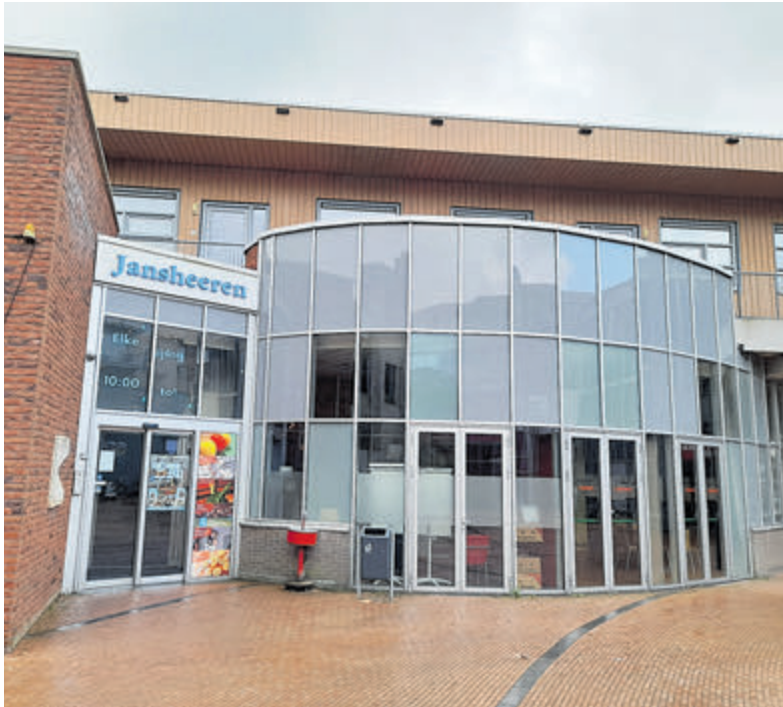
De presentaties worden gegeven in cultureel centrum Jansheeren.

Atelier Bakkum aan de Van Oldenbarneveldweg 32 (met werk van Sabrina Tacci, Mireille Schermer, Marina Pronk en haar kunstcollectief CAKtwo) is elke vrijdag van 13.00 tot 18.00 uur geopend. Tevens elk tweede weekend van de maand geopend op zaterdag en zondag van 13.00 tot 18.00 uur. Info op www.marinafotografie.nl .