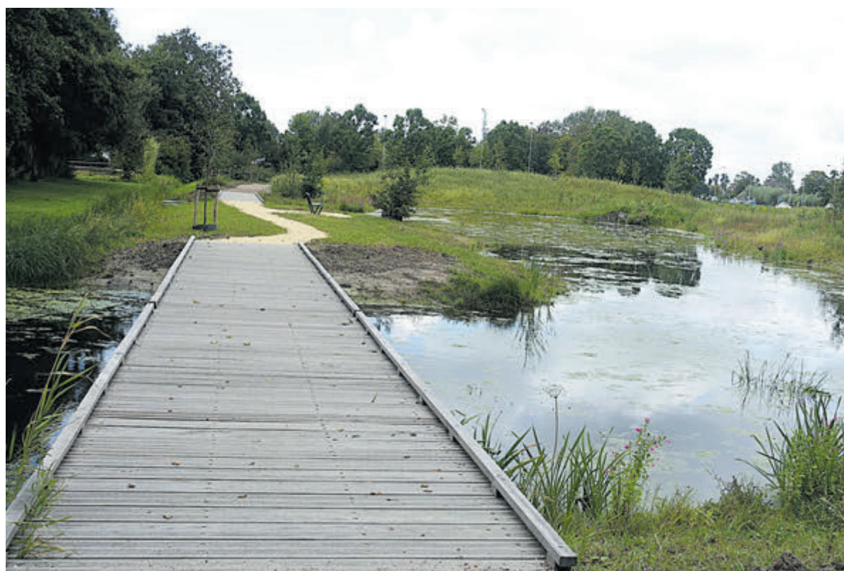
De vijver.

De eerste bijeenkomst is 21 september van 16.00 uur tot 20.00 uur bij De Schakel (achter de dorpskerk), Kerkpad 3, Castricum. Kijk voor meer informatie op de website: www.samencastricum.nl Aanmelden doe je via: welkom@samencastricum.nl