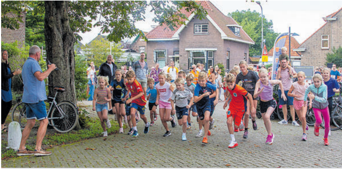
De jeugd 9-12 jaar legde twee rondjes af.