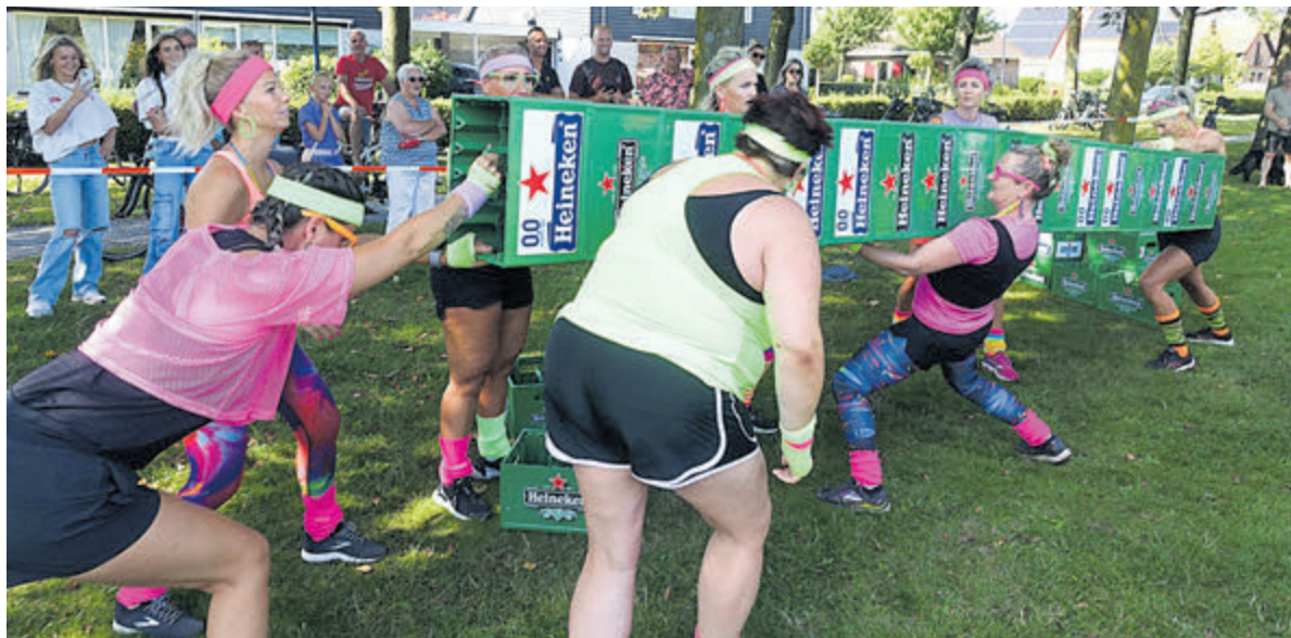
Het bierkrattenspel.