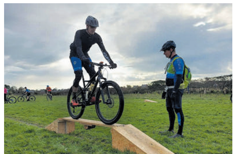
Het oefenen met obstakels.