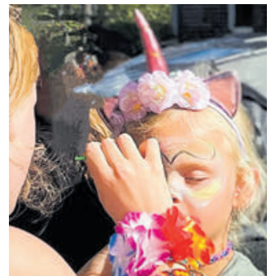
Schminken en Hollandse muziek bij De Oude Keuken.

Talrijke buurtgenoten geven dan weer gehoor aan de oproep om elkaar in hun straat en buurt te ontmoeten op dit evenement dat jong en oud met elkaar verbindt. De centrale Bakkum Bruist-activiteit zal dit jaar plaatsvinden van 14.00 tot 17.00 uur bij De Oude Keuken aan de Oude Parklaan 117. De band Hollands Genoegen laat van zich horen met een live optreden. Kom langs om kinderen te laten schminken en zing gezellig mee met oud Hollandse nummers.