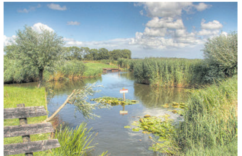
Ruim 5000 jaar geleden lag de zee waar nu Akersloot is.

dat wil – van jong tot oud – vrijblijvend een paar uurtjes meehelpen om onder deskundige begeleiding struiken te verwijderen, bosranden te snoeien, bomen te zagen en uit te steken, stuifkuilen te beheren of exoten te verwijderen. Tijdens de Duinwerkdagen zorgt PWN voor goed gereedschap, werkschoenen, deskundige begeleiding, koffie, thee, limonade en soep. Kijk op www.pwn.nl/duinwerkdagen voor meer informatie, de data en aanmelden.