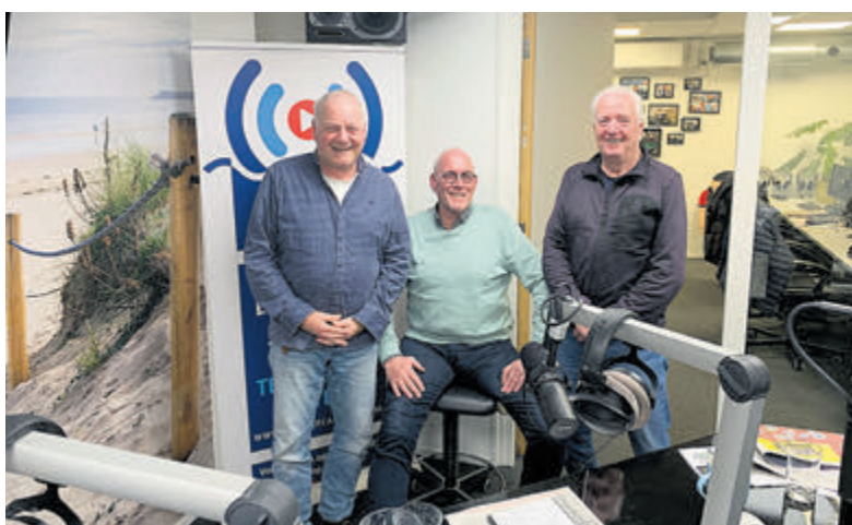
Het team van het programma 'De Nababbel'.

Castricum - Op maandag 16 september zijn de mannen van De Nababbel weer terug met hun wekelijkse sportprogramma. Zij praten je zoals altijd weer bij over het regionale voetbaloverzicht, waarbij de belangrijkste wedstrijden en uitslagen worden besproken. Naast voetbal is er ook aandacht voor andere sporten uit de regio. Daarnaast schuiven er interessante studiogasten aan om over de actualiteit en hun passie te praten. Dit zorgt ongetwijfeld weer voor boeiende gesprekken. Natuurlijk is er ook heerlijke muziek te horen om de uitzending compleet te maken. Het programma is van 19.00 tot 20.00 uur te horen via Omroep Castricum op 105.0 FM.