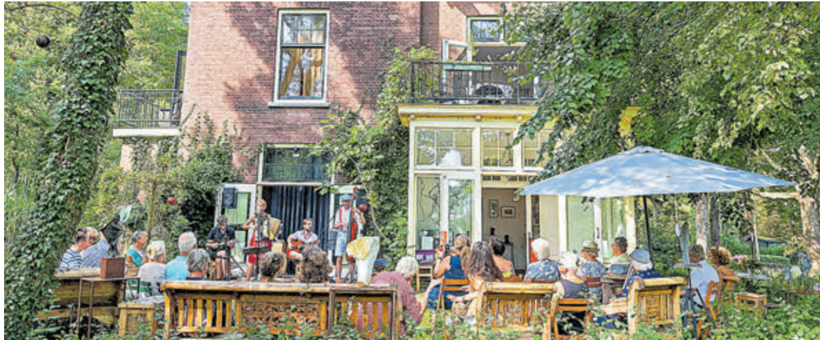
Optreden bij de voormalige dienstwoning Duin en Bosch aan de van Oldenbarneveldweg 32, waar tegenwoordig Atelier Bakkum gevestigd is.

inwoners, zoals afgesproken in het coalitieakkoord. We willen ervoor zorgen dat jong en oud in Castricum de mogelijkheid hebben om hier een passende woning te vinden.” De gemeente Castricum hoopt dat de samenwerking met de provincie Noord-Holland en het ministerie leidt tot een passende oplossing om deze wens te realiseren. Het ontvangen van een 'Verklaring van geen bezwaar' zou een mooie stap zijn.