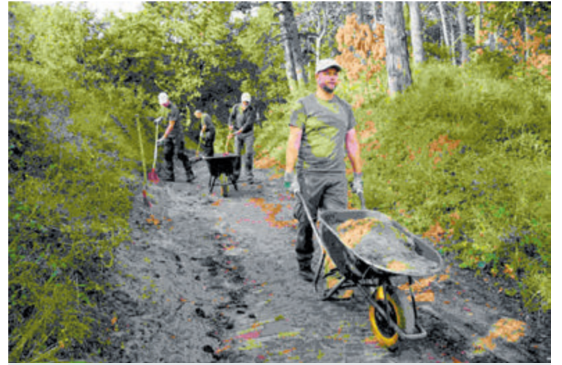
Werk samen met andere natuurliefhebbers aan het behoud van de duinen.

Aanmelden via het inschrijfformulier op www.ggdhn.nl/cursussen (tevens overzicht van andere cursussen) en bij vragen kan contact opgenomen worden met het cursusbureau ( cursusbureau@ggdhn.nl / 088 0100550, keuze 4).