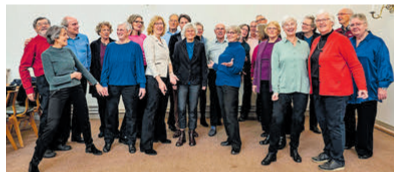
Wie komt Kleinkoor Castricum versterken?

zich voor deze jubileum expositie gaan inschrijven! Voor beginnende kunstenaars, jongeren van basisscholen en het voortgezet onderwijs en mensen met een beperking zijn er speciale mogelijkheden. Stuur een e-mail naar limmencultuur@hotmail.com om hierover meer informatie op te vragen. Deelnemers kunnen zich via het inschrijfformulier op www.limmencultuur.nl aanmelden voor de expositie en workshops. Het wordt een speciale expositie met extra activiteiten en feestelijkheden voor jong en oud.