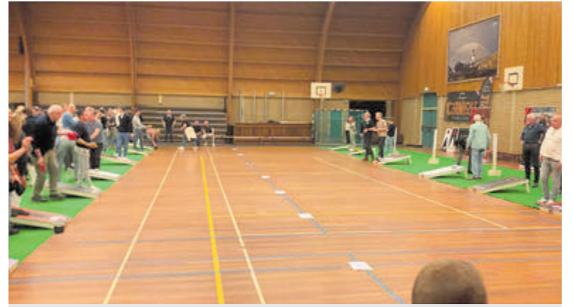
Kom vanaf oktober langs voor een gezellig avondje cornhole.

De tweede helft bleef spannend met kansen voor beide teams. Vitesse '22 bleef aandringen, maar hun pogingen werden herhaaldelijk gestopt door de uitblinkende ZOB-keeper Huub Schuurman. Een afstandsschot van Rick Tolsma, dat volgens toeschouwers over de lijn ging, werd niet geteld, wat de frustratie nog groter maakte. Aan het eind hadden beide ploegen de kans om de volle winst te pakken, maar geen van de teams wist te scoren. Vitesse '22 speelt komende zondag tegen FC Aalsmeer.