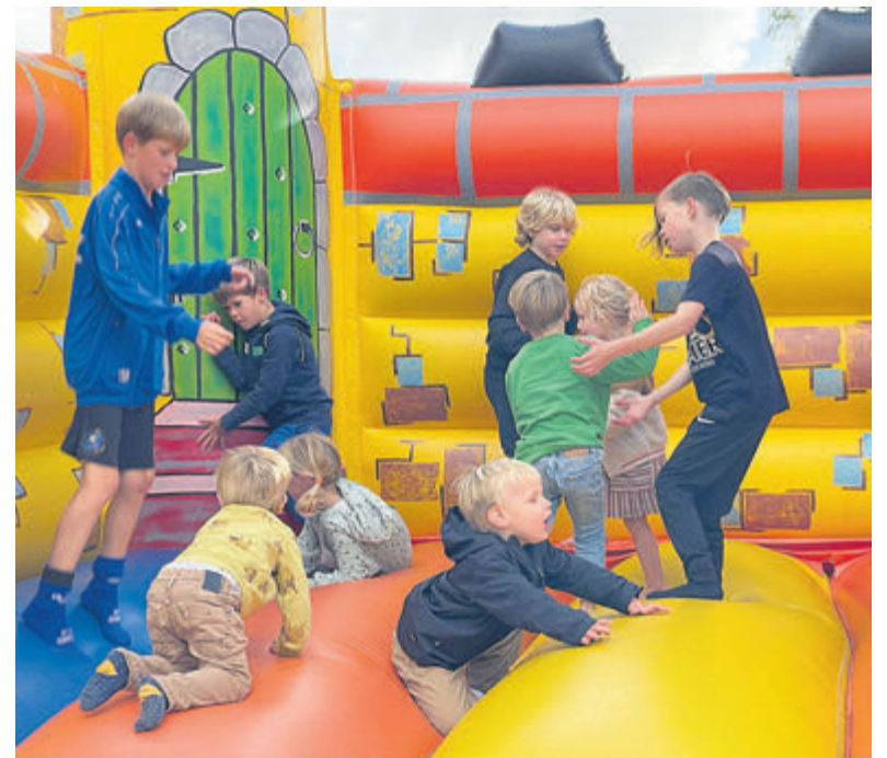
De kinderen in de Jacob Catsstraat.

gingen om te werken. Even verderop in de Prinses Irenestraat, staat de straat ook vol mensen. Een klein meisje komt deze verslaggever tegemoet en zegt: „het is afgezet hier hoor!” In alles feestvierende straten is er een hartelijke welkom. Stoelen en drankjes worden aangesleept. „Maar ik woon hier helemaal niet.” „Zeker weten van wel!”, is het antwoord.