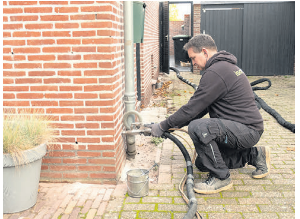
Spouwmuurisolatie draagt bij aan het verlagen van de energierekening.