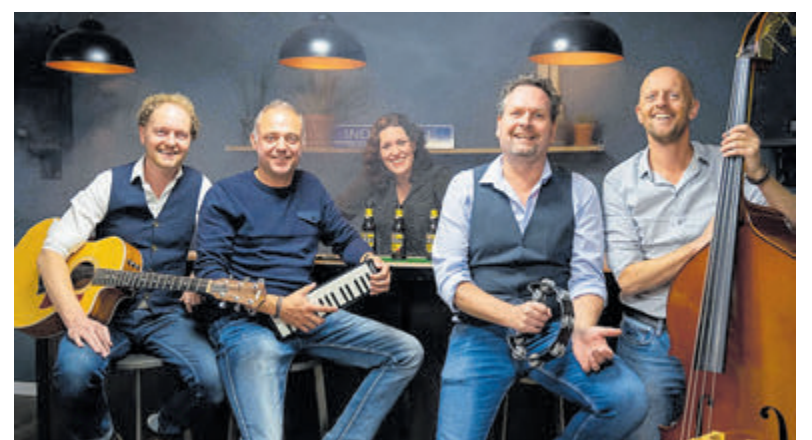
De groep Indahouse.

bereiken die KIKA willen steunen. De ontmoetingsruimte in de Tuin van kapitein Rommel is geopend maandag tot en met vrijdag van 09.30 tot 16.30 uur.