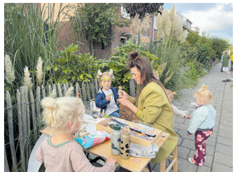
Kinderen schminken in de Prinses Irenestraat.