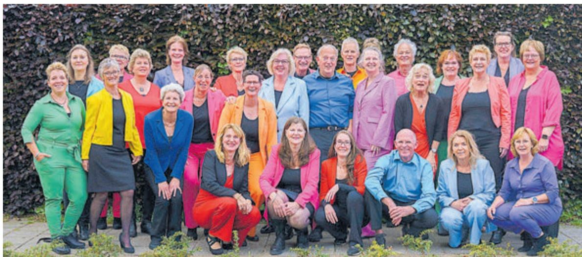
Groepsfoto van de koorleden afgelopen juni.

wendingen, verboden verlangens en onvergetelijke melodieën, waarin onweerstaanbare komedie wordt afgewisseld met momenten van adembenemende schoonheid.