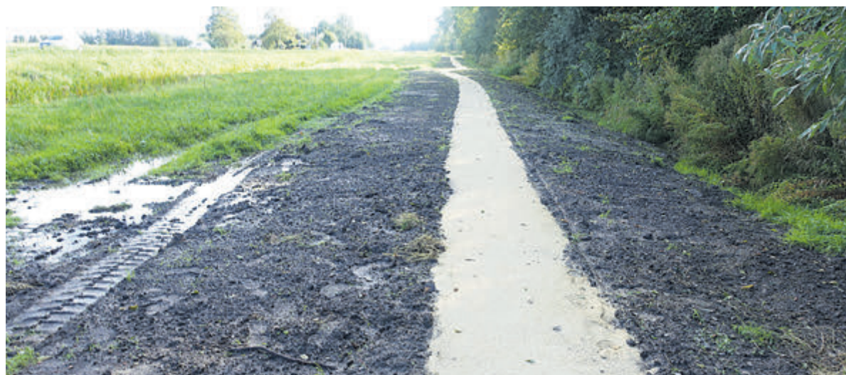
Het wandelpad in de huidige staat.

Castricum - In deze krant van 11 september werd melding gemaakt van de vondst van restafval op het in aanleg zijnde wandelpad in het nieuwe natuurgebied langs de N203. De gemeente gaf toen aan dat het verantwoord was om bedoelde stukjes plastic, metaal en glas te laten liggen en daarop een toplaag aan te brengen. Inmiddels is dit gebeurd. Lokaal Vitaal wacht nog wel op antwoorden op vragen die hierover aan het college zijn gesteld.