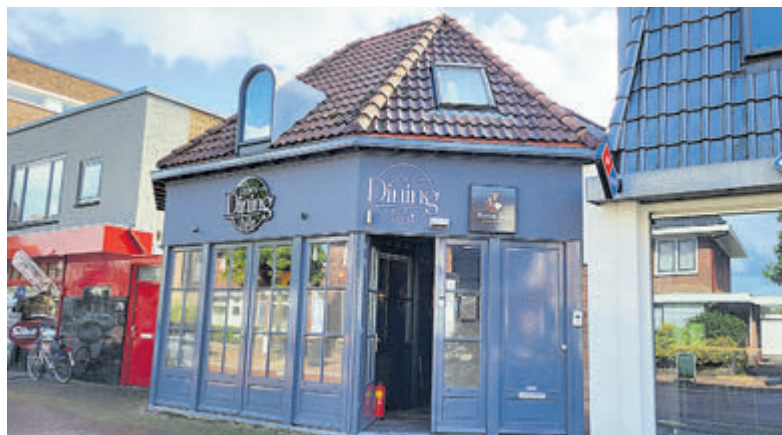
DOK's Dining.

DOK's Dining opent naar verwachting eind oktober/begin november haar deuren aan de Dorpsstraat 77 in Castricum. Van donderdag tot en met zondag zijn gasten van harte welkom om tussen 17.00 en 23.00 uur te genieten van een verfijnd menu en mooie wijnen met een eerlijke prijs-kwaliteitverhouding. Het aanbod omvat een breed scala aan vegetarische gerechten, maar ook vis- en vleesgerechten ontbreken niet. Gezelligheid en gastheerschap staat voorop. Gijs hoopt dat DOK's Dining de huiskamer van Castricum wordt, een thuis voor iedereen.