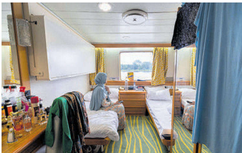
Onder meer op een schip in de haven van Velsen-Noord vonden vluchtelingen tijdelijk een onderkomen.