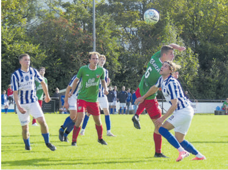
Na lange afwezigheid: Arendse heeft er zin in.

Castricum - De tactiek van FC Castricum was duidelijk en moest in eigen huis drie punten opleveren. De tactiek van coach Pim Touber werd al binnen drie minuten beloond, maar