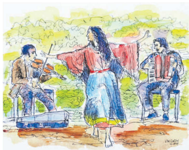
Romaliedereren hebben doorgaans een krachtige uitstraling.

neemt ook gastmuzikant Tom Damm (viool) deel. De Romaliedereren hebben een krachtige uitstraling. Ze zijn hartstochtelijk, romantisch en soms weemoedig van sfeer. De liedjes gaan over heimwee, verlangen, de strijd om het bestaan maar ook over levensvreugde, de liefde, feesten en dansen. Koorervaring is handig, maar het accent ligt op plezier in zingen. De workshop vindt plaats van 10.00 tot 12.00 uur in het gebouw van Tafeltennisvereniging Castricum aan de Gobatstraat 12a. Drankjes na afloop verkrijgbaar tegen contante betaling. Aanmelden en informatie: wimdegoede@gmail.com / 06 12025767.