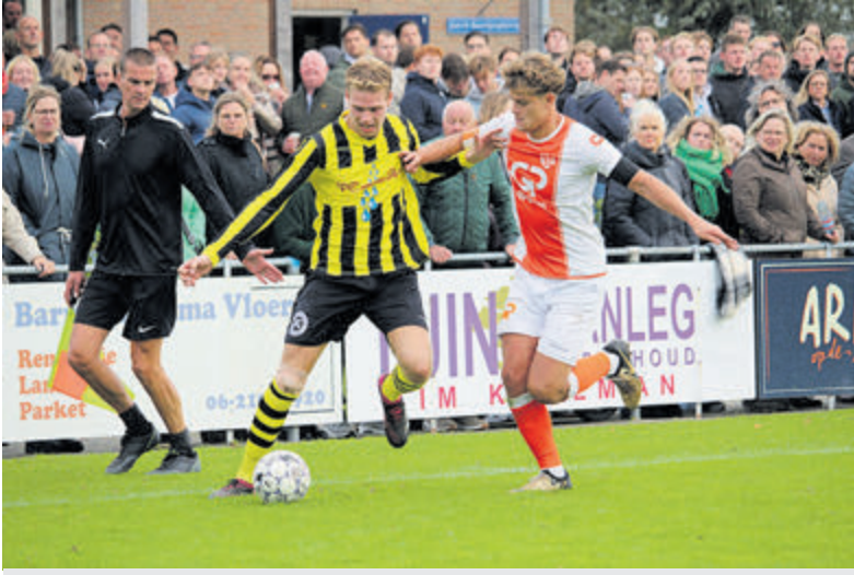
Een verbeterd Meervogels '31 - Limmen-duel.