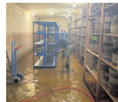
De ondergelopen kunstbunker.

Er is dus voorlopig een oplossing gevonden voor calamiteiten, maar volgens Eye is die niet ideaal: „Zandzakken, schotten, een verhoogde drempel en een extra pomp moeten het water buiten de deur houden. We zouden de bunker echter liever gisteren dan vandaag willen verlaten. Onze wens is om ergens in Nederland een nieuwe, moderne opslagplek te bouwen, maar deze structurele voorziening kost veel tijd en geld.”