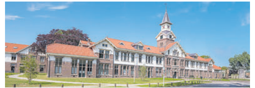
Het Oude Administratiegebouw op landgoed Duin en Bosch.

matie over het restaurant aan de Oude Parklaan 117.