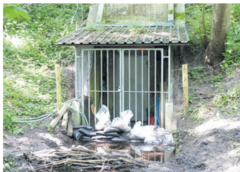
De bunker met zandzakken voor de deur.