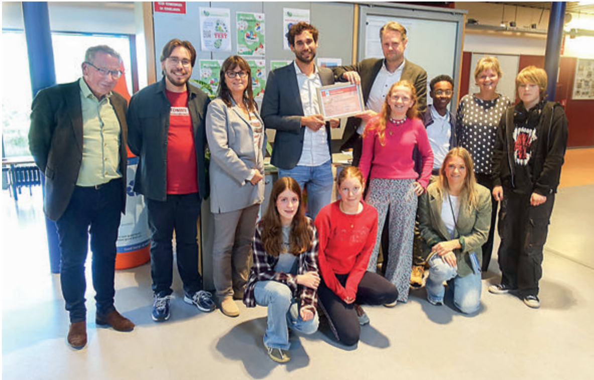
Bonhoeffer ontvangt bronzen certificaat Week van de Duurzaamheid