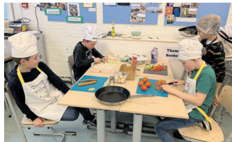
De combinatie van teamwork, zelfontdekking en het uitspreken van dankbaarheid maakte deze afsluiting heel bijzonder.

op sieraden en contant geld. De politie benadrukt dat agenten nooit bezittingen van inwoners meenemen om elders op te slaan. Het advies luidt om de verbinding te verbreken als iemand met een dergelijk voorstel belt en zeker niet op deze babbeltruc in te gaan