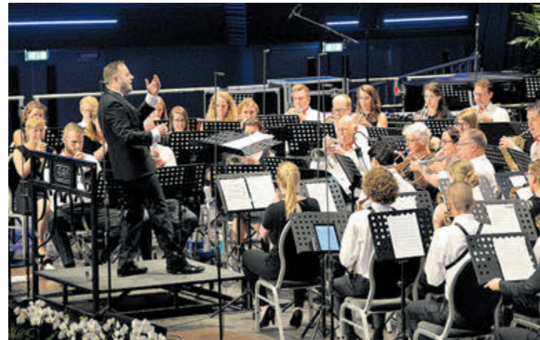
Het fanfareorkest van Emergo bij een concours in Zutphen.

Op zaterdag 26 oktober neemt brassband Backum Brass deel aan de Nationale Brassband Kampioenschappen in Tivoli Vredenburg in Utrecht en op zondag 24 november geeft het dagorkest DOE van Emergo een matineeconcert in de grote zaal van Geesterhage. Maar informatie daarover volgt binnenkort.