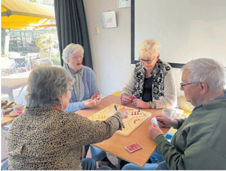
Wekelijks Keezen in de Tuin van kapitein Rommel.