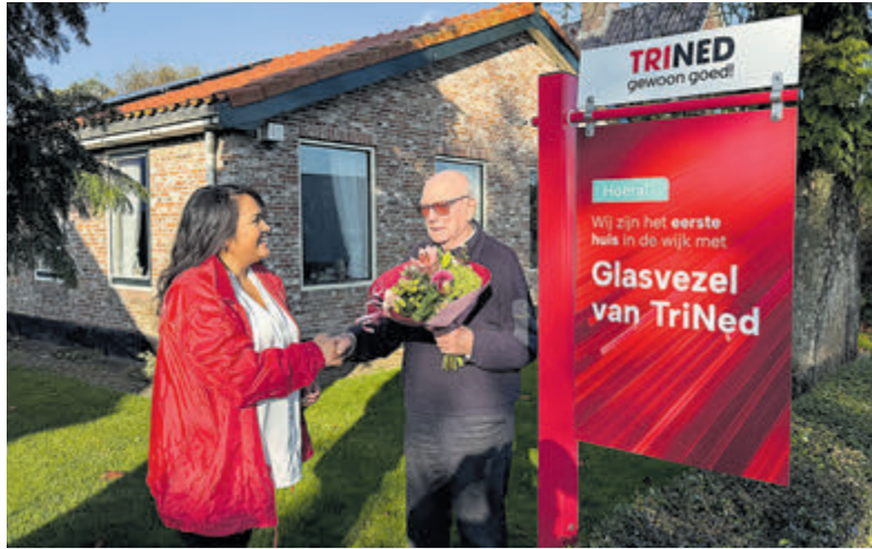
Een bos bloemen en een Bossche bol voor de eerste bewoner die via TriNed is aangesloten op het glasvezelnetwerk van E-Fiber.

Limmen - Inwoners van Limmen hebben nu overal toegang tot snel en betrouwbaar glasvezelinternet, dankzij de uitbreiding van het netwerk door E-Fiber. Voorheen was alleen de oostkant van het dorp aangesloten, maar nu kunnen alle inwoners profiteren van een verbeterde digitale verbinding. Dit moderne netwerk biedt stabiel, betrouwbaar internet, wat steeds belangrijker wordt in ons dagelijks leven.