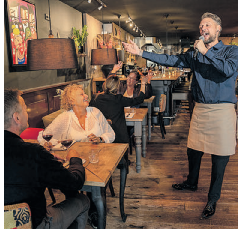
De bediening zorgt niet alleen voor de gerechten, maar ook voor de muziek.