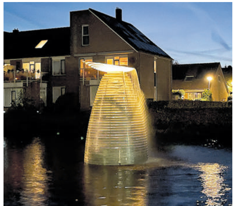
De verlichte Parabool.

nu eenvoudig. Het water wordt uit de Strammer opgepompt en stroomt over het kunstwerk heen naar beneden. Met een tijds klok wordt de pomp aangestuurd. In het Parabool staat een LED-spot die bij zonsondergang het gehele object verlicht.“