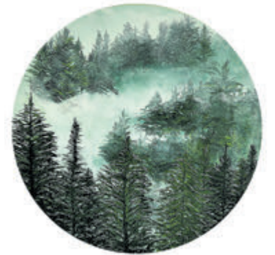
Een voorbeeld van een kerstschilderij.

Adres: Buurt- en Biljartcentrum Castricum, Van Speyckkade 61. Aanmelden via www.miekerozing.nl of neem voor meer informatie contact op per e-mail ( info@miekerozing.nl ) of telefoon (06 10566887).