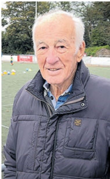
Oud-voetbaltrainer Rob Kramer.

Castricum - Omroep Castricum maakte een portret van Rob Kramer, jarenlang hoofd jeugdopleidingen bij FC Castricum en een icoon in het Nederlandse jeugdvoetbal. Veel Castricumers kennen 'meneer Kramer' nog uit de tijd dat ze zelf, of hun kinderen, voetballen bij FC Castricum. Dit tv-programma is te zien op Omroep Castricum vanaf zondag 17 november.