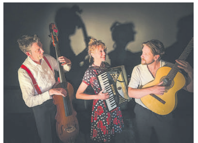
De groep Villa Rosie.

Het concert vindt plaats in de St-Pancratiuskerk aan de Dorpsstraat 115 en begint om 20.00 uur (inloop vanaf 19.15 uur). Kaarten zijn via www.oratoriumcastricum.nl verkrijgbaar. Op de avond van het concert zijn kaarten aan de deur van de kerk verkrijgbaar (betalen contant of per pin).