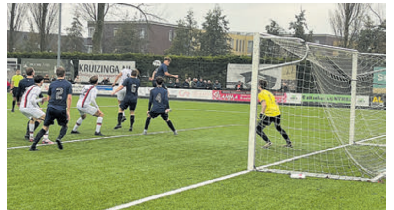
Drukte voor het Limmendoel.

Meervogels wel meteen de gelijkmaker mee, toen Jens Verduijn goed werk van zijn medespelers afmaakte: 1-1. Ruim een kwartier later een corner van SVA: 2-1, tevens ruststand. Na rust had SVA een gat kunnen slaan, ware het niet dat keeper Cas Hoogland een aantal keren uitstekend reddde. De laatste twintig minuten werd achterin 1 op 1 gespeeld maar dat bracht vooral wanorde. In de ontstane chaos scoorde SVA nog drie goals. Eindstand derhalve 5-1. Komende zondag is Meervogels '31 2 vrij, het eerste speelt dan thuis tegen Flevo 1.