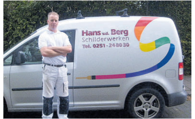
Vraag een vrijblijvende en duidelijke offerte aan.