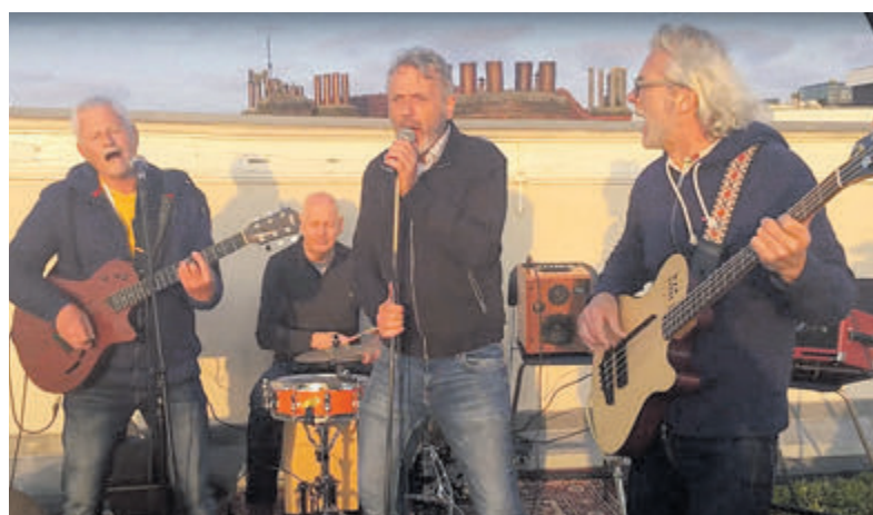
De band Dit is watutis.

Het optreden begint om 15.00 uur en de toegang is gratis, maar een vrijwillige bijdrage voor de muzikanten is welkom. U vindt De Oude Keuken aan de Oude Parklaan 117. Uitgebreide informatie ook op www.deoudekeuken.net te vinden.