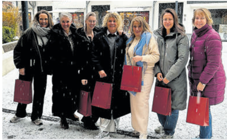
De deelnemende winkeliers heten u hartelijk welkom op de Shoppingnight.

renovatie van het parkeerterreintje ter hoogte van de Ambassadeursflat. De afsluiting van deze belangrijke verkeersader in ons dorp had tot gevolg dat het autoverkeer veelal om moest rijden via de Laan van Albertshoeve en ook de lijnbus werd omgeleid om het station in Castricum te kunnen bereiken.