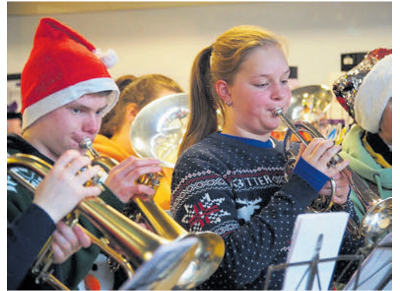
De leden van het opleidingsorkest zorgen voor muziek, warmte en gezelligheid.

De leden van het opleidingsorkest van Emergo bedachten zelf de opzet voor dit warme winterconcert. Behalve dat de leden een concert met kerstmusiek en andere aangename hedendaagse muziek wilden organiseren, willen zij ook graag iets betekenen voor mensen die in de donkere dagen voor kerstmis wel wat vrolijke muziek en extra warmte kunnen gebruiken. Gezelligheid is dan ook een belangrijke factor tijdens dit concert, dus het publiek wordt opgeroepen om na het concert vooral nog even te blijven voor een drankje.