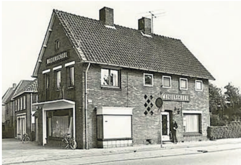
De voormalige muziekschool op de hoek van de Mient en de Ruiterweg.