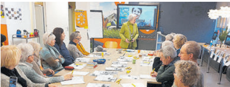
De schrijfactie van Amnesty International in 2023.

Het schrijven van brieven heeft wel degelijk effect. Door de Write for Rights-acties is de situatie van veel mensen verbeterd. De postzakken vol brieven sporen machthebbers aan om onrecht aan te pakken. Vaak helpt de extra aandacht om mensen vrij te krijgen of te zorgen voor bescherming en gerechtigheid. Zo voerde men eerder actie voor kunstenaar Sasha Skochilenko uit Rusland. Ze had in een supermarkt stickertjes op prijskaartjes geplakt om mensen te informeren over de oorlog in Oekraïne. Ze kreeg jaren celstraf voor haar protestactie. Op 1 augustus 2024 kwam ze vrij tijdens een gevangenenruil.