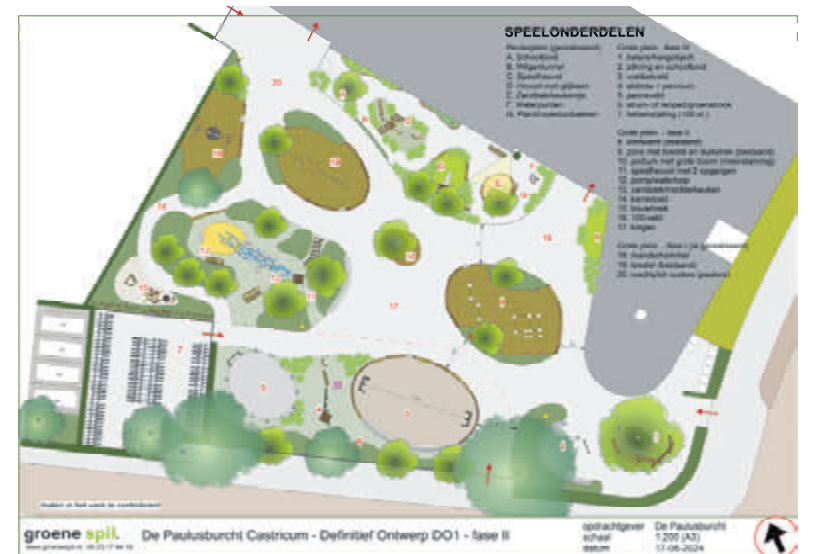
Tekening van de fasen 1 en 2 van het Wensplan. Ontwerp: Groene Spil

Tot slot luidt het antwoord op de vraag wat de leerlingen en de ouders tot nu toe van de herinrichting van het plein vinden: „We hebben heel veel positieve reacties ontvangen. Aan de ene kant ervaart het team dat de leerlingen op een heel andere manier buitenspelen dan voor de vergroening. De andere kant van het verhaal is dat ze ons vertellen hoe leuk ze het vinden!”