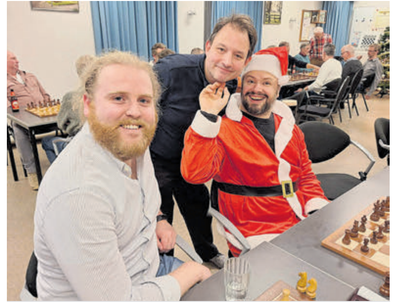
Het immer gezellige kersttoernooi bij SV Vredeburg.