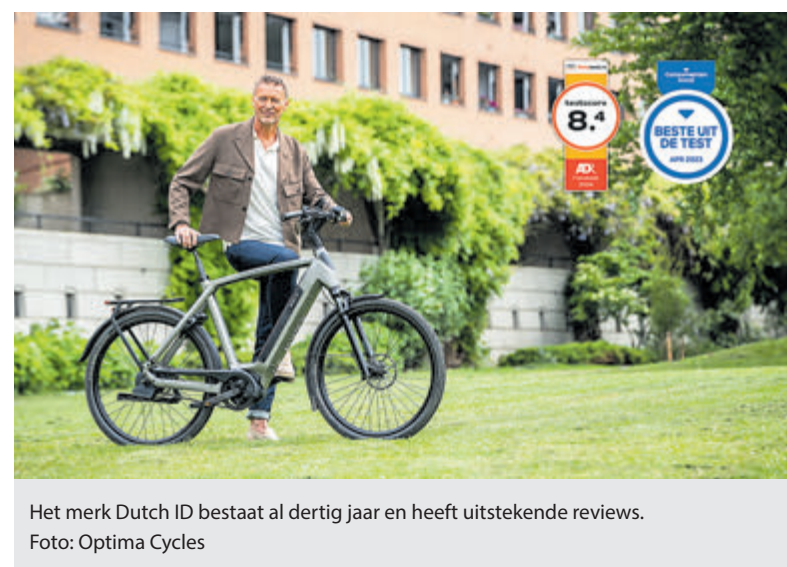
Het merk Dutch ID bestaat al dertig jaar en heeft uitstekende reviews.