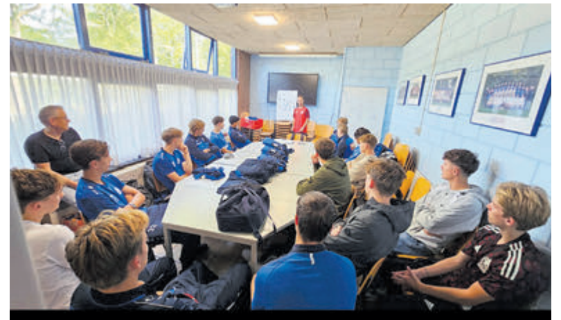
De spelers van FC Castricum 23-1 tijdens de voorbereiding op de wedstrijd.

bepaald wordt door een dobbelsteen tot chaotische taferelen, terwijl de variant waarbij wit met een dame zonder paarden en zwart zonder dame, maar met drie paarden speelde, interessante krachtmetingen opleverde. Net als andere jaren werden de kersttaarten weer verloot en was de rode draad 'ultieme gezelligheid'. Op 3 januari kunnen de snelste spelers van SV Vredeburg hun hart weer ophalen met het jaarlijkse clubkampioenschap snelschaken.