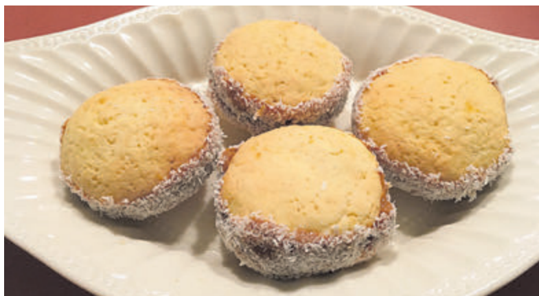
Alfajores, een traditionele Argentijnse lekkernij.

Castricum - Twee maal per maand vinden op zaterdag van 10.00 tot 12.00 uur creatieve activiteiten plaats in het pand van Welzijn Castricum aan de Dorpsstraat 30. Het