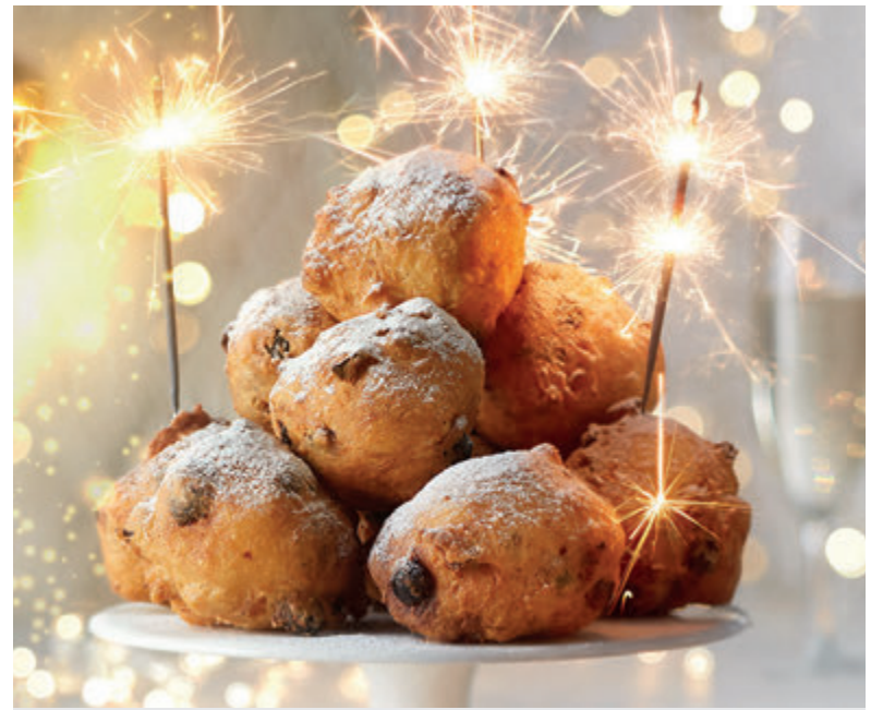
Verse oliebollen: een aanrader voor de jaarwisseling.