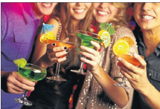
Gezelligheid bij clubMariz.

Castricum - Vrijdag 11 januari zijn er weer voorafgaand aan een nieuwe cursus proeflessen salsa. De beginners zijn welkom vanaf 20.00 uur en de gevorderden vanaf 21.00 uur.