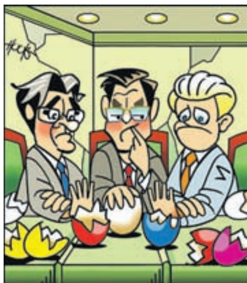
Oplossing elders in de krant