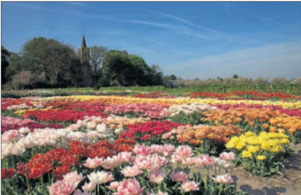
Een bloeiende hortus met op de achtergrond het hervormde kerkje van Limmen.