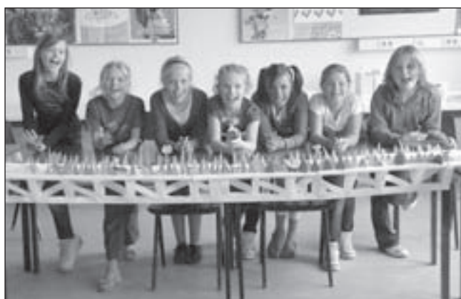
De trotse meiden van groep 6 met hun brug. Deze brug moest, van tafel tot tafel, zolang mogelijk zijn en 100 gram kunnen dragen.