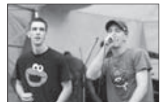
De Castricumse formatie Westerwind.

De hip hop avond vindt vanaf 20:00 uur plaats in Joeb aan de Herenweg 69 in Egmond Binnen. De entree is 3,00 euro.