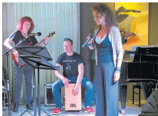
Docenten van Toonbeeld tijdens de opening