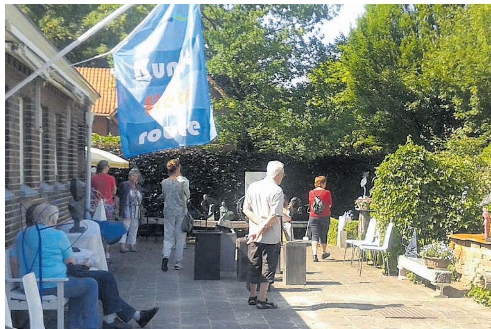
Publiek bij Perspectief

De vrouw bleek tijdens haar gehele vermissing in Lourdes te hebben gezeten.