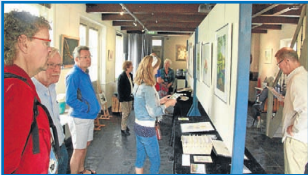
Drukte in de Verfschuur