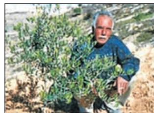
Een Palestijnse boer met een jonge olijfboom.

land van de Olijfboomactie, over haar ervaringen, die ze heeft opgedaan tijdens een verblijf in Palestina gedurende de afgelopen driekwart jaar. Zij heeft in die periode meegewerkt aan de organisatie van de Olijfboomactie in de bezette gebieden. Er zijn inmiddels al meer dan 13.000 olijfbomen vanuit Nederland gesponsord. Na de film is er gelegenheid tot het stellen van vragen of het maken van opmerkingen. Gespreksleider en avondvoorzitter is Dave van Ooijen. De bijeenkomst is in dorpshuis De Kern op de Overtoom 15, aanschouw 19.30 uur. De toegang is