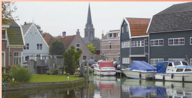
Hoe ziet het Uitgeest van de toekomst eruit? (foto: gemeente Uitgeest).

Voor uitgebreide informatie over de regiotaxi-pas zie de website www.uitgeest.nl