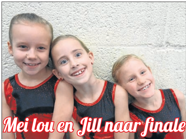
Mei lou en Jill naar finale

sitieve bijdrage aan het milieu. Met het plaatsen van zonnepanelen op onze huurwoningen slaan we dus twee vliegen in één klap.” Huurders ontvangen na het plaatsen van de zonnepanelen een lagere energierekening. Zij betalen wel een iets hogere huur. Deze huurverhoging wordt ruimschoots gecompenseerd door de lagere energierekening. Als huurders kiezen voor het plaatsen van zonnepanelen, levert Kennemer Wonen het complete pakket. Dit pakket bestaat uit de zonnepanelen, een omvormer en de aansluiting in de meterkast. Kennemer Wonen garandeert het beheer en onderhoud van het pakket.