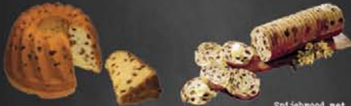
Halve Oudhollandse Putter Tulband