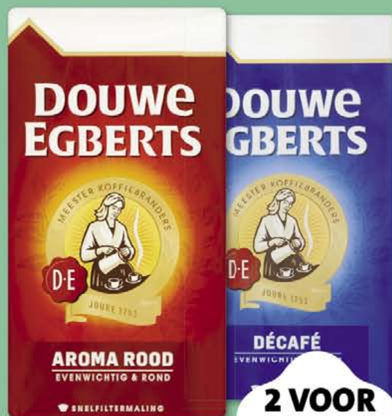
Aroma rood of Décafé

Snelfiltermaling of grove maling. 2 pakken à 500 gram.