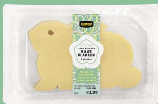
Jumbo Goudse 48+ kaas, jong belegen plakken Pak 150 gram