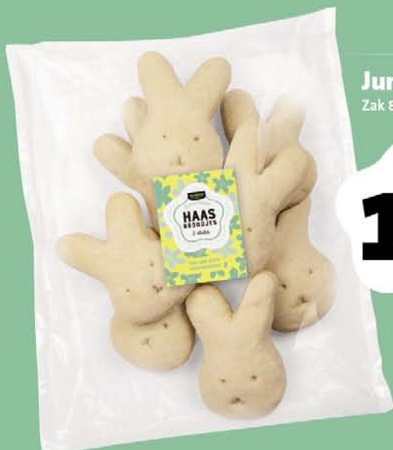
Jumbo haasbroodjes Zak 8 stuks