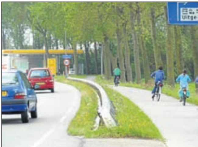
Tegen deze vangrail botste de auto van Jerion del-los-Santos op weg van Castricum naar Uitgeest en kreeg de eerste klap. Die was dermate groot, dat de auto naar de andere kant van de weg schoot.