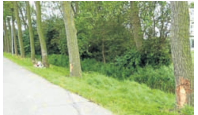
De drie geschampte bomen. Bij de derde boom kwam de auto tot stilstand en vloog in brand.