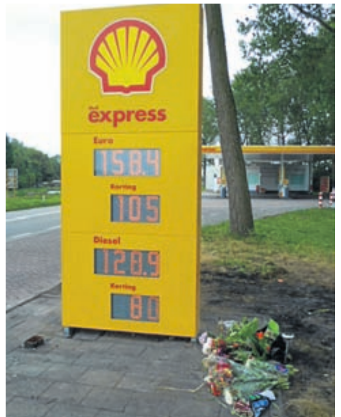
Hoe snel iets kan gaan. Heel snel nadat er eerst een nieuw 50-kilometerbord werd geplaatst, werd eveneens heel snel het aangelichte prijsbord van het tankstation weer geheel nieuw aan de weg neergezet. Beide borden waren bijna geheel verbrand.