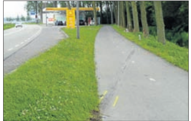
Remsporen over het fietspad.