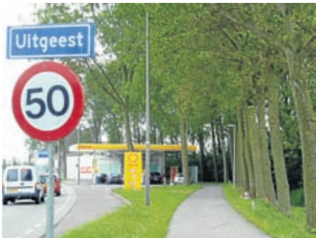
Waarschijnlijk heeft Jerion toen hij aan de overkant van de weg terecht was gekomen weer willen bijsturen, waarna hij vervolgens weer rechts bij het 50-kilometerbordje aankwam, over het fietspad reed en daar drie bomen schampte. De remsporen zijn nog te zien.

(Vervolg van voorpagina). Rondom de Provincialeweg bevinden zich weilanden. In dit natuurgebied moet men rekening