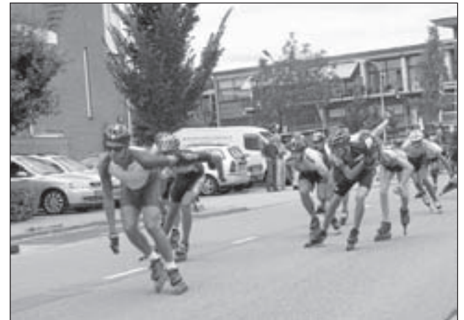
Enthousiaste mededingers van de Skeelerronde van Uitgeest.

men. De Kleiswijzer heeft een doeltreffende functie en wordt bij 1600 woningen bezorgd. Je kunt er drie keer per jaar al het op de wijk betreffende nieuws vinden, zoals nieuws van de basisscholen De Kornak en de Wis-sel, nieuws van de Stichting Uitgeester Senioren en nieuws van het jongeren centrum Millhouse. Voorts passeren allerlei interessante onderwerpen de revue. Zo kan men er onder meer interviews in terugvinden met een Uitgeester ondernemer, een wijkagent of één of ander interessant persoon uit de wijken, is er altijd wel iets over de historie in terug te vinden, kan men er nieuws over de kerken in lezen of leest men alles over de nieuwe bouwontwikkelingen. Kortom: door een actieve wijkvereniging en een informatief wijkblad kan een wijk een wijk zijn, waar het aangenaam vertoeven is en waar je je betrokken voelt bij je omgeving. Voor meer informatie, zie de website: www.dekleis.nl . (Marga Wiersma)